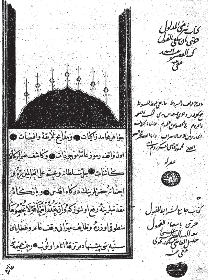
Ibrahim Paşa'ya âit ikinci vakfiyenin baş sehifesi.