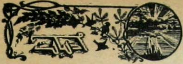
ادبی مسأله دائر