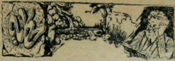
محمدجک « دن بر پارچه دا »