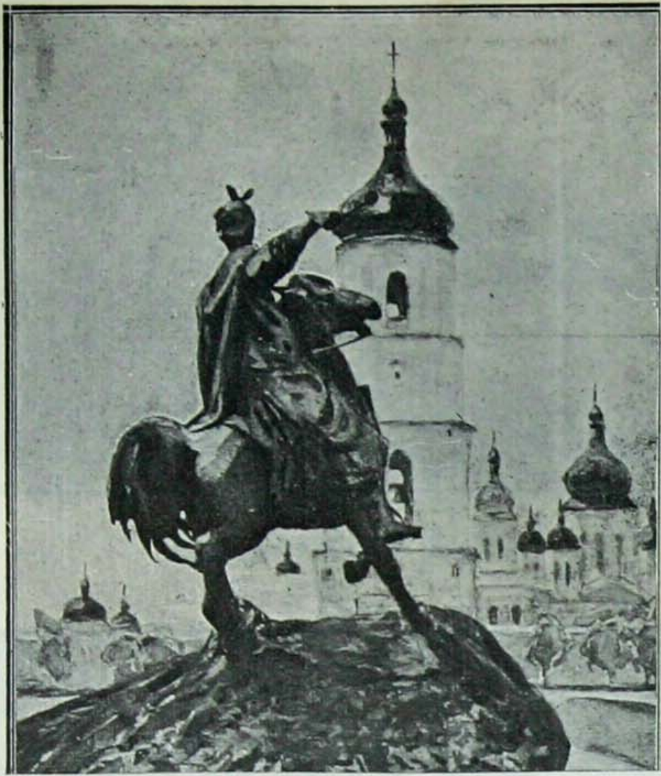
( بوغدا نه قهرمانلرینی ) نك لهیقلی

اسلاو ادبیاتنده اوقرانیا استه پلرینك خصوصی و مستثنا بر موقعی واردر . شرقی اوروپا اسلاو شاعر و محرر لرینك چوغی استه پلرک کوزللكلرینی و بوراده حر یاشایان قازاقلرک قهرمانلقلرینی تصویر اوترنم ایتملردر . غوغولک ( تاراس بولیا ) سنك موضوعی اوقرانیا نك پولونیا به قارشى اوزون وقانلی مجادله سیدر . بویوك روس لسانیه یازان قولچوف ( ۱۸۰۸ -