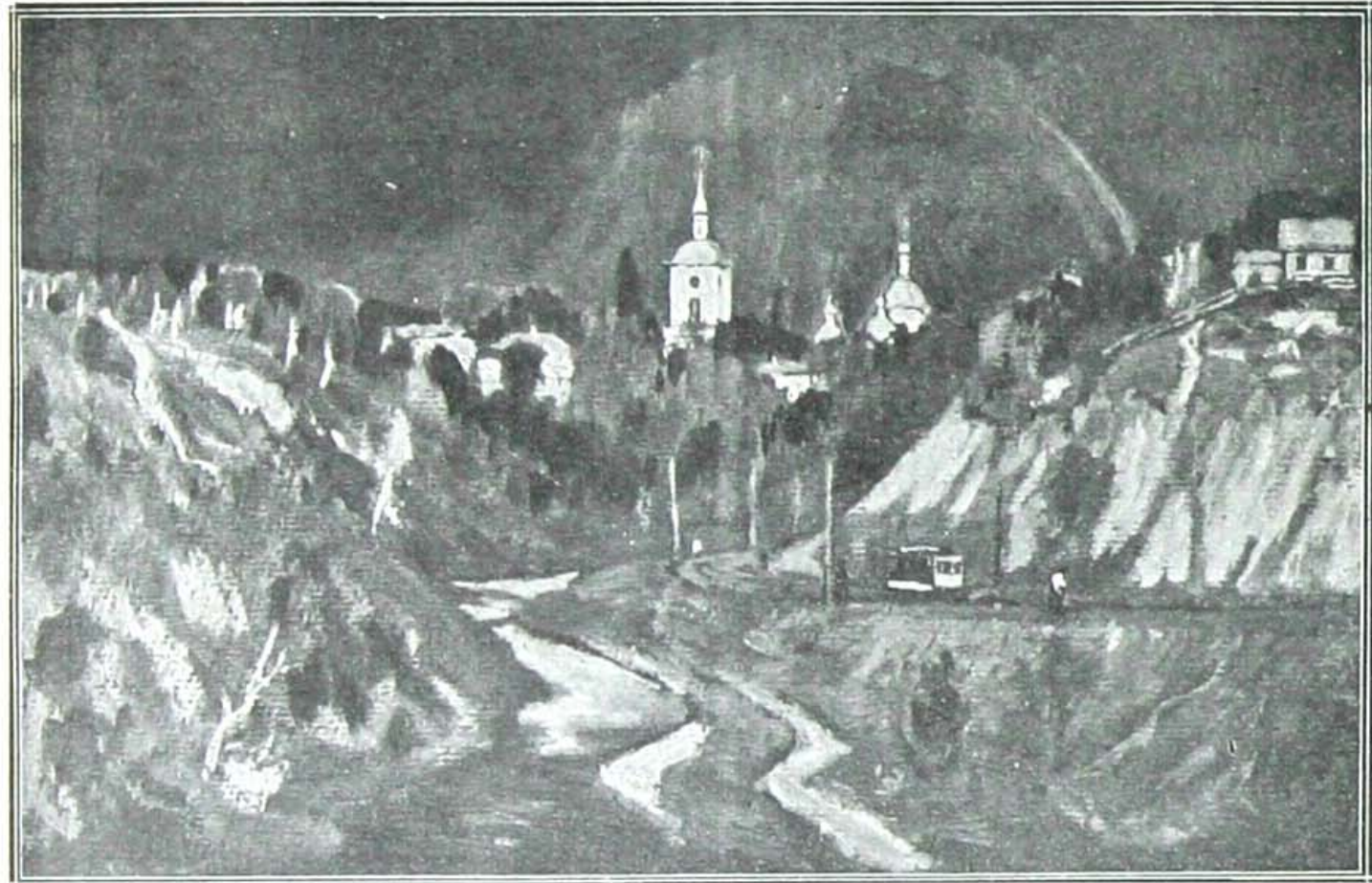
كېفەندە ( كېرەلورفا ) بىر كېرە بر بول

دېنە پر ك فىضان كونلرندە قايب اولان آداجلر صولر چكىلدىكەن سوكر ايكىدن ميدانە چىقار ؛ ونەرلر ك يوزندە رىكلىرىنى هىچ بر سام فىرچاسنىك تىيىت ايدە ميه جىكى طلوع وغروب لوحەلىرى سىرايدىلر ، قوش جىويلتىلر آرىلر ك ، بوچكلر ك وىزىلتىلر قارىشىر بو اسرارلى موسىقى بوتون استەپنى صارار ؛ آقشام آغىر آغىر يايىلر كىن بو قونسردور وروخففى سرىن بر روزكار ك او قشاملرى ايله اورپرن استەپ سماك طاتلى لاجوردىسى اىچندە پىرلانطەلر كى تېرەشنى بىلدىلر ك آلتندە درىن وراحت بر