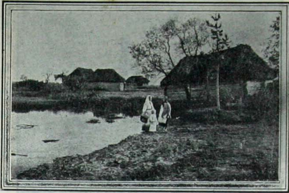
اوقراياده بر كوچوك كرى

قولاغوزلى اولاده پيلدزلى آراشېر بيورم .. ياربىلدايه بر بولوطميدر و اولاده بوكسلى فخرميدر؟ .. هابير! .. ياربىلدايه دېنيستور و اولاده دېم دېك دوراده ده آق كرمانه فذير ..