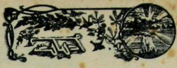
بو یوک ادبی مسالته دائر :