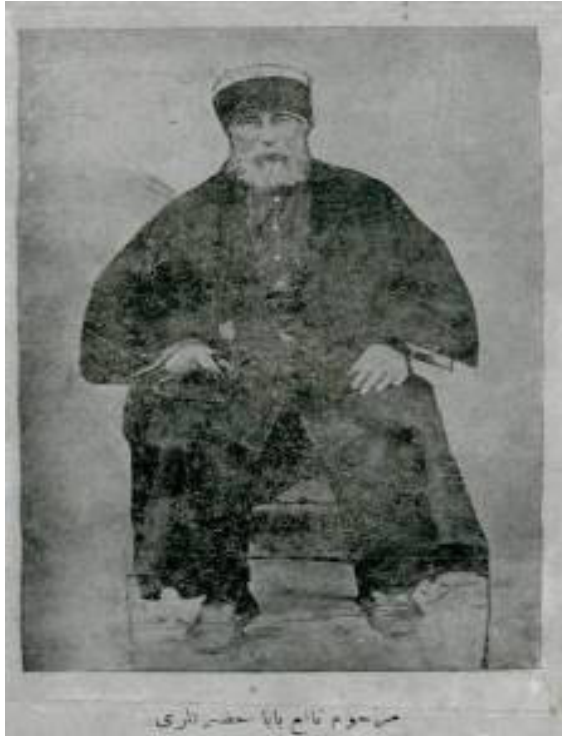
Görsel 1: Şehitlik Tekkesi Şeyhi Nafi Baba

Nafi Baba, Rumelihisarı'nda Şehitlik Tekkesi olarak bilinen ve 1826 yılında kapatılan tekkede hizmet yürütmektedir. 1826 yılında tekke kapatıldığında babası Mahmud Baba ve beraberindeki dervişlerle birlikte altı yıllığına Kayseri'ye sürülmüştür. Bu dönemdeki faaliyetleri nedeniyle Mahmud Baba tekkesi olarak da tanınmıştır. Mahmud Baba'nın vefatı ardından oğlu Nafi Baba hizmeti yürütmeye devam etmiştir. Nafi Baba halifelik icazetini Ali Tûrabi Dede Baba'dan Hacı Bektaş Tekkesinde almıştır. Rumelihisarı'ndaki Şehitlik Tekkesi, Mahmud Baba Tekkesi olarak anıldığı gibi Nafi Baba'nın faaliyetleri nedeniyle Nafi Baba Tekkesi olarak da anılmaktadır (Birinci, 2010, ss. 59-62; Maden, 2019, ss. 165-179).