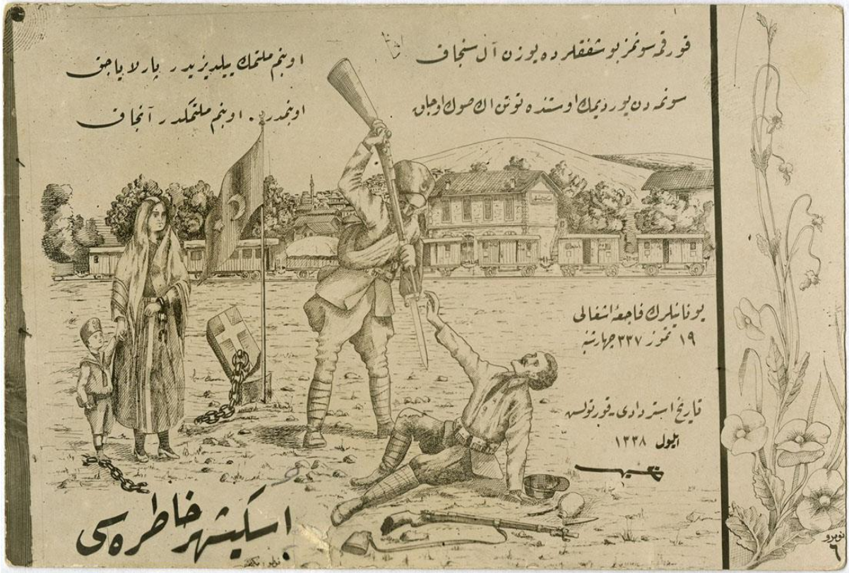
EK-5: İstiklâl Harbi Kartpostalları-Eskişehir Hatırası