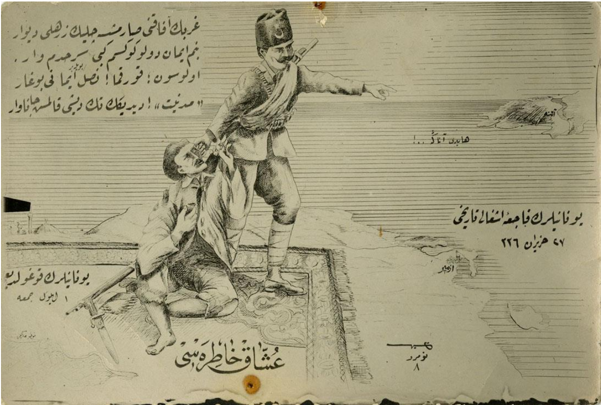
EK-8: İtiklal Hatbi Kartpostalları-Uşak Hatırası