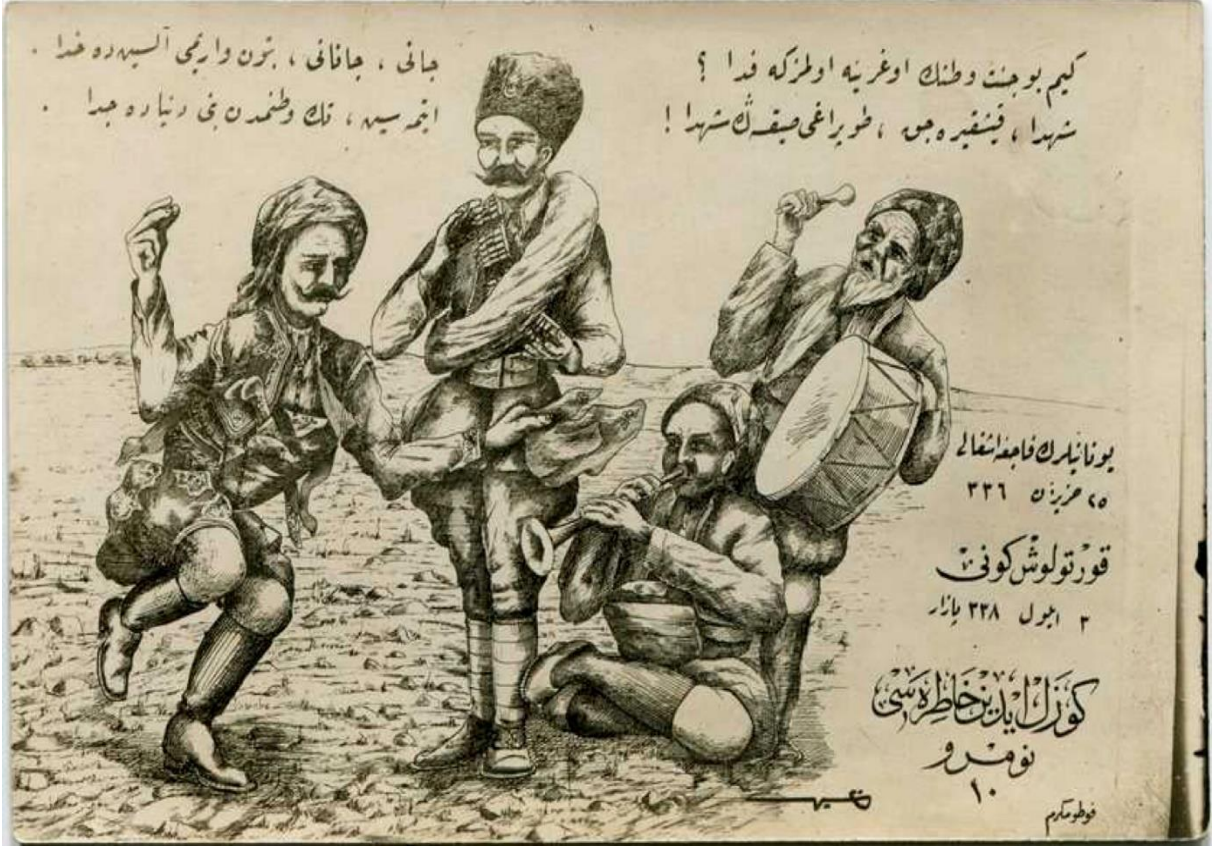
EK-7: İstiklal Harbi Kartpostalları-Aydın Hatırası