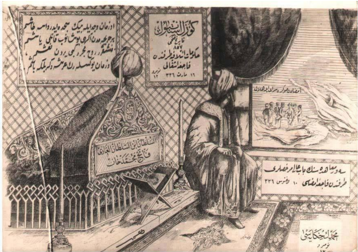
EK-6: İstiklâl Harbi Kartpostalları-İstanbul Hatırası