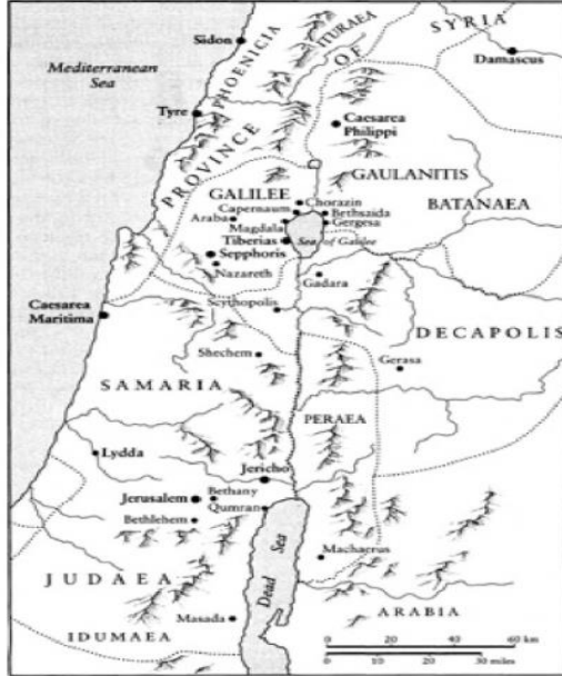
Palestine in the age of Jesus