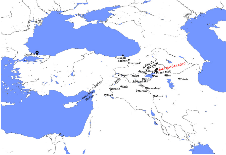
Ek-2: Baba Haydar Köyü'nü gösteren harita