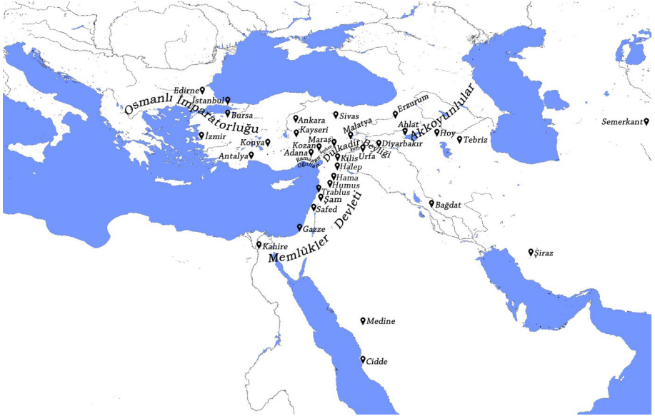
Ek-1: 15. yüzyılın ikinci yarısında bölgede hâkimiyet tesis etmiş devletleri ve beylikleri gösteren harita.