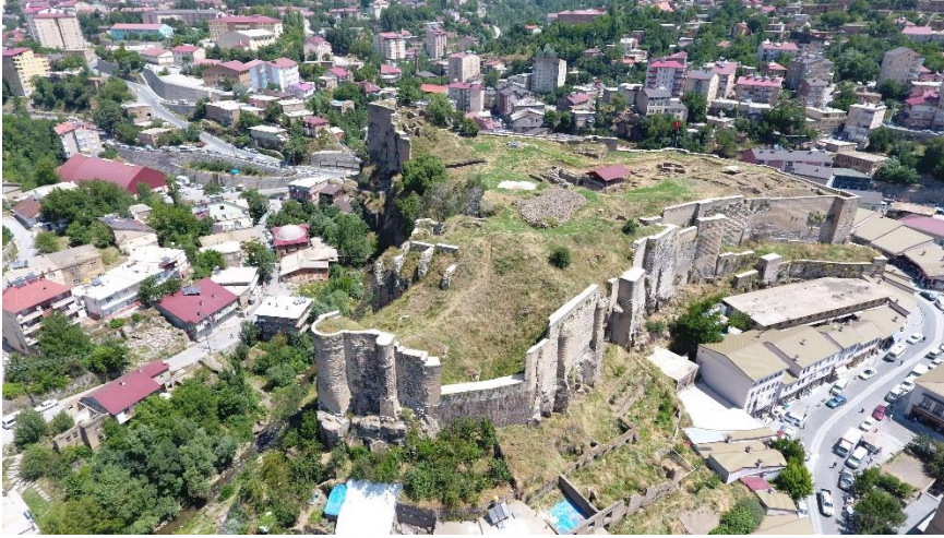
Bitlis Kalesinin Genel Görünüşü

Bitlis, Doğu Anadolu bölgesinin Van gölü havzası içerisinde yer almaktadır. Doğusunda Van Gölü, güneyinde Siirt, güneybatısında Batman ve kuzeybatısında Muş ili bulunmaktadır. Dar bir vadiden akan ve Dicle suyunun da kollarından birini oluşturan Botan suyuna karışan Bitlis Çayı'nın etrafında kurulmuştur 2 . Şehrin tam merkezinde tarihi Bitlis kalesi yer almaktadır. İlk yerleşimin de bu kale ile birlikte oluştuğu değerlendirilmektedir.