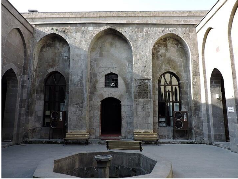
Bitlis Ulu Camii Kuzey Cephesi ve Kitabe yeri