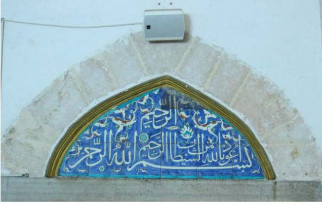
Mihrabın Sağındaki 1 Nolu Pencere Alınlığı Çini Panosu