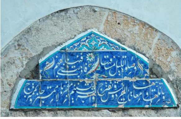
11 Nolu Çini Pano