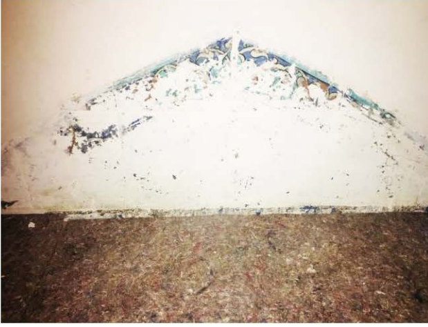
6 Nolu Sıva Altında Kalan Çini Pano