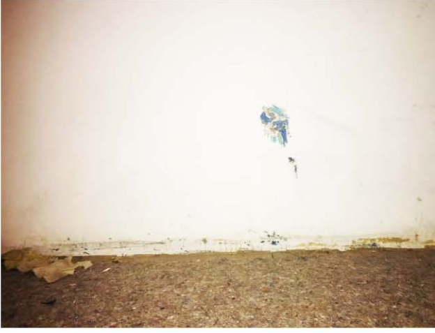
5 Nolu Sıva Altında Kalan Çini Pano