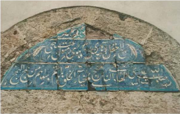
12 Nolu Çini Pano (Antalya Müzesi'nde)