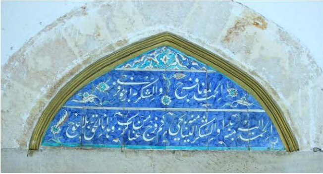
Mihrabın Solundaki 2 Nolu Pencere Alınlığı Çini Panosu