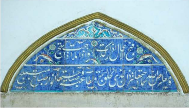
9 Nolu Çini Pano