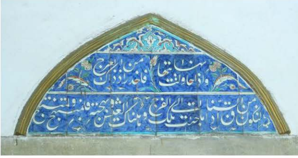
8 Nolu Çini Pano