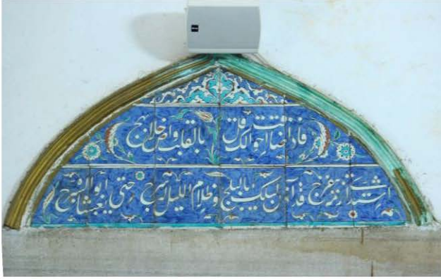
3 Nolu Çini Pano