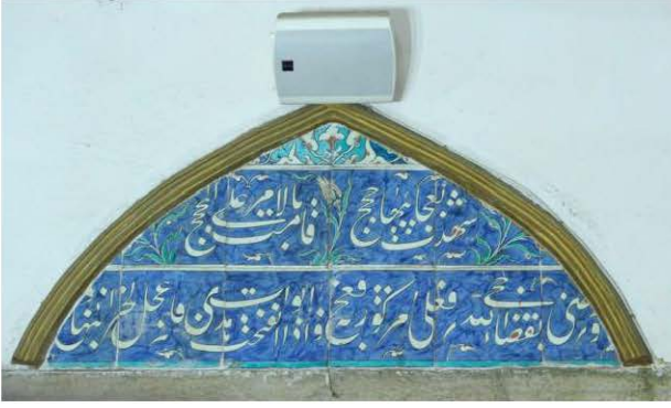
7 Nolu Çini Pano