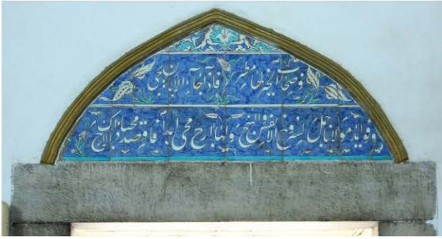
4 Nolu Çini Pano