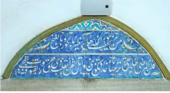
10 Nolu Çini Pano