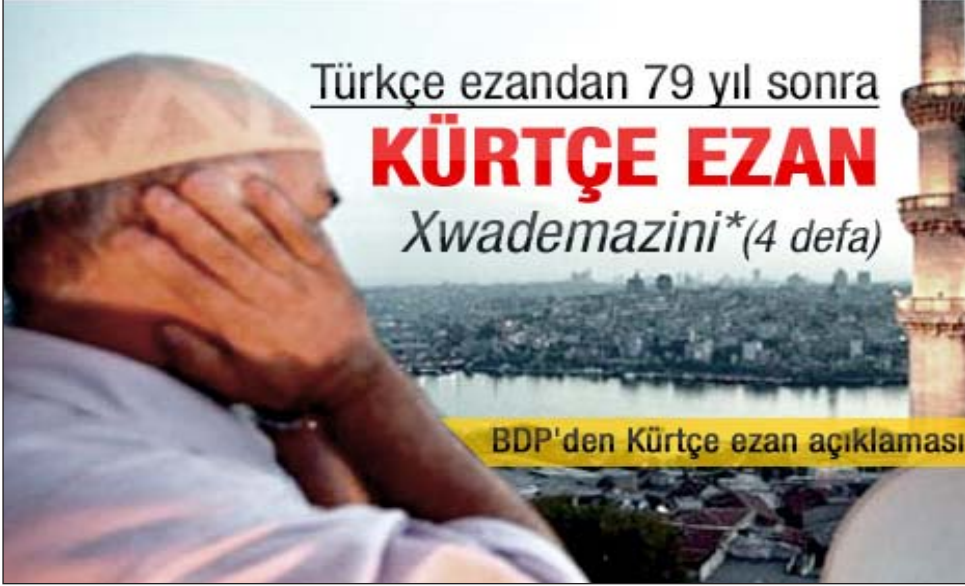
Kürtçe Ezan haberi 163

la ilgili gelişmeleri anlattığımız bu çalışmamızda kısa da olsa bu gelişmeye işaret etmek istedik. Kürtçe ezanın şu şekilde olduğu o dönemki bazı gazetelerde yer almıştır: “Xwademazini - Allah büyüktür (4 defa), Be vi tıXwadetınnani - O’ndan başka ilah yoktur (2 defa), Muhammed şandiyexwade’ye - Muhammed O’nun elçisidir (2 defa), Varın nımejye- Haydi namaza (2 defa), Varın rıhatiye - Haydi felaha (2 defa), Xwademazini - Allah büyüktür (2 defa), Be vi tıXwadetınnani - O’ndan başka ilah yoktur (2 defa).” 162