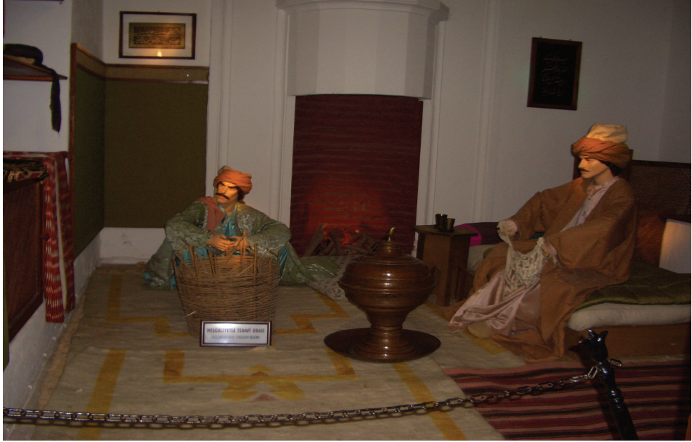
Edirne II.Beyazıd Külliyesi Tıp Medresesi'nde meşguliyetle tedavi