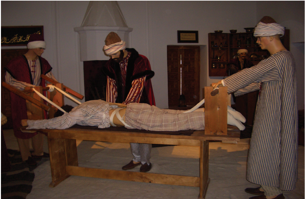
Edirne II.Beyazıd Külliyesi Tıp Medresesi'nde bir tedavi.