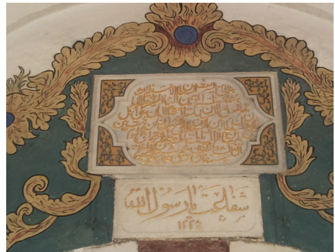
Dar'ul-Hadis Camii Kitabesi