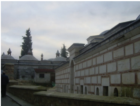
Saatli ve Peykler Medresesi (Üç Şerefeli Camii Medreseleri)