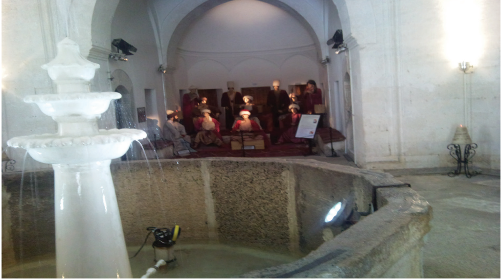
Edirne II.Beyazıd Külliyesi Şifahane Bölümünde Su ve Musiki ile tedavi