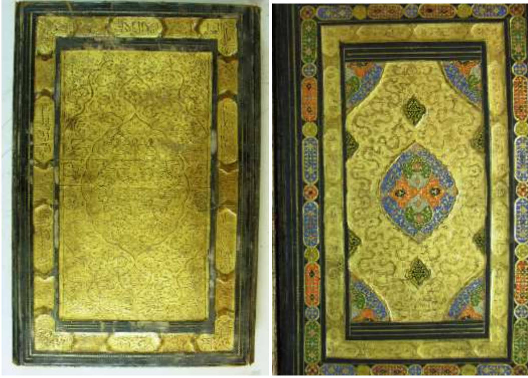
Resim 2: Süleymaniye Kütüphanesi, Sultan Ahmed I, 00014 envanter no'lu