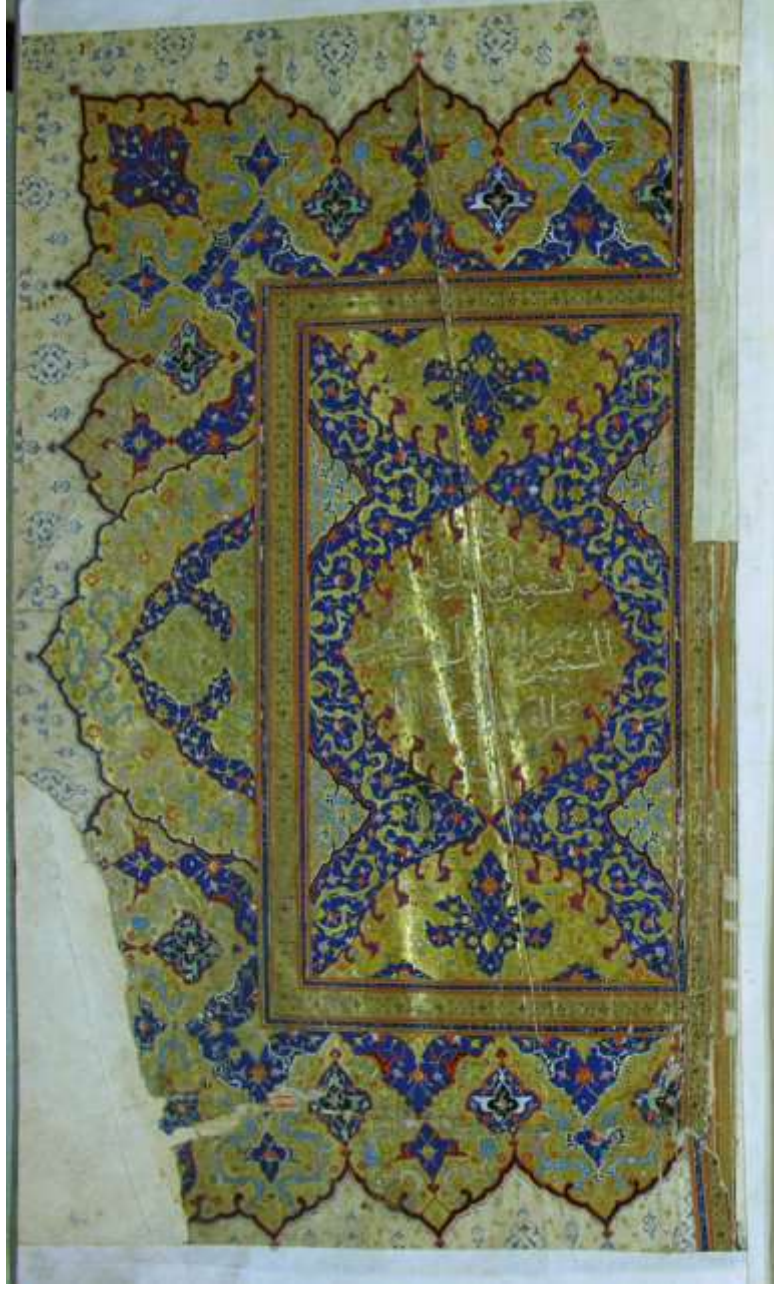
Resim 6: Süleymaniye Kütüphanesi, Sultan Ahmed I, 00019 envanter no'lu