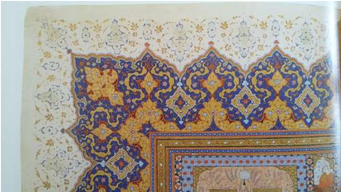
Resim 13: Topkapı Sarayı Müzesi Kütüphanesi M.1574 tarihli Şahname-i Firdevsi'nin