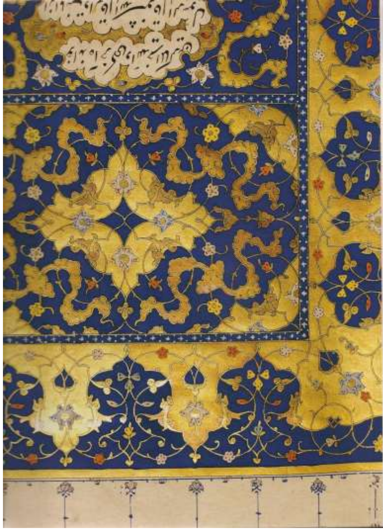
Resim 1: TİEM 1980, Külliyyat-ı Dehlevi'nin ünvan sayfasından detay (XVI.Yüzyıl Şiraz El Yazmaları(Türkmen Valiler, Şirazlı Ustalar, Osmalı Okurlar), İstanbul 2006, s.94,“Türkiye İş Bankası Yayınları”