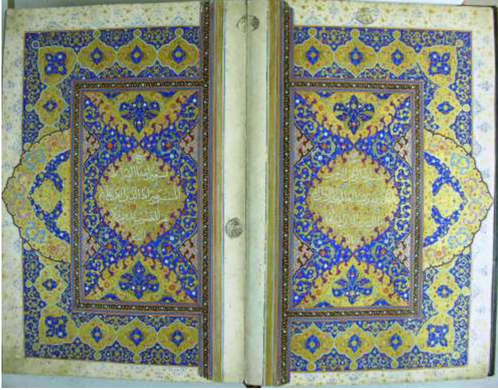
Resim 9: Süleymaniye Kütüphanesi, Sultan Ahmed I, 00020 envanter no'lu Kur'an-ı Kerim'in serlevhası