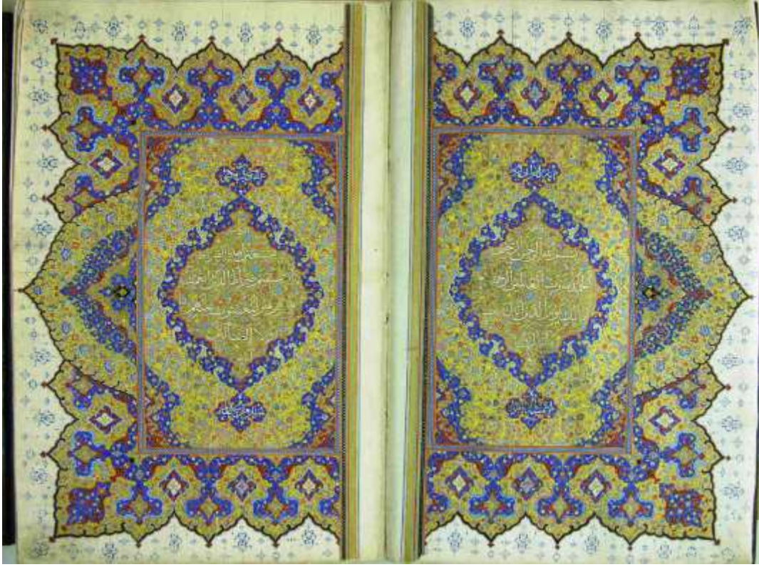
Resim 3: Süleymaniye Kütüphanesi, Sultan Ahmed I, 00014 envanter no'lu