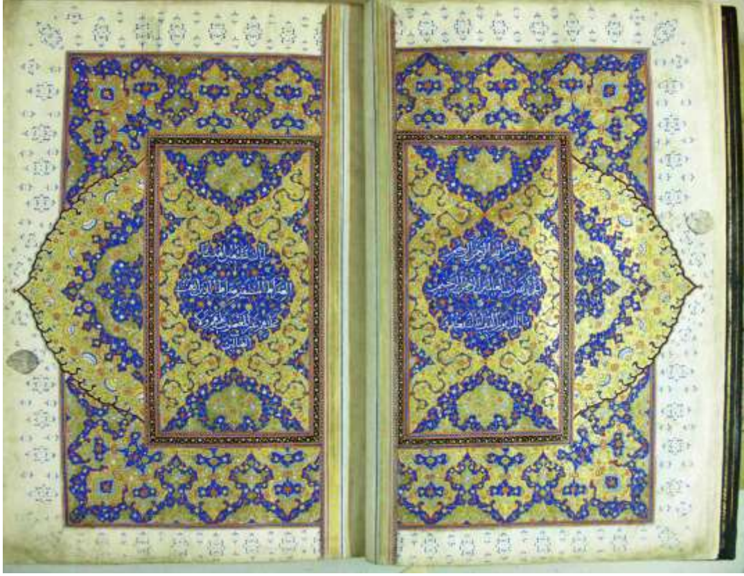
Resim 12: Süleymaniye Kütüphanesi, Sultan Ahmed I, 00022 envanter no'lu Kur'an-ı Kerim'in serlevhası