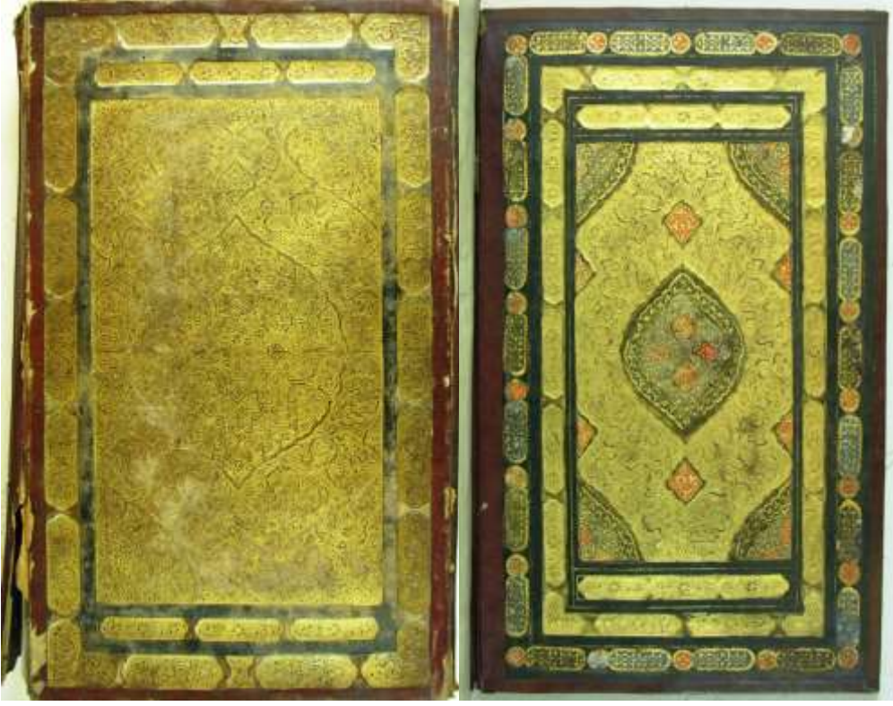
Resim 5: Süleymaniye Kütüphanesi, Sultan Ahmed I, 00019 envanter no'lu