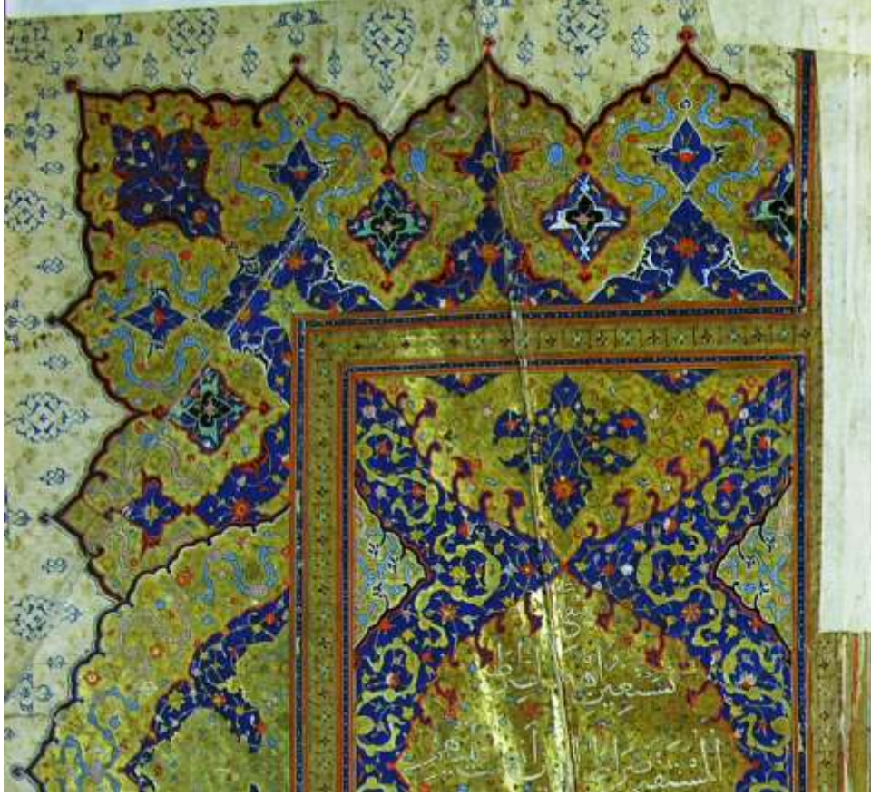
Resim 7: Süleymaniye Kütüphanesi, Sultan Ahmed I, 00019 envanter no'lu Kur'an-ı Kerim'in serlevhasından detay