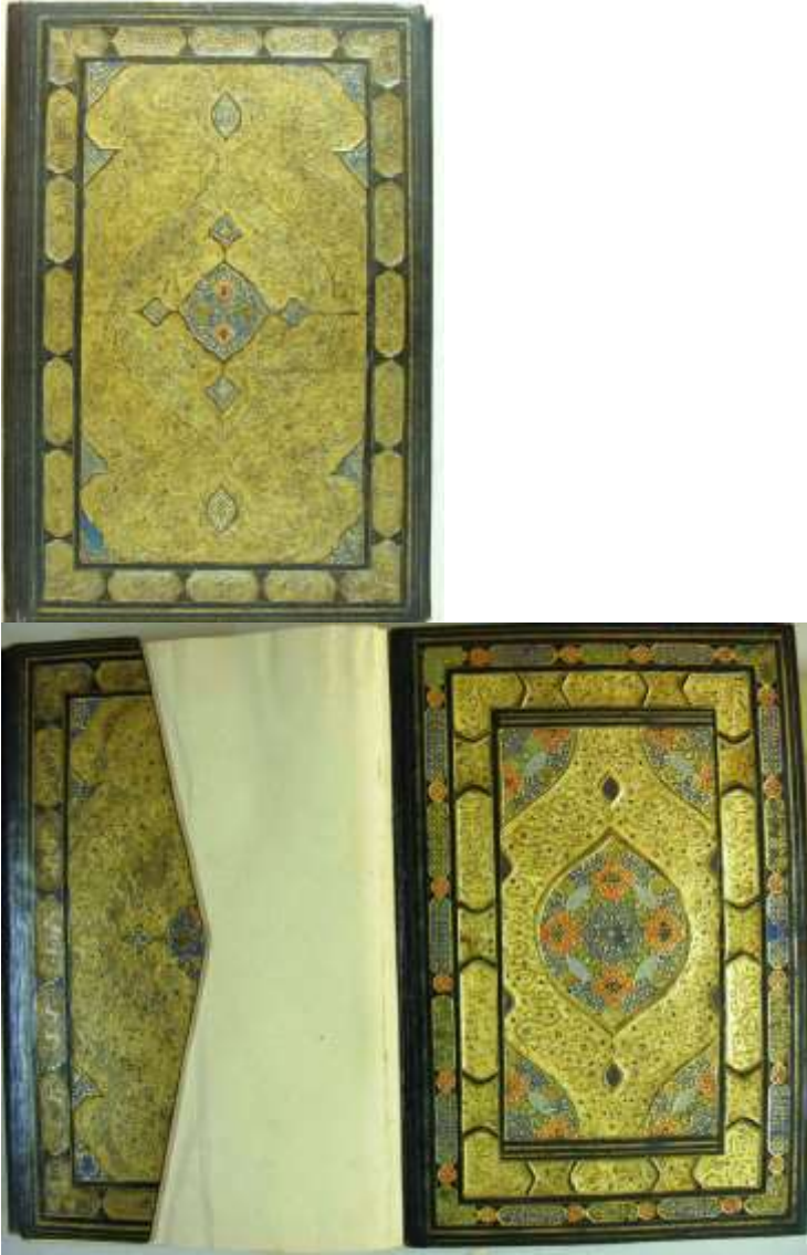
Resim 11: Süleymaniye Kütüphanesi, Sultan Ahmed I, 00022 envanter no'lu

Kur'an-ı Kerim'in serlevha sayfasından detay