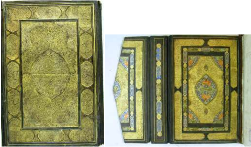
Resim 8: Süleymaniye Kütüphanesi, Sultan Ahmed I, 00020 envanter no'lu Kur'an-ı Kerim'in kab dışı ve iç