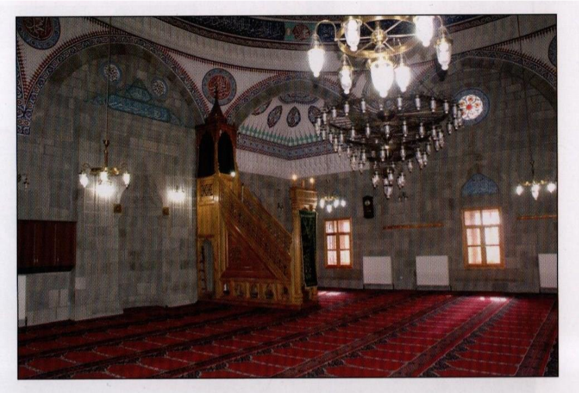
Resim 4 . Erzurum Murat Paşa Cami İç Mekandan Genel Görünüm.

Caminin doğu ve batı cephelerinde sivri kemer alınlıklı üçer pencere üstünde yuvarlak bir pencere yer alırken, kuzey cephesinde altta sivri kemerli ikişer pencere, güneyde üstte ikişer yuvarlak pencere bulunmaktadır.