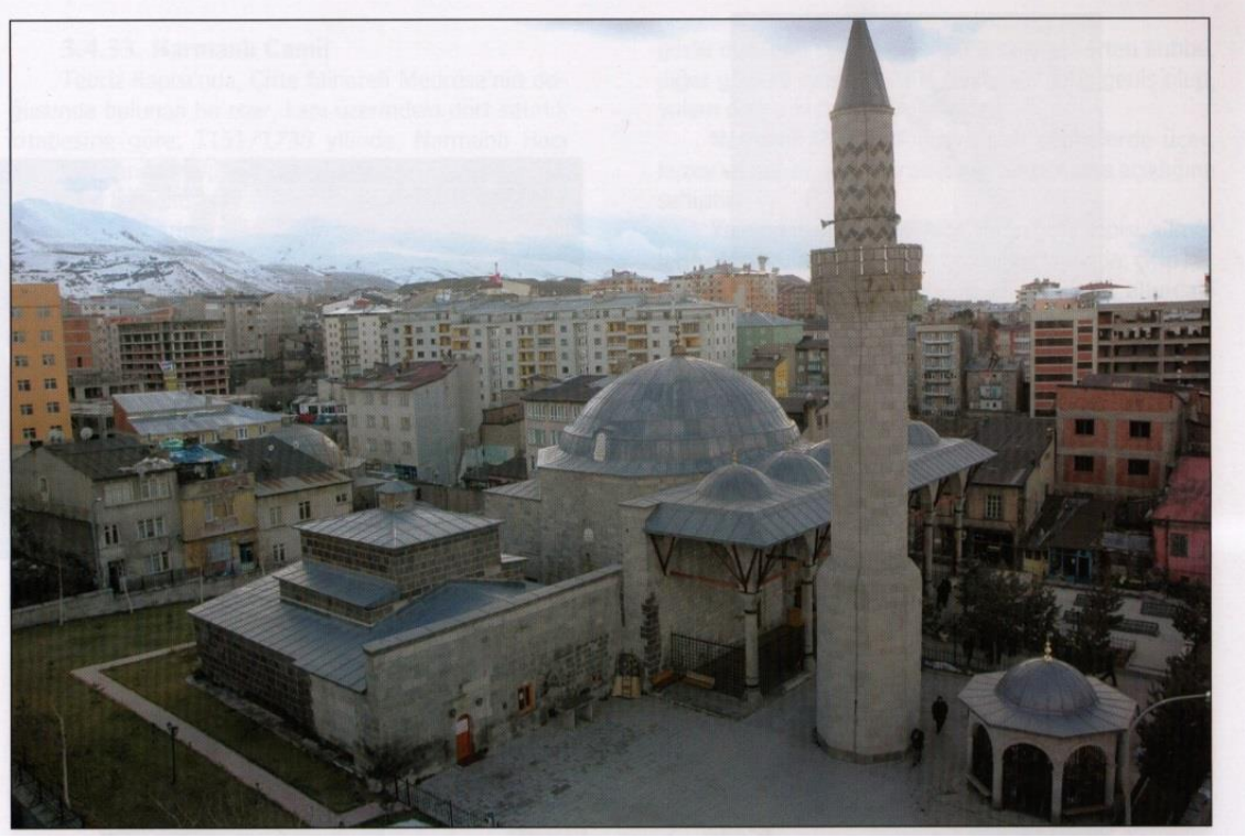
Resim 1 . Erzurum Murat Paşa Cami Genel Görünüm.

Cami Murat Paşa mahallesinde yer almakta, bu cami de Lala Paşa Cami gibi, beş bölümlü son cemaat yeri ve ana kubbenin örtüldüğü kare bir plana sahiptir.