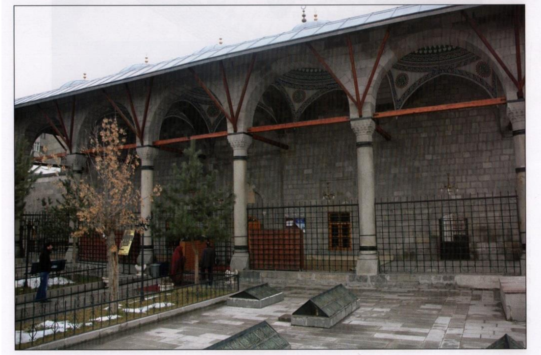
Resim 3 . Erzurum Murat Paşa Cami Dış Mekanı İç Avlu Genel Görünüm.

Caminin doğu ve batı cephelerinde sivri kemer alınlıklı üçer pencere üstünde yuvarlak bir pencere yer alırken, kuzey cephesinde altta sivri kemerli ikişer pencere, güneyde üstte ikişer yuvarlak pencere bulunmaktadır.