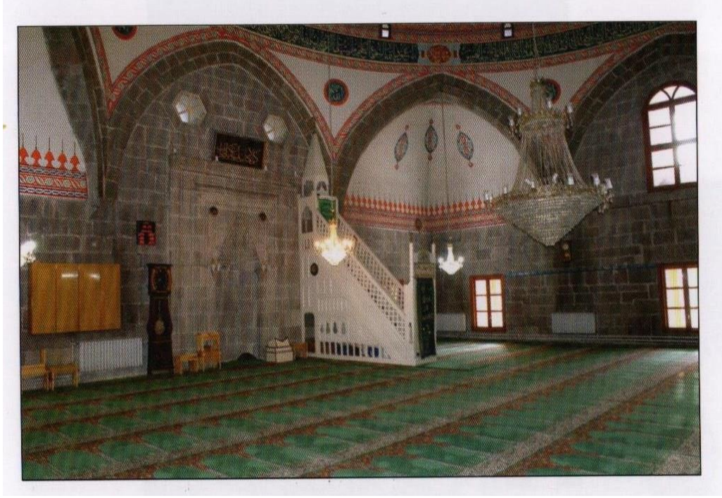
Foto :: 3. Erzurum Narmanlı Cami İç Mekanı

Minber camii mihrabının hemen sağında yer almış, ahşaptan yapılmış olan minber çakma tekniğinde ortaya konulmuştur. Minber oldukça sade bir şekilde ele alınmış, fazla bezemeye yer verilmemiştir. Estetik açıdan değerlendirildiğinde, ince bir işçiliğini yansıtmadığı görülür. Yağlı boya ile boyanmış olan minberin boyutları, minberin yüksekliği 4.85 m, (külâh hariç), minberin uzunluğu 3.63 m, minberin genişliği 83 m.dir. Mihrap ile hemen hemen aynı boyutlarda düzenlenmiş olan minber on bir basamaktan oluşmakta, basamak genişlik olarak 0.20 m. boyu 0.69 m. olarak ele alınmıştır 9 (Resim 3).