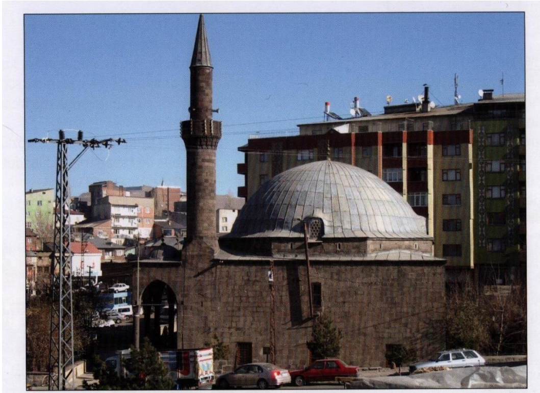
Foto .: 1 . Erzurum Narmanlı Cami