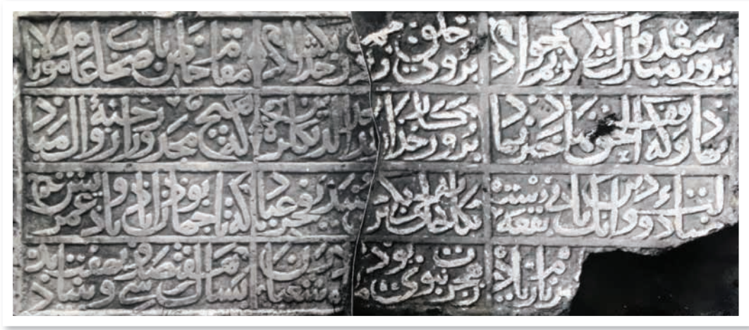
Şa'ban 737 tarihli kitabe (Tokat Müzesi, Env. Deft., nr. 46.2.30, sıra nr. 488)

Tokatlı meslekdaşım Erhan Afyoncu ile yaptığımız bir araştırma sırasında o zamanki müze (Gök Medrese) bahçesinde çektiğimiz fotoğraflar arasında diğer parçanınki de bulunmaktadır. Parçaların bizim ölçümlerimize göre ebatları 58x51x10 ve 59x51x10 cm.dir. Bu iki parça birleştirildiğinde kitabe metninin Farsça manzum olduğu ve gazel nazım şekliyle yazılan altı beyitten oluşturulduğu görülmektedir. Mısralar dört satır ve üç sütun halinde sıralanmıştır. Kitabe metni celî sülûs hat ile yazılmıştır.