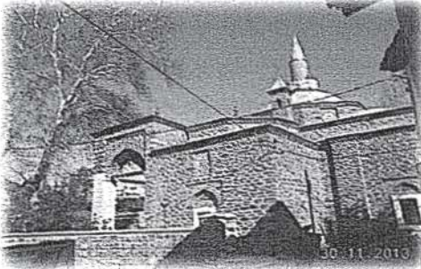
Resim 5- Tire Mevlevîhânesi – Yeşil İmaret