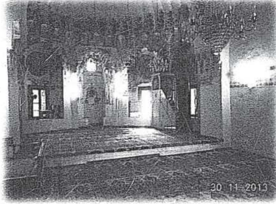
Resim 7- Tire Mevlevihânesi - Yeşil İmaret