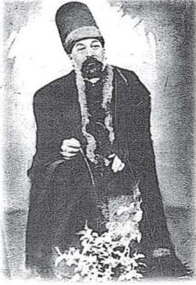
Resim 1- Şeyh Nureddin Efendi