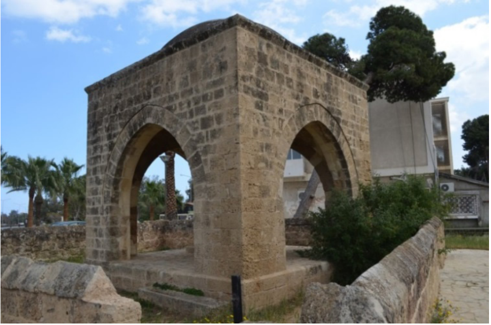
Osmanlı Mezarlığı Büyük Açık Türbe