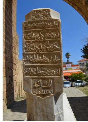
Yirmisekiz Çelebi Mehmed Efendi Mezarı