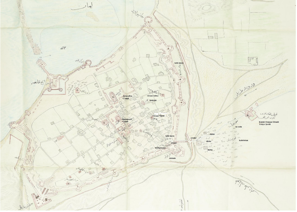
1872 tarihli harita (BOA, SD-02379-00048-001)