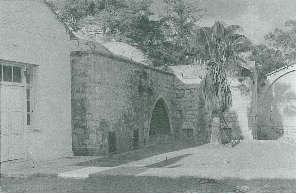
Kutup Osman Tekkesi (mescid ve ön mekâna avludan bakış, 1973 / Oğuz Çuhadaroğlu'dan)