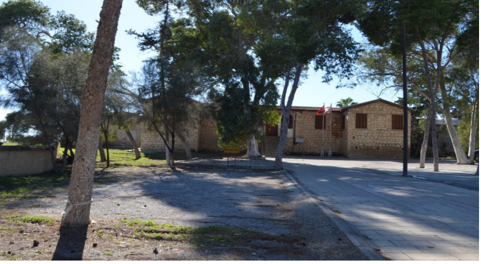
Kutup Osman Tekkesi (doğu cephesi)