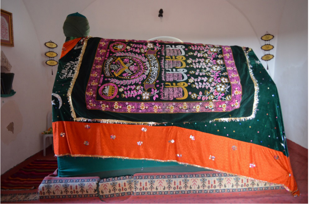
Kutup Osman Türbesi (iç mekân)