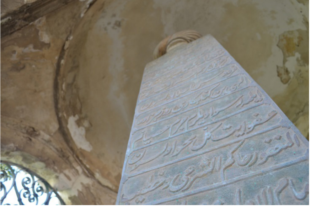
Mustafa Zühtü Efendi Türbesi (iç)