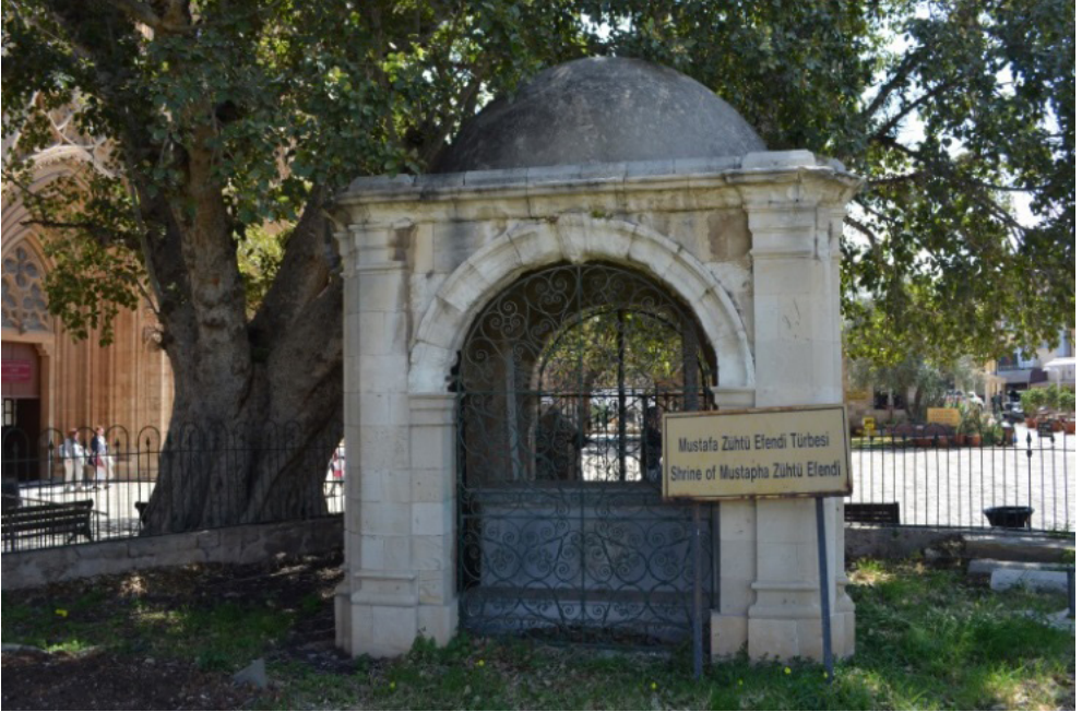
Suriçi Mustafa Zühtü Efendi Türbesi