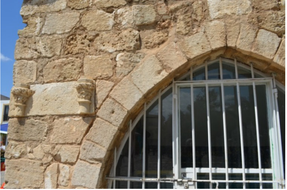
Suriçi Şam Müftüsü Ömer Efendi Türbesi (detay)