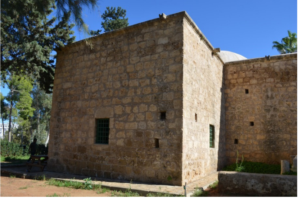
Kutup Osman Türbesi (kuzey ve batı cepheleri, sağ taraf meşid kısmı)