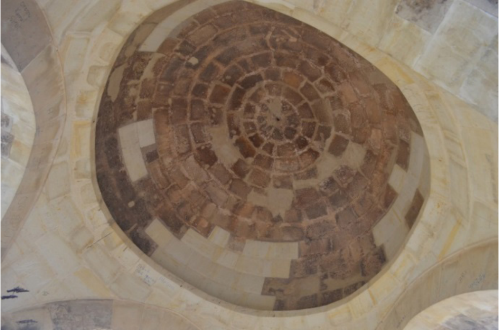
Osmanlı Mezarlığı Küçük Açık Türbe