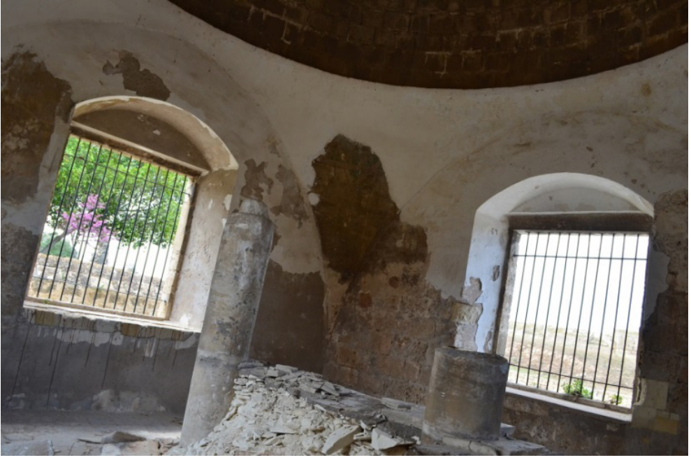
Kapalı Türbe (iç)