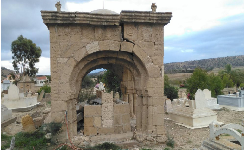
Yeni İskele Balalan Köyü Türbesi