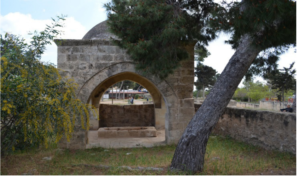
Osmanlı Mezarlığı Küçük Açık Türbe