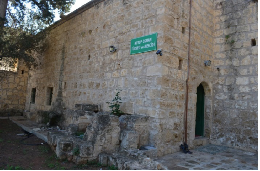
Kutup Osman Türbesi (meşid girişi)