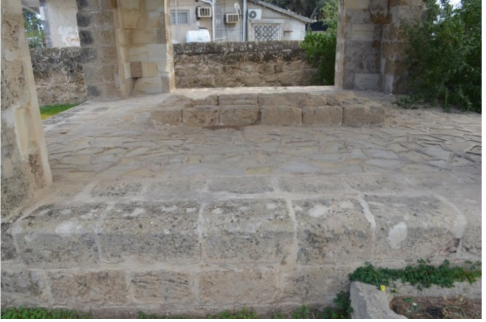
Osmanlı Mezarlığı Büyük Açık Türbe