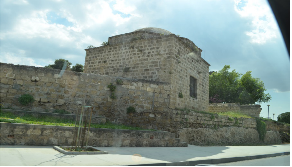
Osmanlı Mezarlığı Kapalı Türbe