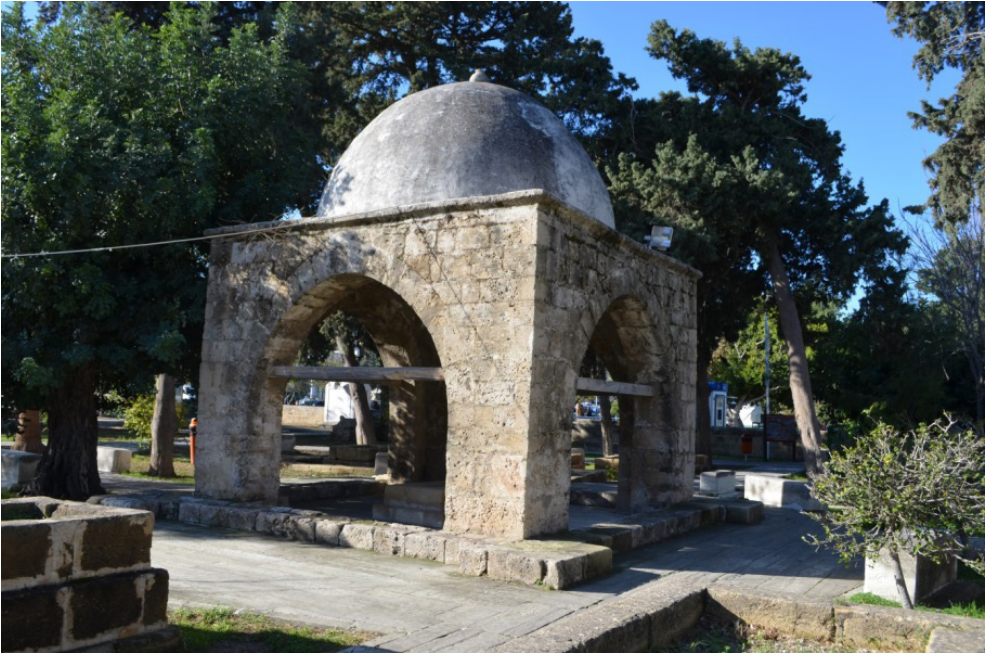
Girne Baldöken Mezarlığı Türbesi