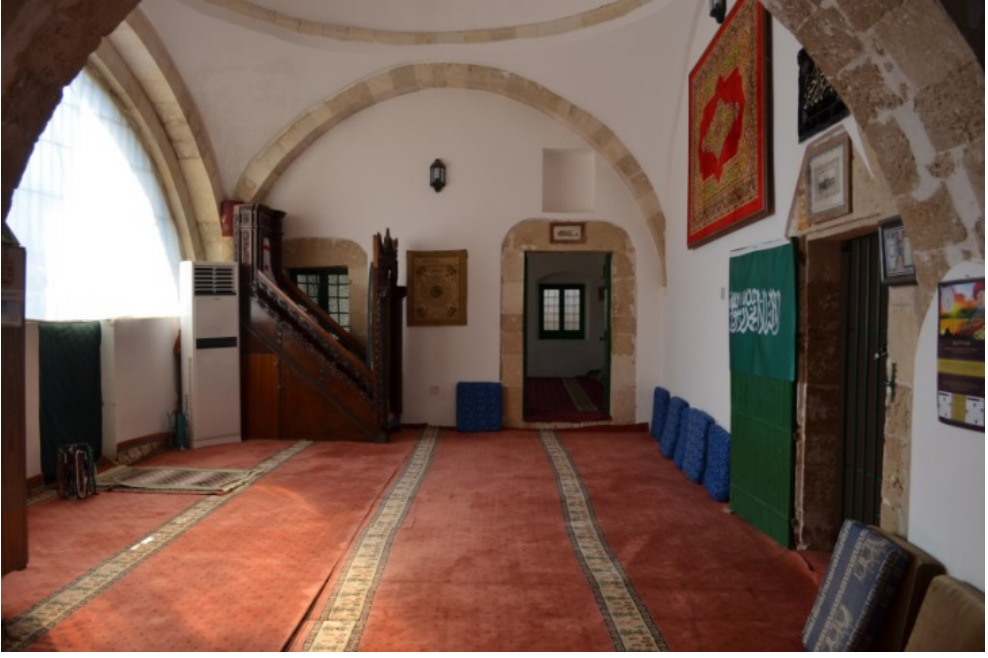
Kutup Osman Türbesi (mescid, ön mekân)