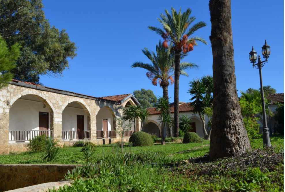
Kutup Osman Tekkesi (avlu kısmı/kütüphane)