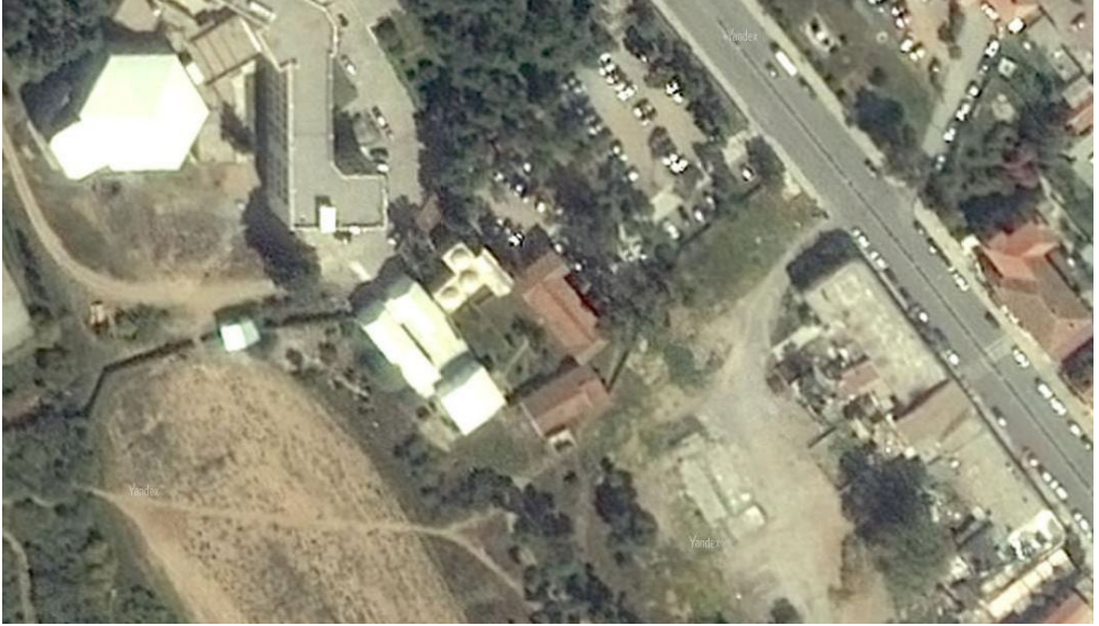
Kutup Osman Tekkesi üstten görünümü, 2018 (Kubbeli ve çatılı kısımlar)