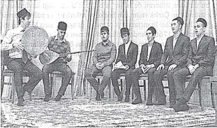
Mercânî Camisinde gerçekleştirilen Mevlut töreninden bir görüntü. 2013

Günümüz itibarıyla Mercânî Camii Tatar toplumunun dini ve sosyal hayatında önemli bir yere sahiptir. Camide beş vakit namaz kılınırken aynı zamanda Mevlut ve sünnet gibi dini törenler de gerçekleştirilmektedir. Ayrıca Mercânî Camisine bağlı Kazan İslam Koleji yıllardan beri Tatar gençlerine din eğitimi vermektedir. 13