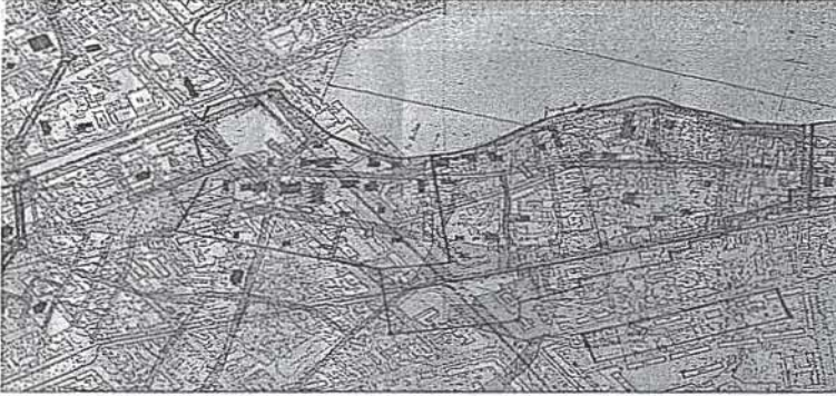
Eski Tatar Yerleşim Alanının Planı 1782