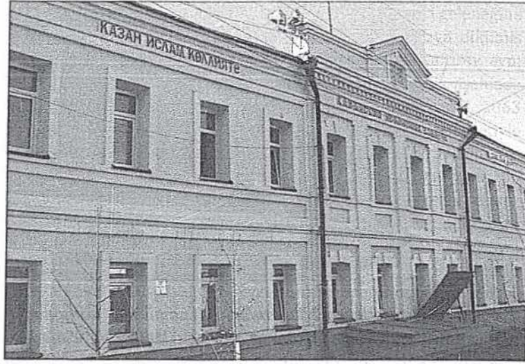
Mercânî Camisine bağlı Kazan İslam Koleji. Foto Dualı: 2009