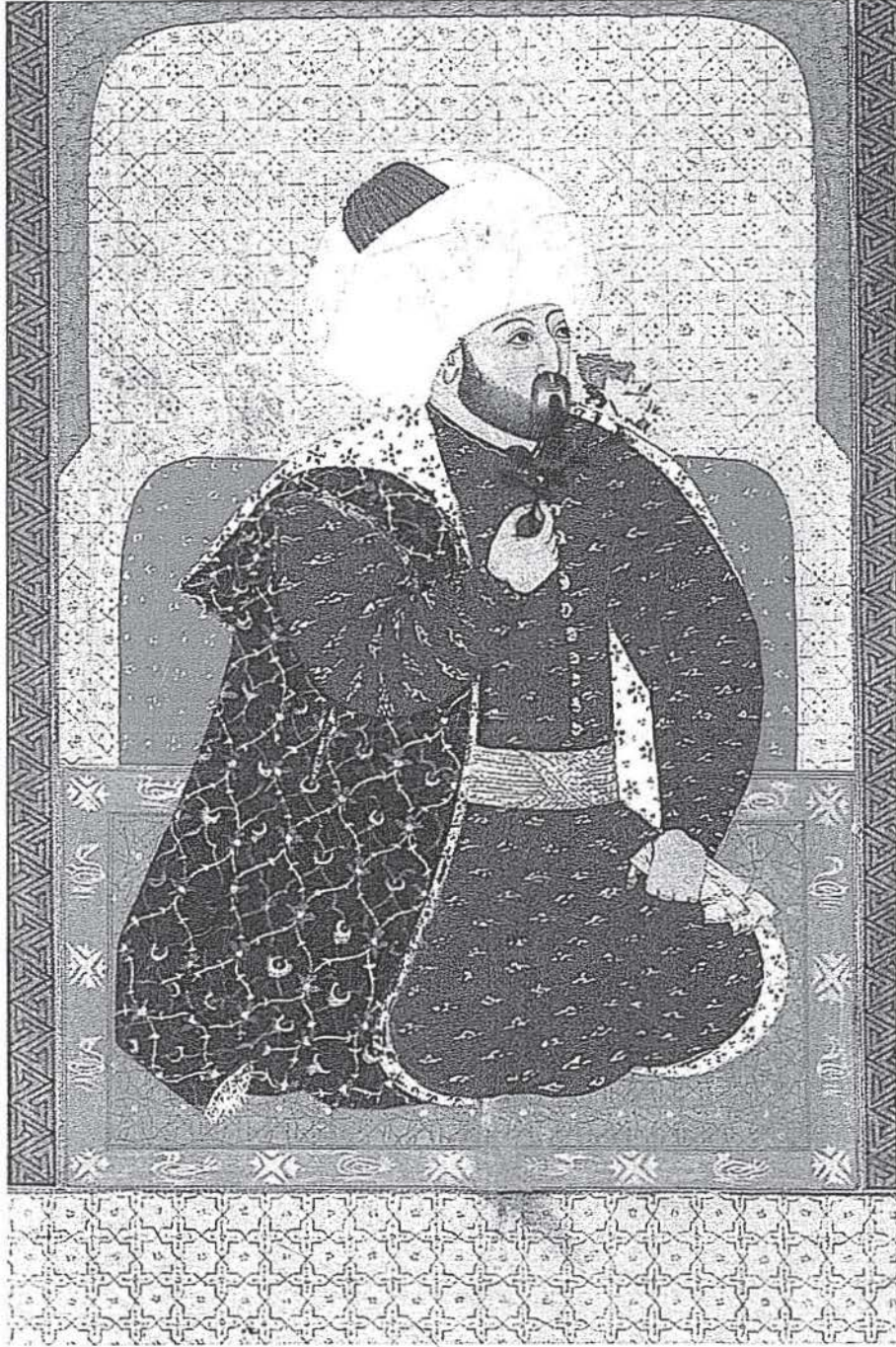
16. yüzyıl sonlarında yapılmış Fatih Sultan Mehmed minyatürü (Seyyid Lokman, Zübdetü't-tevârih , Türk ve İslâm Eserleri Müzesi, nr. 1973, 48a)