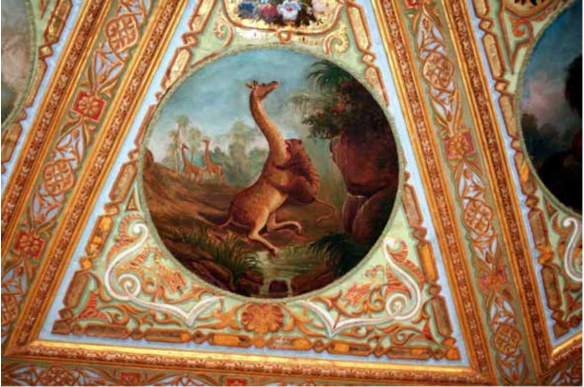
Resim 10: Hayvan tasvirlerinin bulunduğu tavan resimlerinden bir örnek.

Kuzey kenarındaki dilimin içinde ise eğer ile birlikte sancaklar, tuğlar, kalkan, mızrak ve süvari başlığı tasvir edilmiştir. Bu tasvirin de çevresi çiçeklerden yapılmış çelenklerle çevrilidir. Diğer altı dilimin içindeki tasvirler ise girişte soldan sağa doğru şu şekilde sıralanır; kapının üstündeki bölümde, ay ışığında fillerden önde ikisinin mücadelesi görülür, ikincide ise palmiye ağaçlarının bulunduğu bir alanda öndeki filin aslanın üzerine yürüyüşü tasvir edilmiştir. Hayvan tasvirli üçüncü bölümde deve kuşlarının aslanla mücadelesi konusu işlenmiştir. Dördüncü bölümde kayalıklı bir alanda zürafa ve kaplan mücadelesi görülür. Beşinci bölümde şahlanmış doru bir atın önünde bir tay vardır. Altıncı bölümde yine atlar bir kaplan karşısında güçlü duruşlarıyla tasvir edilmişlerdir. Hayvanların kaslı ve hareketli görüntüleri güçlü bir sanatçının eserleri olduğunu gösterir. Tüm hayvan sahnelerinin üst kısımlarında dikdörtgen bir kartuş içinde çiçek tasvirleri vardır. Hayvan ve çiçek tasvirlerinin çevresinde zemin altta midyeden başlayan bark tarzı kıvrımlarla bezenmiştir. Bu bezemelerin aralarında dönem özelliği yansıtan rumilere de yer verilmiştir. Çiçeklerin bulunduğu kartuşu sınırlayan hatlar üst kısma doğru geçme yaparak ok şeklinde sonlanır. Uygurlar dönemine ait Bezeklik'deki duvar resimlerinde okçu sahneleri görülür. 22 Oklu bezemeler Türk sanatında Karahanlılar ve Selçuklular döneminden beri yaygın olarak kullanılmaktadır.