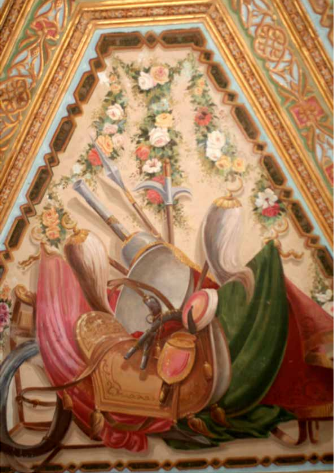
Resim 9: Osmanlı sancakları, tuğraları, mızrakları, kargıları ve eyer takımlarının bulunduğu tavan resimleri