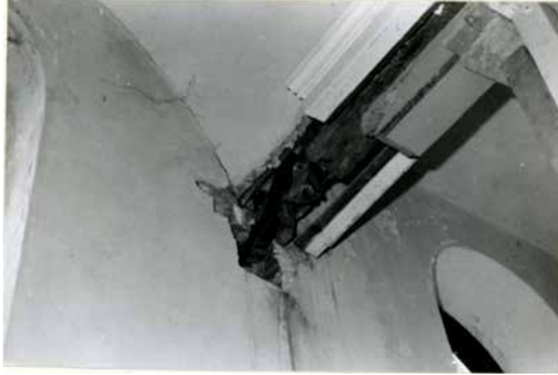
Resim 18: Köşk içi kirişlerin çürük durumu (1989)

Beylerbeyi Sarayı Ahır Köşkü, 5 Temmuz 1985'de ziyarete açılmıştır. 1989 yılına ait rapor ve fotoğraflarda köşkün ahşap taşıyıcı kirişlerinde çökme olduğu ifade edilmektedir. Fotoğraflarda kirişin etrafındaki kaplamalar söküldükten sonra ortaya çıkan çürüklükler açıkça görülmektedir. Çatı içindeki ahşap konstrüksiyonun bir bölümü de yine bu tarihlere onarılmış, değiştirilen kısımlar plan üzerinde gösterilmiştir. Çatıdaki oluklu saç kaplamaların onarımı da yine bu tarihte yapılmıştır. Ayrıca köşk arkasındaki istinat duvarının da onarımı yine bu yıllarda yapılmıştır. 32,33