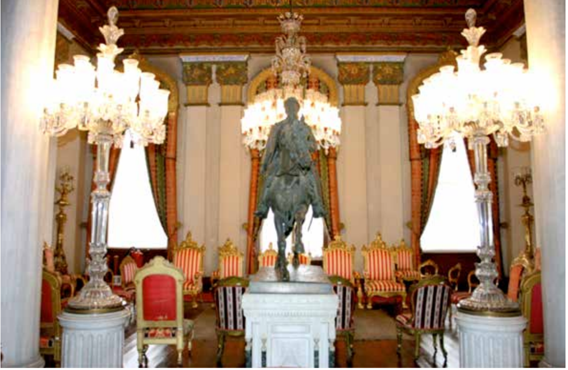
Resim 1: Beylerbeyi Sarayı Havuzlu Salonda bulunan Sultan Abdülaziz Han'ın at üstündeki heykeli

Beylerbeyi Sarayı'nda Sultan Abdülaziz Han tarafından bazı yenilemelerin yaptırıldığı ve atlara düşkünlüğüyle bilinen Sultan'ın atların bakımı için "Ahır Köşkü" adıyla tanınan son derece zarif bir yapı inşa ettirdiği görülmektedir. Boğaz Köprüsü'nün gölgesi altında kalan köşk, saray bahçesinin son seddi üstünde, ilginç mimarisıyla dikkat çekici özellikler taşımaktadır. Ahır Köşkü, girişte muhtemelen İmrahora ait bir oda ile atlara mahsus sağlı sollu, ahşaptan yapılmış yirmi bölümden oluşmaktadır. Kâgir bir yapı olan köşkte ahşabın gerek yapısal eleman gerekse süsleme ögesi olarak yoğun ve başarılı bir şekilde kullanıldığı göze çarpmaktadır. Günümüze kadar birçok defa onarım geçirdiği bilinen köşkün özellikle ahşap yapı elemanları çevresel koşullar ve biyolojik etkenlere bağlı olarak zarar görmüştür. Son olarak 2010 yılında başlatılan onarım-koruma çalışmaları halen devam etmektedir.