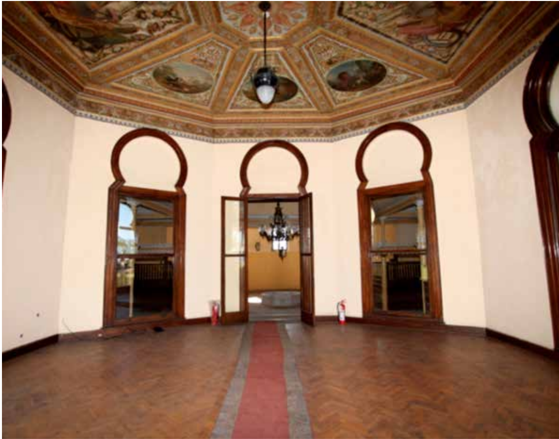
Resim 7: İmrahor odası