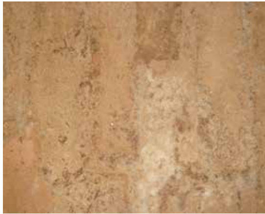
Resim 20: Ahır Köşkü'nün zemininde görülen çiçeklenme problemi

Osmanlı dönemi arşiv belgeleri ile Milli Saraylar arşivindeki Cumhuriyet dönemi sonrası onarım belgeleri üzerinde yapılan çalışmalarda Ahır Köşkü'nün birçok kez onarım geçirdiği belirlenmiştir. Yapılan incelemeler sırasında köşkün esas probleminin çatı ile yağmur olukları ve inişlerinden kaynaklanan koruma sorunları olduğu tespit edilmiştir. Ayrıca yapı zemininden yukarıya doğru su yükselmektedir. Buna bağlı olarak köşkün içerisinde duvarlarda rutubet izleri, boyalı yüzeylerde kabarma ile tuğla zemin döşemesi üzerinde çiçeklenme problemi gözlemlenmiştir.