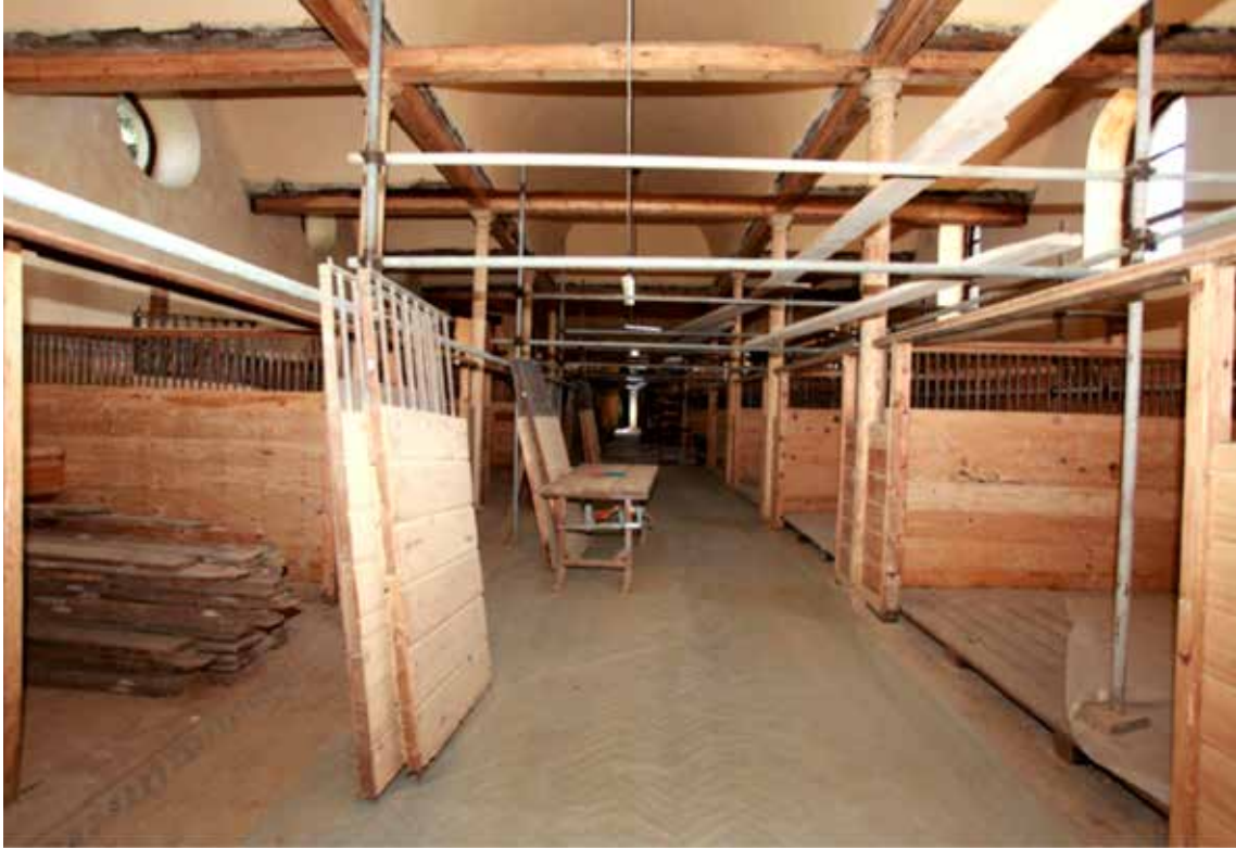
Resim 21: Köşkün onarımdaki hali.

2010 yılında başlayan onarım ve koruma çalışmaları, ahşap yüzeyler üzerindeki boya tabakasının sökülmesi işlemi ile başlamıştır. Onarım esnasında yapılan açmalarda taşıyıcı sistemdeki hasarın dışarıdan görülenden çok daha fazla olduğu görülmüştür. Çatı, yağmur inişleri ve zeminden yükselen rutubete bağlı olarak çürüklük mantarları ve ahşap zararlısı böceklerin oluşturduğu biyolojik kökenli bozulmalar nedeniyle köşk içerisinde birçok ahşap elemanın taşıyıcı özelliğini yitirdiği, duvarlarda deformasyon oluştuğu belirlenmiştir.