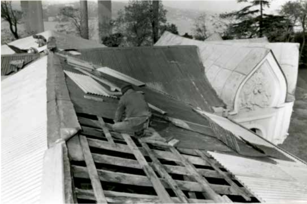
Resim 19: Köşkün inşaatından bir görüntü.

1991 yılında, Ahır Köşkü'nün İmrahor Odası'nın çatısından su almaya bağlı olarak bozulan kısımları ile tavan resimlerinin zarar gören yerleri onarılmıştır. 34 1999–2000 yıllarında