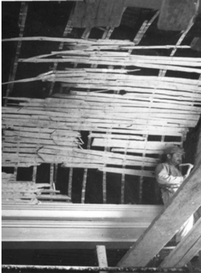
Resim 15: 1969-1971 yıllarına ait fotoğraflarda Ahır Köşkü