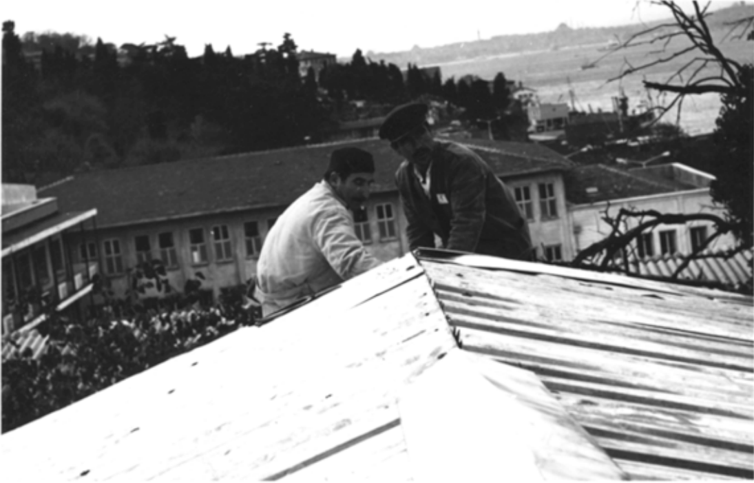
Resim 16: 1975 yılına ait fotoğraflarda Ahır Köşkü