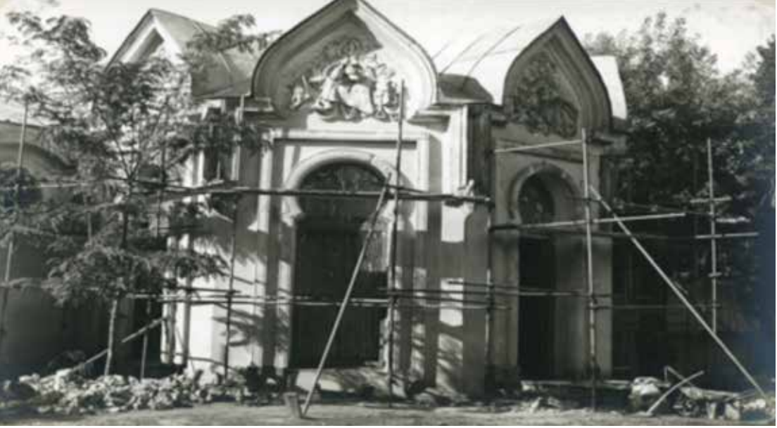
Resim 14: 1969-1971 yıllarına ait fotoğraflarda Ahır Köşkü