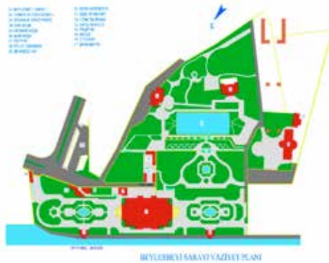
Resim 2: Beylerbeyi Sarayı Vaziyet Planı

Beylerbeyi Sarayı'nda Sultan Abdülaziz Han tarafından bazı yenilemelerin yaptırıldığı ve atlara düşkünlüğüyle bilinen Sultan'ın atların bakımı için "Ahır Köşkü" adıyla tanınan son derece zarif bir yapı inşa ettirdiği görülmektedir. Boğaz Köprüsü'nün gölgesi altında kalan köşk, saray bahçesinin son seddi üstünde, ilginç mimarisıyla dikkat çekici özellikler taşımaktadır. Ahır Köşkü, girişte muhtemelen İmrahora ait bir oda ile atlara mahsus sağlı sollu, ahşaptan yapılmış yirmi bölümden oluşmaktadır. Kâgir bir yapı olan köşkte ahşabın gerek yapısal eleman gerekse süsleme ögesi olarak yoğun ve başarılı bir şekilde kullanıldığı göze çarpmaktadır. Günümüze kadar birçok defa onarım geçirdiği bilinen köşkün özellikle ahşap yapı elemanları çevresel koşullar ve biyolojik etkenlere bağlı olarak zarar görmüştür. Son olarak 2010 yılında başlatılan onarım-koruma çalışmaları halen devam etmektedir.