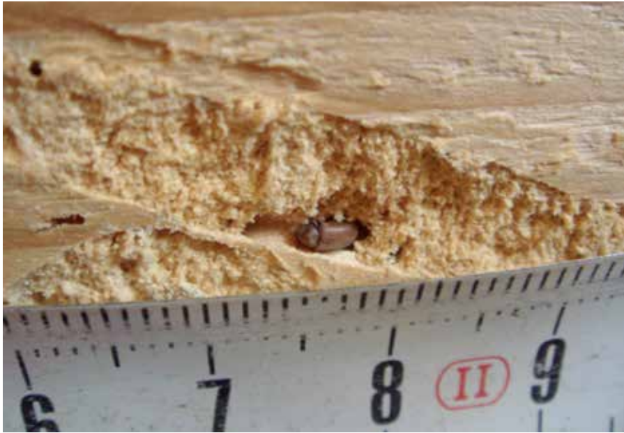
Resim 22: Köşk içindeki ahşap bölmelerde görülen ergin Anobium punctatum

Ahşap zararlısı böceklerle mücadelede zararının türüne, boyutuna bağlı olarak en uygun mücadele yöntemi belirlenir. Beylerbeyi Sarayı Ahır Köşkü’nün çatı konstrüksiyonunda, taşıyıcı elemanlarda, kapılarda ve pencere doğramalarında kullanılan ahşaptaki enfeksiyonun yoğun olması nedeniyle yapının bütününe içine alan bir mücadele yöntemi gerekmiştir. Bu amaçla köşkte gerekli yalıtımlar yapılarak, tamamen dışarıdan idare edilen bir sistemle sülfürlü florit gazıyla fümigasyon (dumanlama) yapılmıştır. Fümigasyon, böceklerin herhangi bir biyolojik dönemine (yumurta, larva, pupa, ergin) karşı gaz halinde etkili olan belli miktardaki kimyasal bir maddenin (fümigant), belli bir sıcaklık ve sürede kapalı bir ortamda tutulmasıyla yapılan işlemlerdir. 3 gün süren uygulamanın ardından gaz tahliye edilerek fümigasyon tamamlanmıştır.