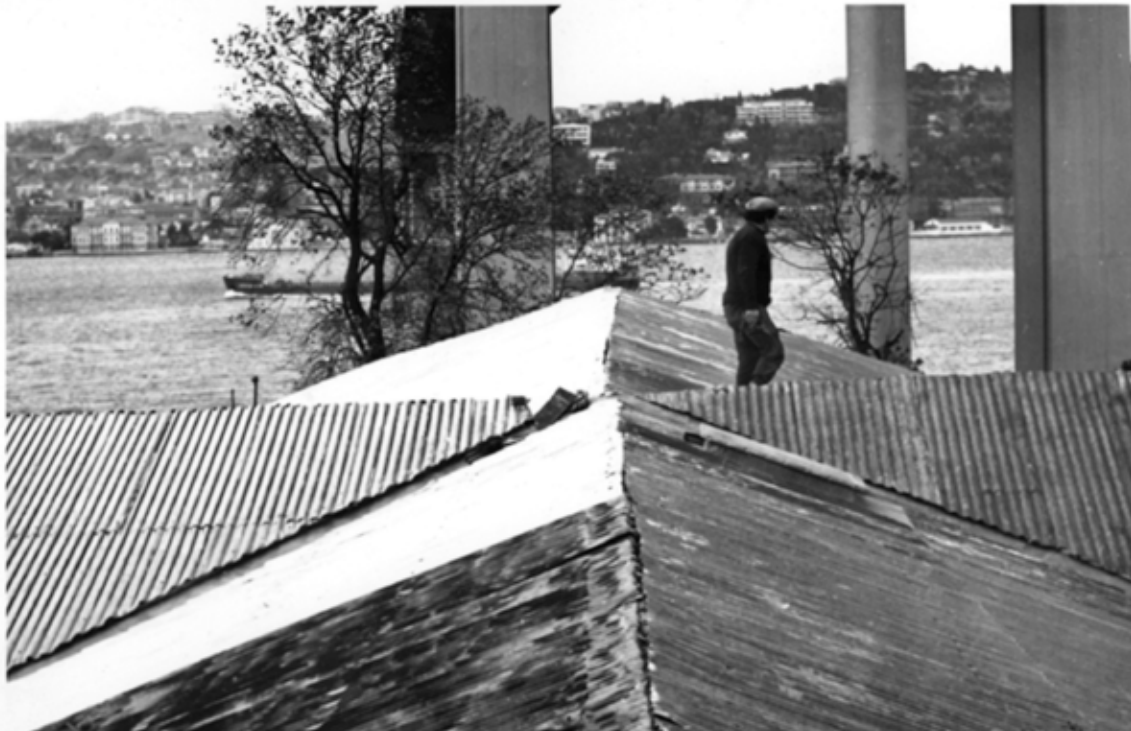
Resim 17: 1975 yılına ait fotoğraflarda Ahır Köşkü