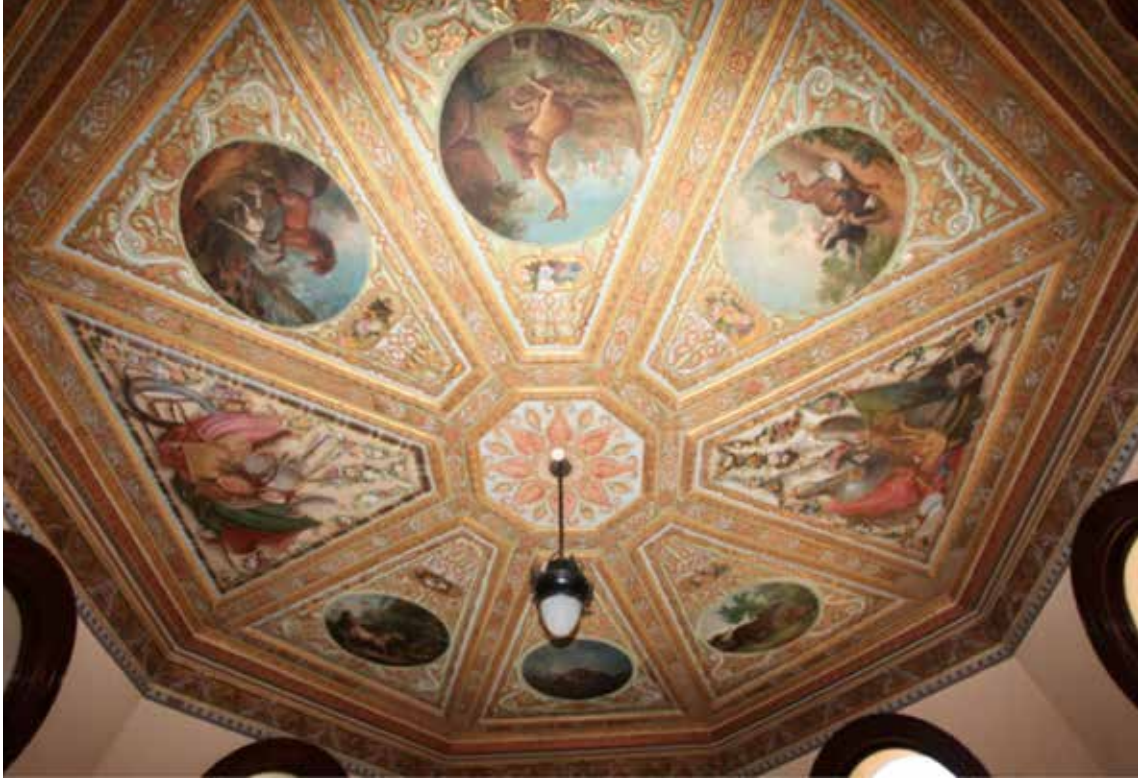
Resim 8: İmrahor odasının tavanı

Teknik özellikleri: Tavandaki kalem işleri ve resimler ahşap 18 üzerine keten bezi gerilerek tuval şekline 19 getirildikten sonra yağlıboya 20 ile yapılmıştır. Örgü (motif) ve resimler: Doğu cephesinden girişin sağlandığı sekizgen bölüm dış ve iç bezemeleriyle yapıya “Ahır Köşkü” unvanını kazandıran bölümdür. Bu bölümün tavan bezemeleri sekizgen temel üzerine düzenlenmiştir. Tavanın sekizgen tabanında, ortadaki daire içinde palmet dizisini aralarında küçük dairelerin bulunduğu kenarsuyu sınırlar. Bu bölümü, laleyi andıran şekillerle aralarında rumilerin oluşturduğu palmetlerin ardışık olarak sıralandığı desen izler. Tavanın tabanını çift tarafı meyilli ortadaki altı köşeli yıldızlarla bezeli üç sıra ahşap çita çevreler. Bu çitaların üzerleri altınla (varak) kaplıdır.