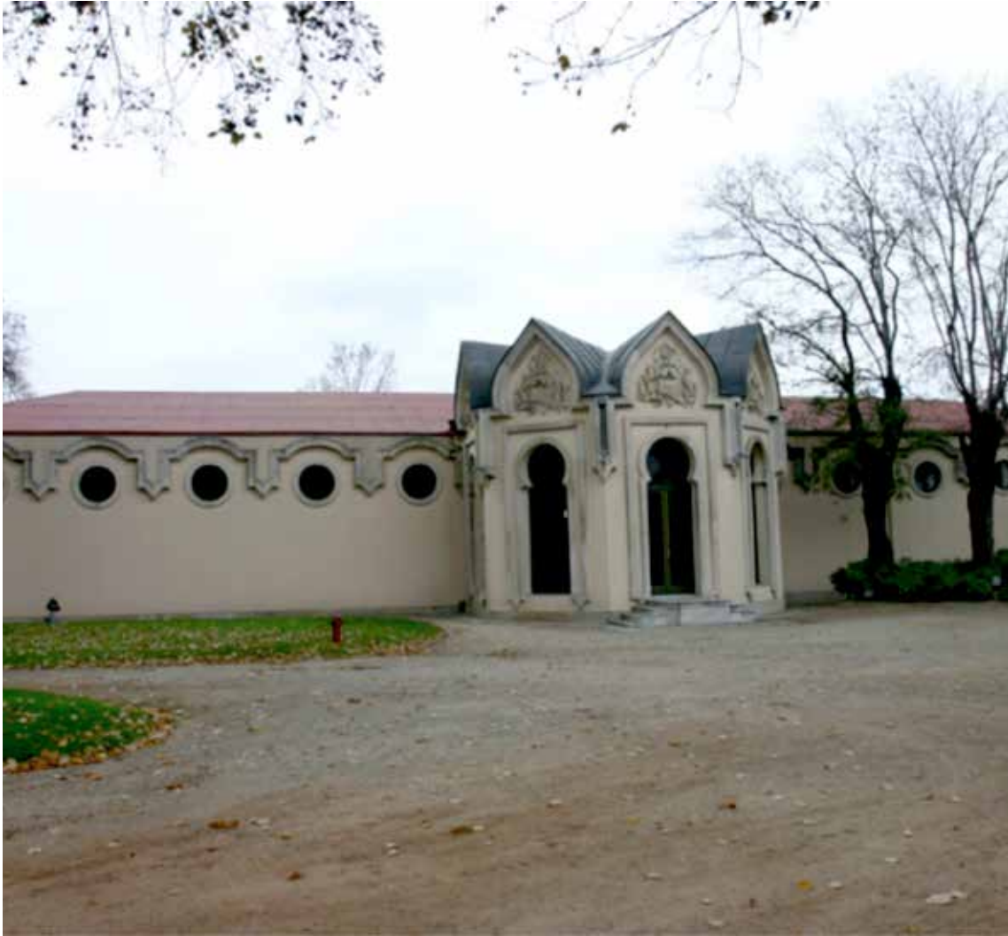
Resim 3: Beylerbeyi Sarayı Ahır Köşkü

Yaptıran: Beylerbeyi Sarayı ve bağlı bulunan binaların Sultan Abdülaziz Han (Hd.25 Haziran 1861- 30 Mayıs 1876) zamanında yapıldığı bilinmektedir. 7 Mimarı: Sarayın "Deniz Köşkleri'nin mimarı Sarkis Balyan 8 tarafından yapıldığı düşünülür.Yapım yılı: Yapım yılı bilinmemektedir. Ancak Deniz Köşkleriyle benzerlik göstermesi aynı dönemde yapıldığı izlenimini verir. Beylerbeyi Sarayı'nın Sultan Abdülaziz Han tarafından açılış tarihi 25 Zilkade 1281 / 21 Nisan 1865 olarak belirtilir. 9