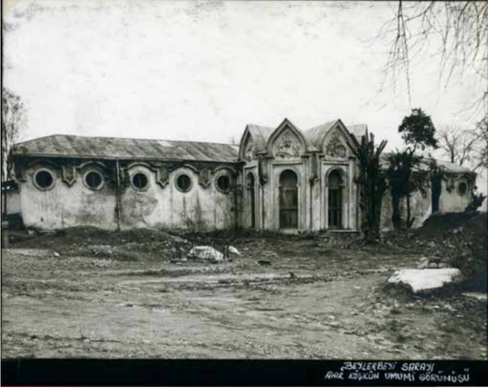
Resim 12: 1969-1971 yıllarına ait fotoğraflarda Ahır Köşkü