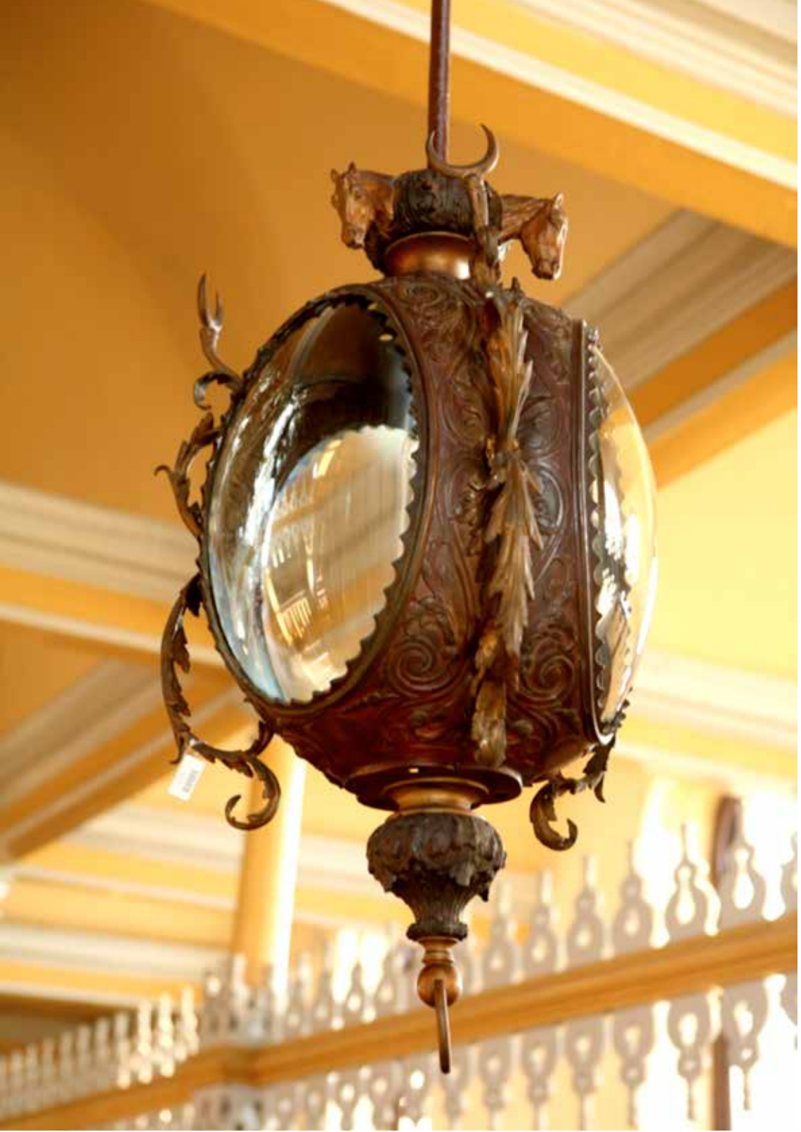
Resim 6: At başlarının bulunduğu sarkıt (avize/lamba)