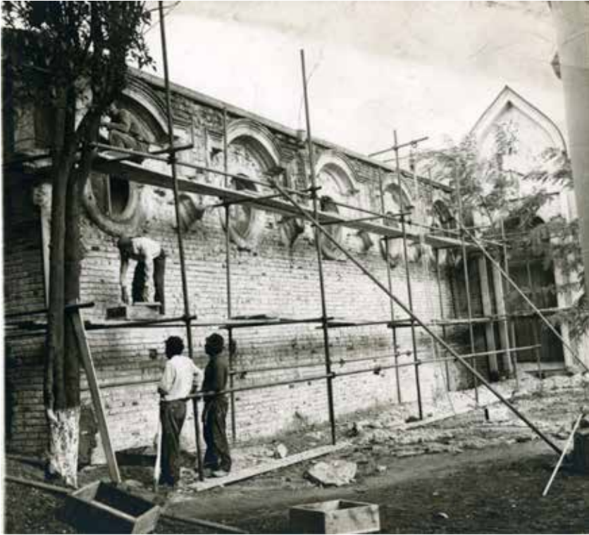
Resim 13: 1969-1971 yıllarına ait fotoğraflarda Ahır Köşkü