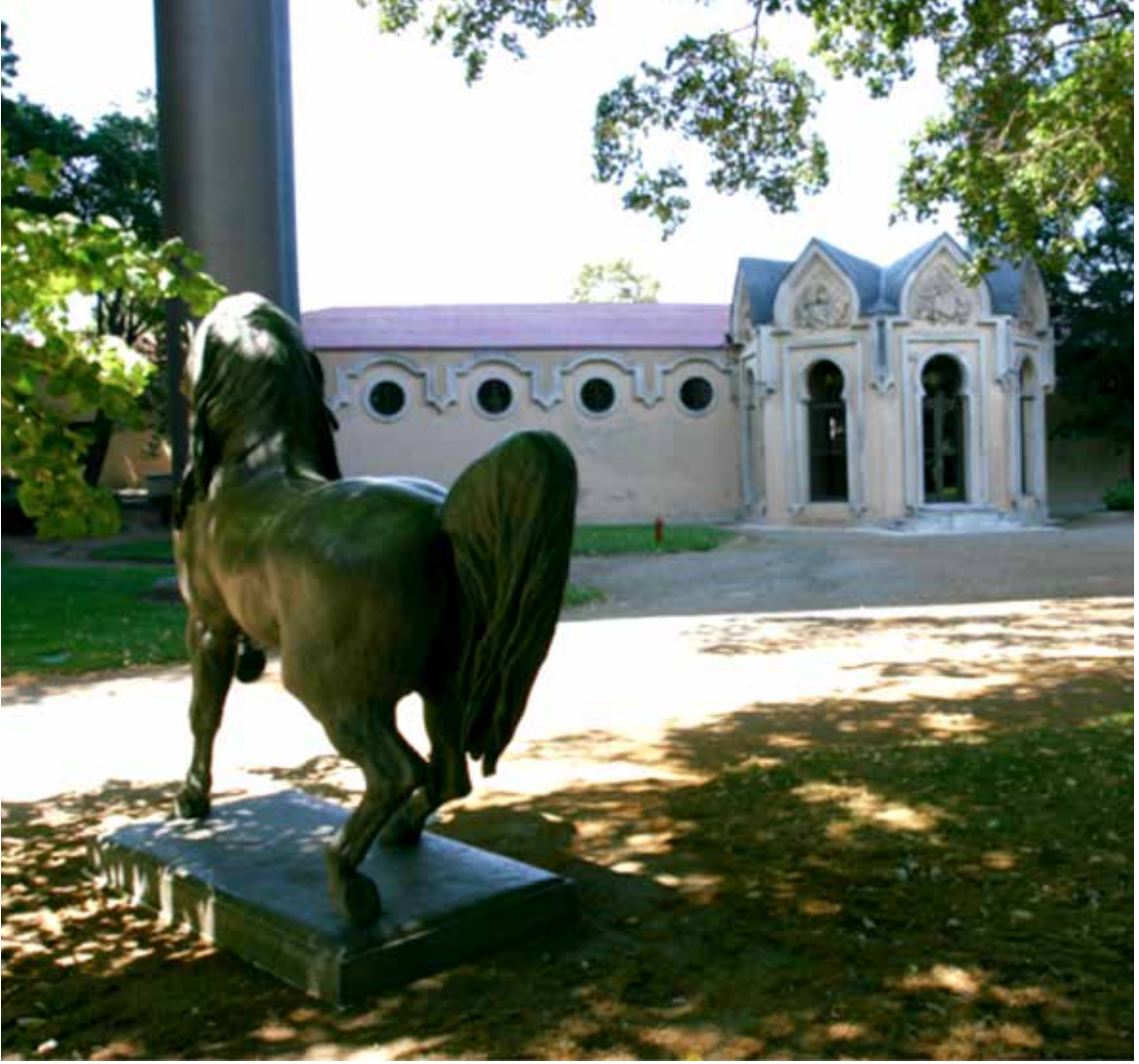
Resim 4: Ahır Köşkü önündeki bronz at heykeli