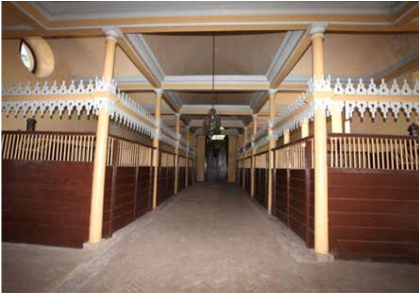
Resim 11: Palmet dizisi (süslemeler)

1865 tarihli Beylerbeyi Sarayı'na ait inşaat ve imalat işlerinin yer aldığı Hazine-i Hassa defterinde Doğramacıbaşı Vortik Kemhacıyan'ın İstabl-ı Amire kasrında yaptığı doğrama işleri belirtilmektedir. 25 Defterde köşkün 6 adet penceresi ve 2 adet muhafaza kapılarının Rusya meşesinden imal edileceği üst kısımlarının yuvarlak olacağı, kapıların ise cam olacağı belirtilmektedir. Belgede anlatılan bilgiler köşkün İmrahor Odası'nın kapı ve pencere doğramaları ile uyuşmaktadır.