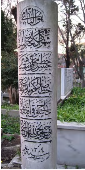
Resim 2. M. Said Bey Tarafından Yazılan Şevki Efendi'nin Merkez Efendi Mezarlığı'ndaki Mezar Taşı.

Hattat Mehmed Şevki Efendi, sülüs, nesih, rika' ve rik'a yazılarını fevkalâde yazmış olmakla beraber, asıl nesih yazıda mektep sahibi bir üstattır. Sanat hayatı boyunca yirmi beş mushaf yazmıştır. Şevki Efendi'yi mektep sahibi bir üstad seviyesine ulaştıran Osmanlı'da " Hâdim-i Kur'ân " diye vasıflandırılan nesih hattıdır ki, bunun da en büyük icra sahası Kur'ân-ı Kerimlerdir. 14 Kur'ân-ı Kerim'i tarafımızdan tespit edilmiştir.