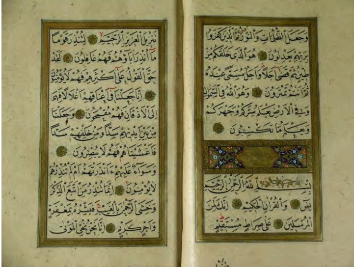
Resim 3. Şevki Efendi'nin Süleymaniye Kütüphanesi'ndeki Mevlevî Evrâdı'ndan Örnek.