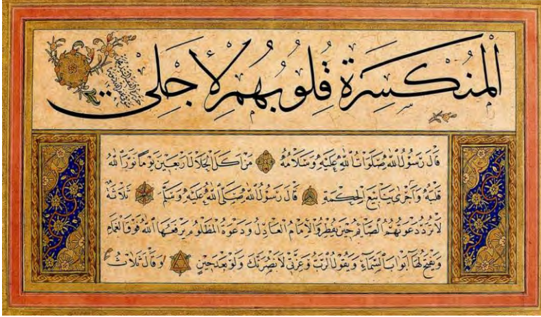
Resim 6. Şevki Efendi'nin 1294/1878 Tarihli Sülüs-Nesih Kıt'ası (TSMK, GY-192-5a).

nârinliği ve suhuleti ile dikkat çekmektedir. Kıt'alarının ekserisinde tarih atmayan Şevki Efendi'nin eserlerinin değerlendirilmesinde boru kâf, sin dişleri, lafza-i Celâl, alâ kelimelerinin yazılışı gibi harflerin tekâmülünden hareketle yaklaşık olarak yazılış yılları tespit edilmeye çalışılmaktadır.