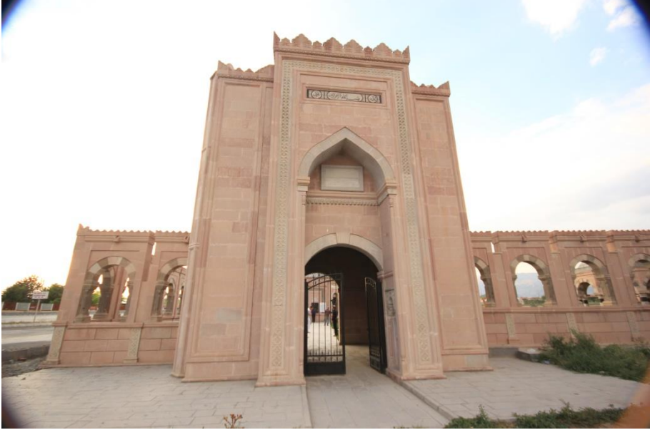
1.Şeyh Muhammed Sâmi (k.s.) türbesi giriş kapısı, Erzincan,2012.