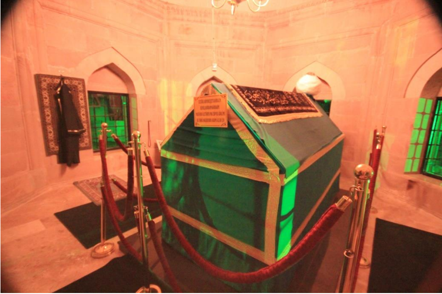
3.Şeyh Muhammed Sâmi (k.s.) kabr-i şerifi,2012.