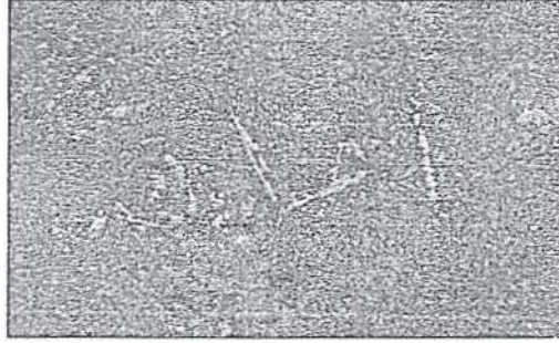
Resim 2. Şeyh Zekeriyya Efendi'nin Türbe-i Şerif'in sol tarafındaki bir pencerenin alüminyumla kaplı zeminine kendi el yazısıyla yazdığı "Ahlâk" yazısı halen okunaklı bir şekilde durmaktadır.

Tasavvufa gönül verenlerin ahlâkî değerlerin ön planda olması gerektiğine dikkatleri çekmiştir. Hatta Pîr Hayatı Türbesi'nin baş penceresi önüne yazdığı "Ahlâk" kelimesi, ziyaretçilerin dikkatini çekmektedir. İrşad vazifesine büyük bir ciddiyetle yaklaşan Şeyh Mehmed Zekeriyya Efendi, Halvetî tarikatına bağlanmış dervişlerin, muhiblerin, müridlerin, gönül verenlerin daima nefislerin kontrol altında tutulması gerektiğini vurgulamıştır. Zikrullah'ın önemini her zaman hatırlatmıştır. Halvetî tarikatında insan yetiştirmekte uygulanan usul ve erkanı daima ön planda tutmuştur. "EDEB YA HU" düsturuna her zaman özen göstermiştir.