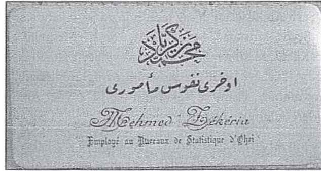
Resim 2. Şeyh Zekeriyya Efendi'nin Kartviziti (Kendileri Ohri'de nüfus memurluğu görevini ifa etmiştir.)

Pir Mehmed Hayati Âsitânesi'nde, Şeyh Mehmed Zekeriyya Efendi'nin ayrı bir yeri vardır. O hem hattat hem de şairdir. Şeyh Mehmed Zekeriyya Efendi, Osmanlı'nın çöküşünden sonra, daha doğrusu I. Dünya Savaşı esnasında posta oturmuş ve Âsitâneyi Sırp Krallığı döneminde idare etmiştir. Pir Mehmed