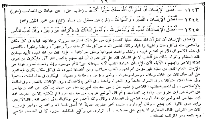
Şekil 1 Münâvî'nin Feyzu'l-Kadîr adlı eserinin görüntüsü

Aynı durum en faziletli cihaddan bahseden müteakib iki rivayette de gözlemlenmektedir 32 .