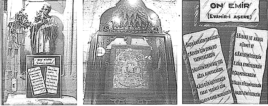
Mar Petyun Kilisesi Kilise içinden Mihrap kısmından görüntüler

Diyarbakır Özdemir Mahallesinde Yeni Kapı Caddesinde bulunan Mor Pedyun Kilisesinin ne zaman yapıldığı kesinlik kazanmamakla beraber tarihi 17. Yüzyıla kadar iner. Katolik Keldaniler tarafından günümüzde de kullanılan fakat şu anda onarımda olan bir kilisemizdir. Bununla birlikte ibadete