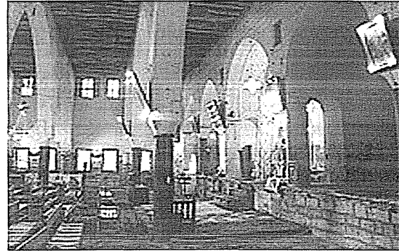
Kilisenin iç alanı cemaat mahfili

Üst örtü kilise iç alanını duvarlara ve kolonlara asılmış 1.00m'lik floresan lambalar aydınlatıyor. Üç kemerli üç dizi ahşap tavan kirişlerinin oturmasını sağlamaktadır. Ahşap yastıklara oturdukları görülüyor. Doğu ve batı duvarında bunlar da yoktur. Üst toprak damın yanlara ve doğu yöne akıntılı olduğu bu yöndeki çörlenlerden belli oluyor. Apsis kanadı beş gözden oluşur. Bunların dışa destekleri olmayıp duvarları kalın tutulmuş ve