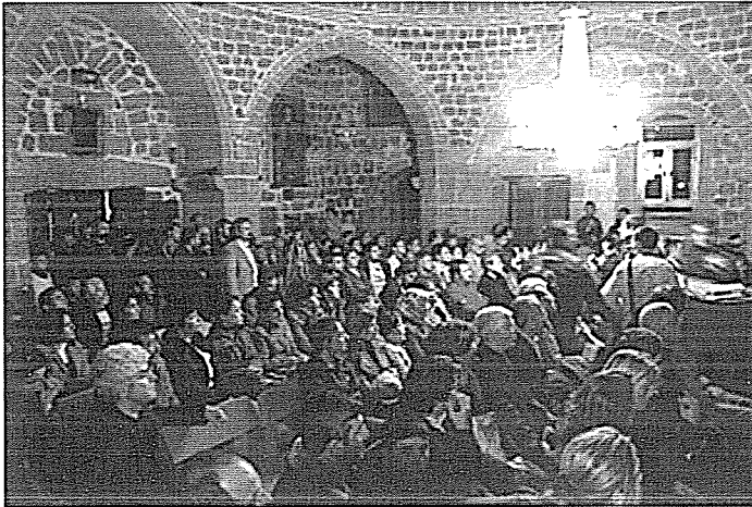
Meryem Ana Kilisesinde Ayin Zamanı

Onlar Hz. İsa'da ilahi ve insani tabiatın birleşerek tek tabiat olduğunu savunan monofizit bağımsız ve özerk kiliselerdir. Süryaniler Mezopotamya bölgesinde Suriye'de yaşadıkları için bu adı almışlarsa da 38 yılında Hıristiyan olduklarında Antakya'yı merkez edinmiş bir topluluk haline geldiler. Aramca dialektlerinde Süryanicenin ağırlığı vardır.