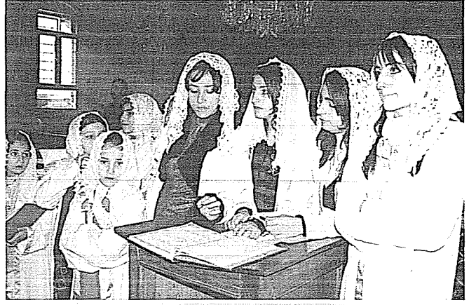
Meryem Ana Kilisesinde Kızlar Korosu

Kilisenin yapı topluluğuna baktığımızda Kilise, Mor Yakup kutsal alanı, dört avlu, derslik ve bir lojmandan oluşur. Giriş Ana Sokak kuzey yakasındaki 34 numaralı kapıdan olup tonozlu ufak giriş eyvanından, ufak bir avluya, oradan da kuzeyindeki ana avluya geçilmektedir. Birinci Avlunun batısındaki derslik ile doğusundaki konut ve derslikler Ana Sokak boyunca sıralanırlar. Bunların en doğu ucunda şimdi kapalı olan Patrik Kapısı vardır. Bu kesimi kiliseden ikinci avlu ayırmaktadır. Girişi ana avludandır. Ana Avlunun güneyini derslik olarak yapılmış olan ancak şimdi öğrenci olmadığı için bu amaçla kullanılmayan bölüm yer alır.