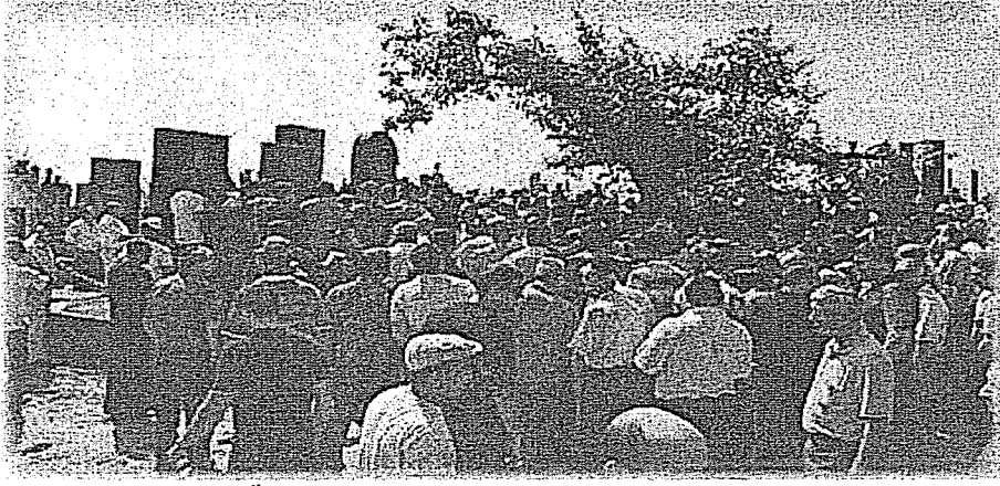
Fotoğraf 5.Ölümün birinci yıl dönümü anma töreninden bir görünüm.