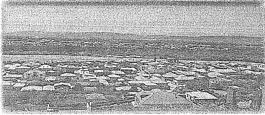
Fotoğraf 2. Kırmızı Kasaba ve Quba şehrinden birlikte bir görünüm.

Buraya Rusça "Krasnaya Sloboda" yani Kırmızı Kasaba (Azerice: Qırmızı Qəsəbə) denilmektedir. Bu kasabada çatılar süslü, yağmur boruları kuş biçiminde yapılmıştır. Kasabada bir Yahudi Kültür Merkezi vardır. Burada 13 sinagog bulunduğu, ancak Sovyet döneminde çoğunun kapatılıp depo ve fabrika yapıldığı, İbranice konuşmanın yasaklandığı ifade edilmektedir. Günümüzde sinagogların iki tanesi kullanılmaktadır. Sırf Yahudi düğünleri için kullanılan özel düğün salonları da bulunmaktadır. Kırmızı kasaba, çok verimli bir bölgede yer almakta, her taraf yemyeşil, etrafında ise karlı dağlar bulunmaktadır.