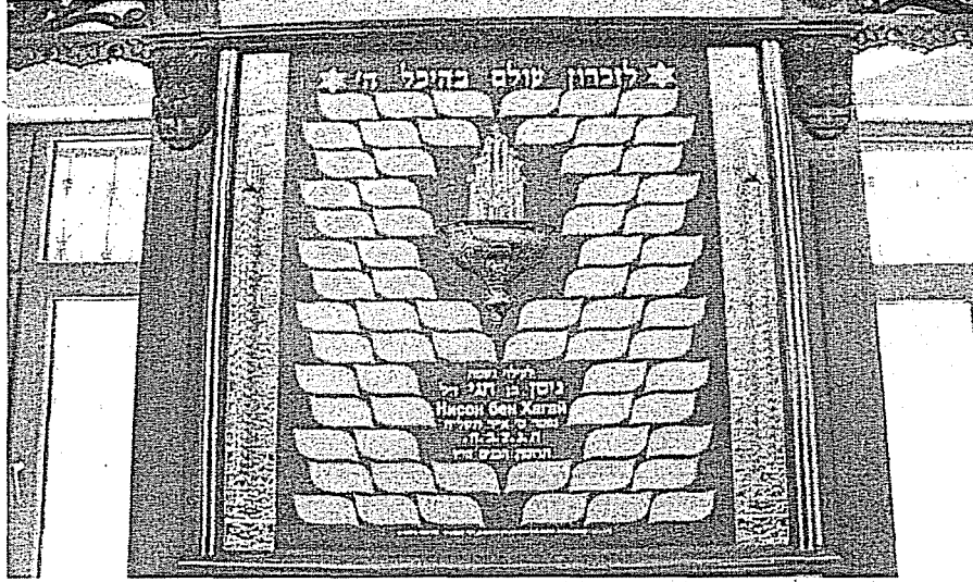
Fotoğraf 7. Dağ Yahudilerinin ibadet ettikleri Sinagogun duvarında asılı olan bu levha, Nison bin Hagay adlı hayırsever bir şahıs hayrına akrabaları tarafından yapılmıştır. Yıl içinde ölen insanların isimleri küçük ve özel bazı kâğıtlarayazılarak bu levha üzerine yapıştırılır. Ortasında ise ölen kişinin ruhuna mum yakılır. Ölenlerin akrabaları günde üç keresinagoga gelip ibadet eder ve ölen akrabaları için dulalar okurlar. Yıl bitince bu isimler kaldırılır ve yeni yılda ölen insanların isimleri yapıştırılır.