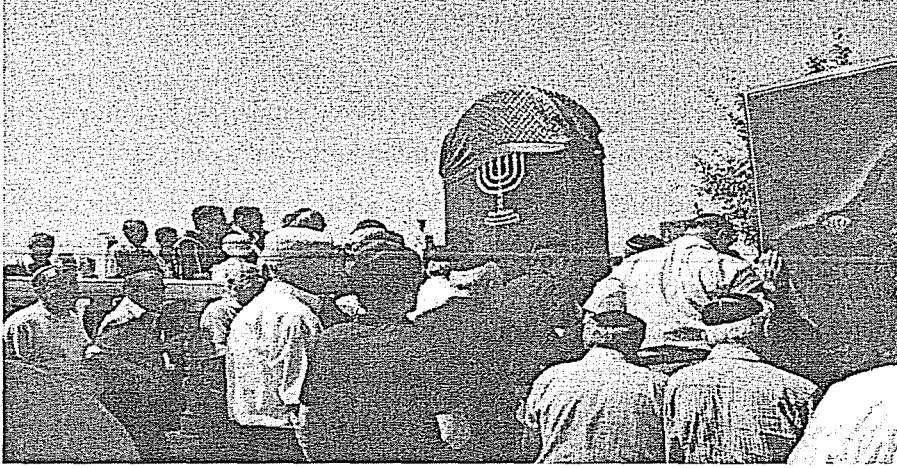
Fotoğraf 4. Ölüm yıldönümünde Dağ Yahudileri, mezarlığa gelerek, ağlar, dua eder, ellerini mezar taşlarına sürerler.

Ölümün birinciyılı anma töreninde, önce ölen kişinin evinde Tevrat okunur, sonra otobüslerle mezarlığa gidilir. Haham orada da Tevrat'tan bölümler okur, ağlaşır sırayla mezarın önünden geçerler ve ellerini yüzlerini mezar taşına sürer mezar taşını öperler, bazıları ise mezara küçük taşlar bırakırlar. Böylece defin merasimine kimlerin geldiğini ölenin ruhunun anlayacağına inanılır. Sonra yine arabalarla toplu halde eve gelinir. Evde sofralar hazırdır, sofranın üzerinde genelde yumurta, patates ve balık bulunur. Ölünün yıllığı çıkıncaya kadar bir yıl içinde o evde tören, merasim ve eğlence olmaz. Düğün yapılmaz, eğer düğün tarihi önceden tespit edilmişse ve ölen çok yaşlıysa düğün yapılabilir, ölen kişi gençse düğün kesinlikle iptal edilir.