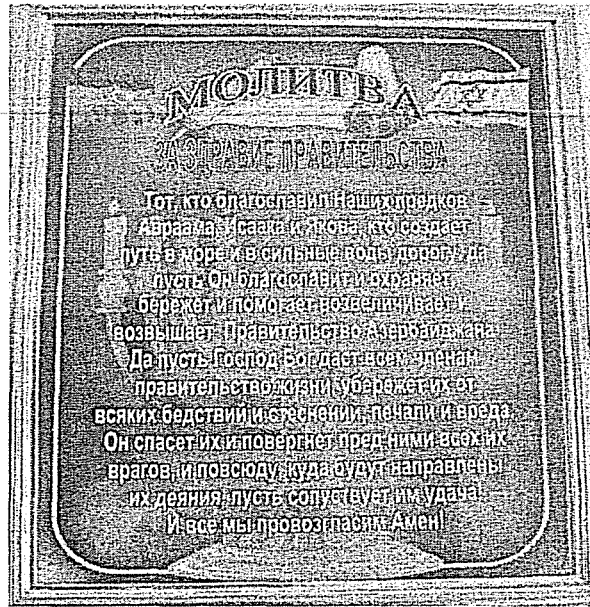
Fotoğraf 8. Dağ Yahudileri, cumartesi günü ibadette ilk olarak Azerbaycan Cumhurbaşkanı'na dua ettiklerini ifade ederler. Nitekim Sinagogun duvarında aşağıdaki duayazılı bir levha asılmaktadır.