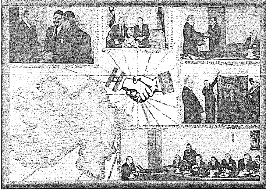
Fotoğraf 12. Dağ Yahudileri ile Azeri yetkililerin sıcak ilişkisini gösteren ve Sinagogun koridorundaki duvarda asılı olan bir fotoğraf.

Dağ Yahudileri, günümüzde Azerilerle olan ilişkilerini dostça, hoşgörülü ve mükemmel olarak nitelerler. Birbirlerinin bayramlarına iştirak ettiklerini, Yahudilerin hiçbir dini ve milli baskıya maruz kalmadıklarını vurgularlar. Azerilerin bu hoşgörülerini onların iç dünyalarından kaynaklandığı gibi, Türklerin hoşgörüsünün evrensel özelliğinin de bir göstergesi olduğu kanaatindeyiz.