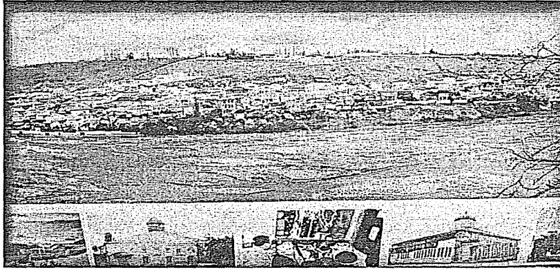
Fotoğraf 1. Yahudilerin topluca yaşadığı Kırmızı Kasaba'dan bir görünüm.

Kaynak kişilerimizin ifadesine göre, Quba hanlarından Fatali Han (Feteli Han), 1742'de oğlunu tedavi edip hayatını kurtaran bir Yahudi doktorun hatırına, dağınık yaşayan Dağ Yahudilerinin Quba'da nehrin karşı tarafında yerleşmelerine izin verdiği, böylece Fatali Han sayesinde Dağ Yahudilerinin kendi kasabalarında topluca yaşamaya başladıkları belirtilmektedir. Guba Hanı Feteli han zamanında bu kasabaya İran'dan, Türkiye'den, Dağıstan'dan Yahudiler akın etmeğe başladılar. Böylece kasabadaki Yahudi nüfusunun sayısı çoğalmaktaydı. 1856 yılında kasabanın nüfusu 300 kişi, 1873'te 5120, 1886'da 6280, 1916 yılında ise 8400 kişiye ulaşmıştı 12 .