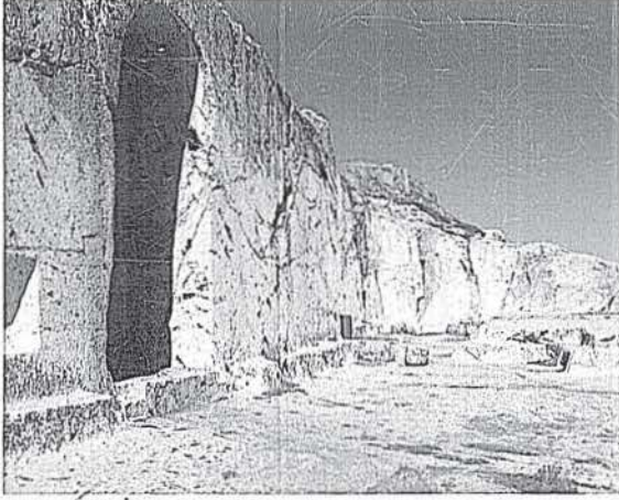
Analıkız kutsal alanı

kalker kayalığın güney yüzündedir. Kaya nişine yine kayalara oyulmuş basamaklarla ulaşılır. Nişin çevresi iki çerçeve ile sınırlandırılmıştır. 2.60 metre genişliğinde, 4 metre yüksekliğindeki niş, diğerleri gibi hala kutsal sayılır 47 satırdan oluşan yazıtın yine tekrarlandığı, böylelikle 94 satırlık bir yazıt oluşturulduğu görülür (Belli 2005: 90).