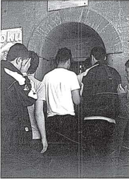
Şeyh Abdurrahman Gazi Türbesi

sini üç kez tekrarladıktan sonra kayarak dilek tutmaktadırlar.