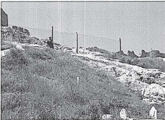
Kurban kanı akıtma yeri

Van Kalesi'nin kuzey eteklerinde II. SARDURI tarafından inşa ettirilmiştir. Söz konusu açık hava tapınağı Vanlılar arasında "Analıkız" olarak bilinmektedir (Çilingiroğlu 2000: 73). Tapınakta yer alan çivi yazılı taş bloklar II. SARDURI'ye ait önemli yazıtlardır. Alanın güney