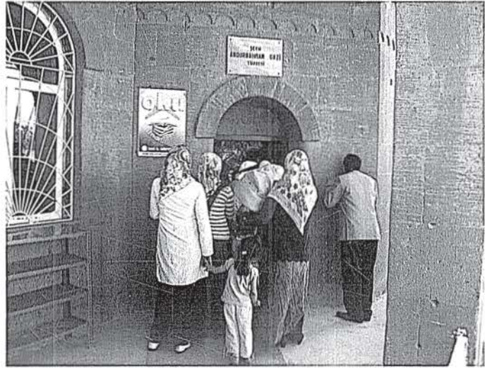
Şeyh Abdurrahman Gazi Türbesi

Analıkızın hemen altında Şeyh Abdurrahman Gazi ve Galip Paşa türbeleri bulunmaktadır. Şeyh Abdurrahman Gazi'nin XV. yüzyılda Bağdad'tan Van'a gelmiş, halk arasında saygı duyulan birisi olması sebebiyle ölümünden sonra zaviyesi türbeye çevrilmiştir. 1. Dünya savaşında tahrip olan yapı 1982-1983 yıllarında yenilenmiştir. (Uluçam 2000: 60) Şeyh Abdurrahman Gazi türbesinde, herhangi bir konuda dileği olanlar yedi perşembe türbeye gelmekte ve her seferinde dileklerini tutup Yasin okumaktadırlar. Yedi perşembeden sonra