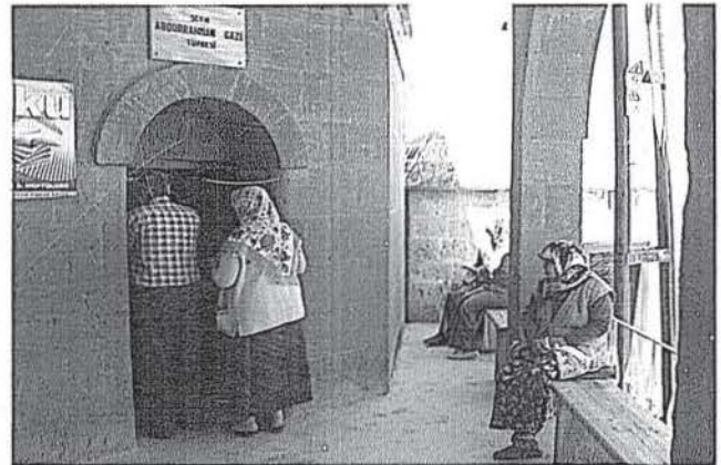
Şeyh Abdurrahman Gazi Türbesi

Günümüzde bu kanaldan evlenmek isteyen genç kızlar "o yanım keçe bu yanım keçe, elime helal süt emmiş bir koca geçe" cümle-