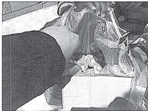
Dua ve adak sonrası ikram