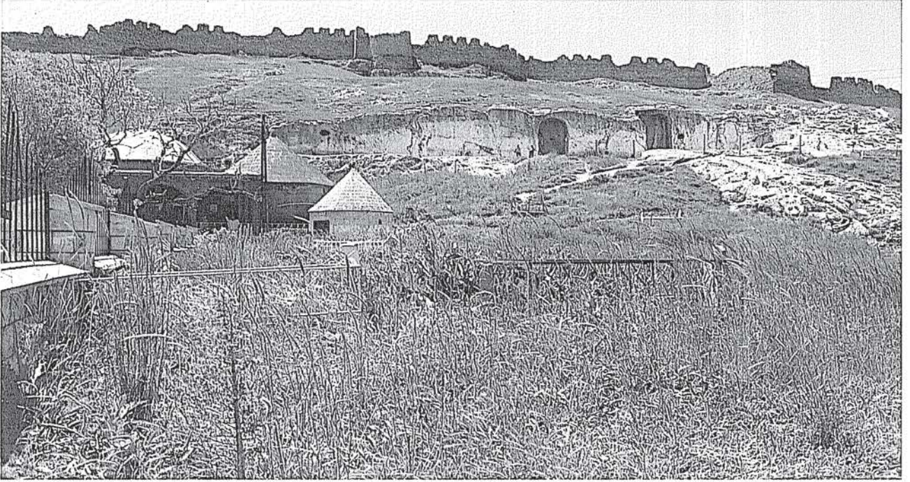
Şeyh Abdurrahman Gazi ve Analıkızın genel görünümü, kuzeyden