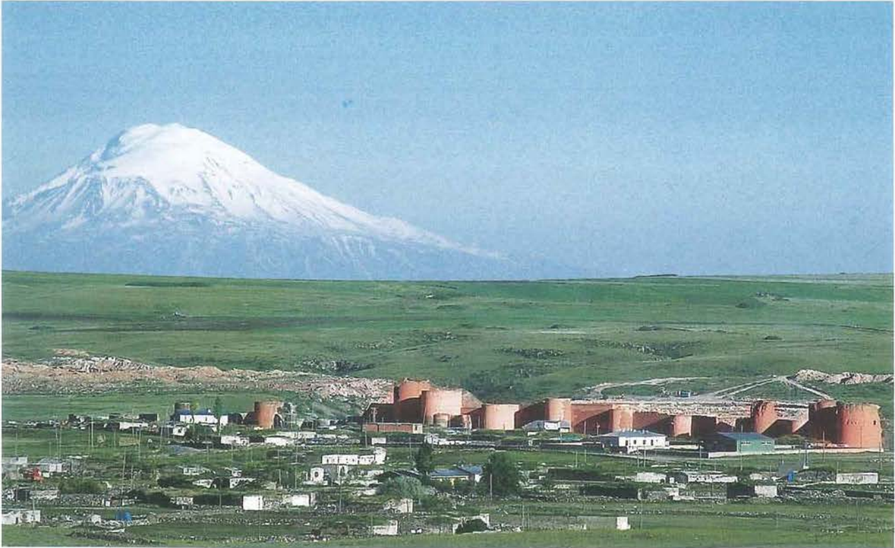
Anı'den Büyük Ağrı Dağı'nın görünümü (Y. Öztürkkan)

Türkiye'nin tek incisi, Göğsünde koyun sürüsü, Sendedir Nuh'un Gemisi, Gel saklama, Ağrı Dağı.