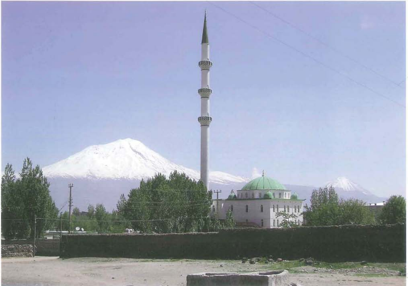
Büyük ve Küçük Ağrı Dağı (M. Lortoğlu)

Gamgüder mahlasıyla yazan ozan A. Kadir Kılıç, yazmış olduğu " Ağrı Dağı'na " adlı şiirinde, Ağrı Dağı'nın adının Ararat'tan Ağrı'ya dönüştüğünü, Nuh'un Gemisi'ne durak olduğunu