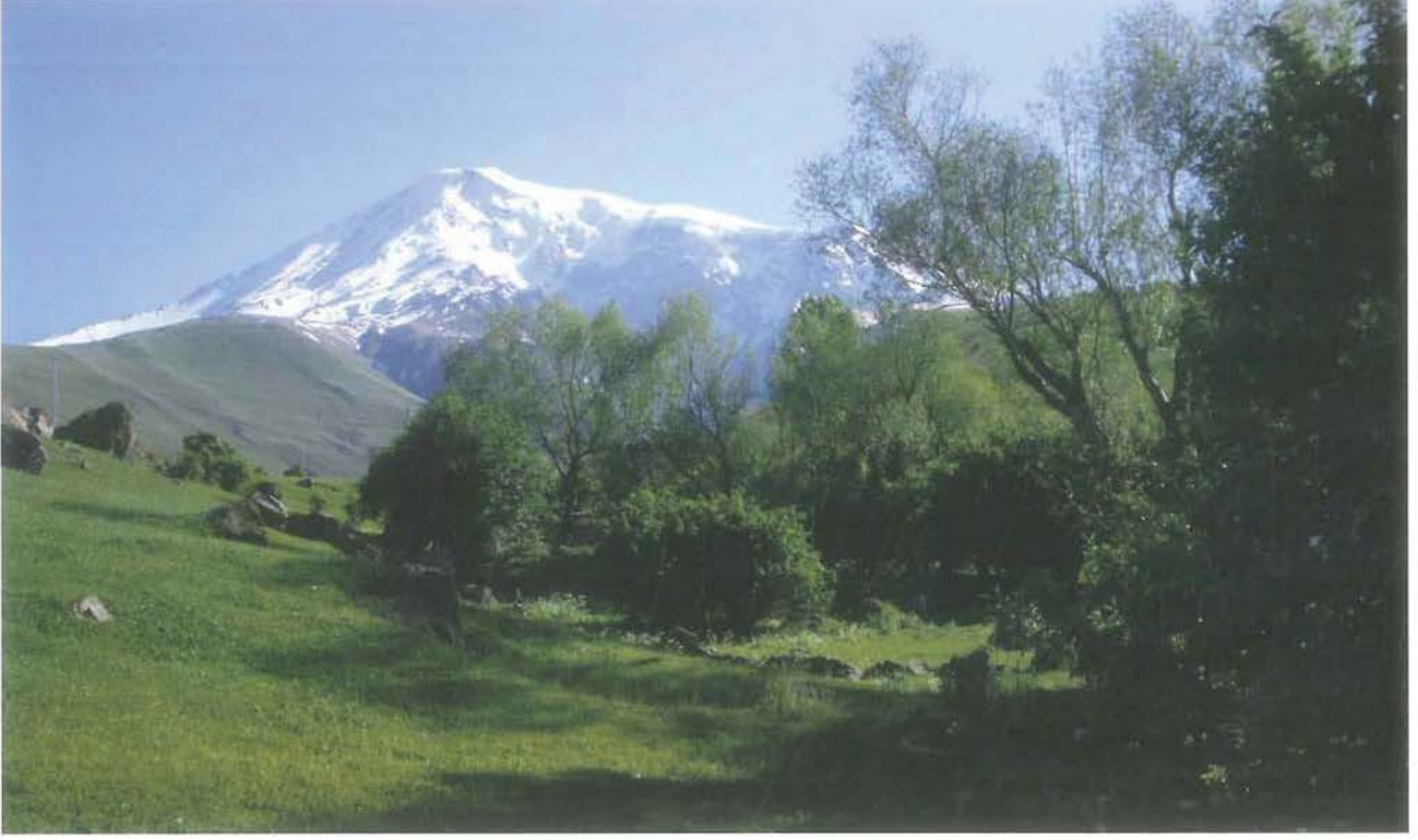
Büyük Ağrı Dağı (Z. Z. Acar)

Ozan Hüseyin Tuncer, yazmış olduğu “Ağrı” adlı şiirinde, Hz. Nuh’un Gemisi’ni Ağrı Dağı’nda bulunduğunu ve bu kutsal geminin Ağrı Dağı tarafından saklı tutulduğu için sürekli ağrı hissettiğini, bu ağrının geçmesi için dağın gemiyi insanlığa geri vermesini şu felsefe dolu dizelerle istemektedir: