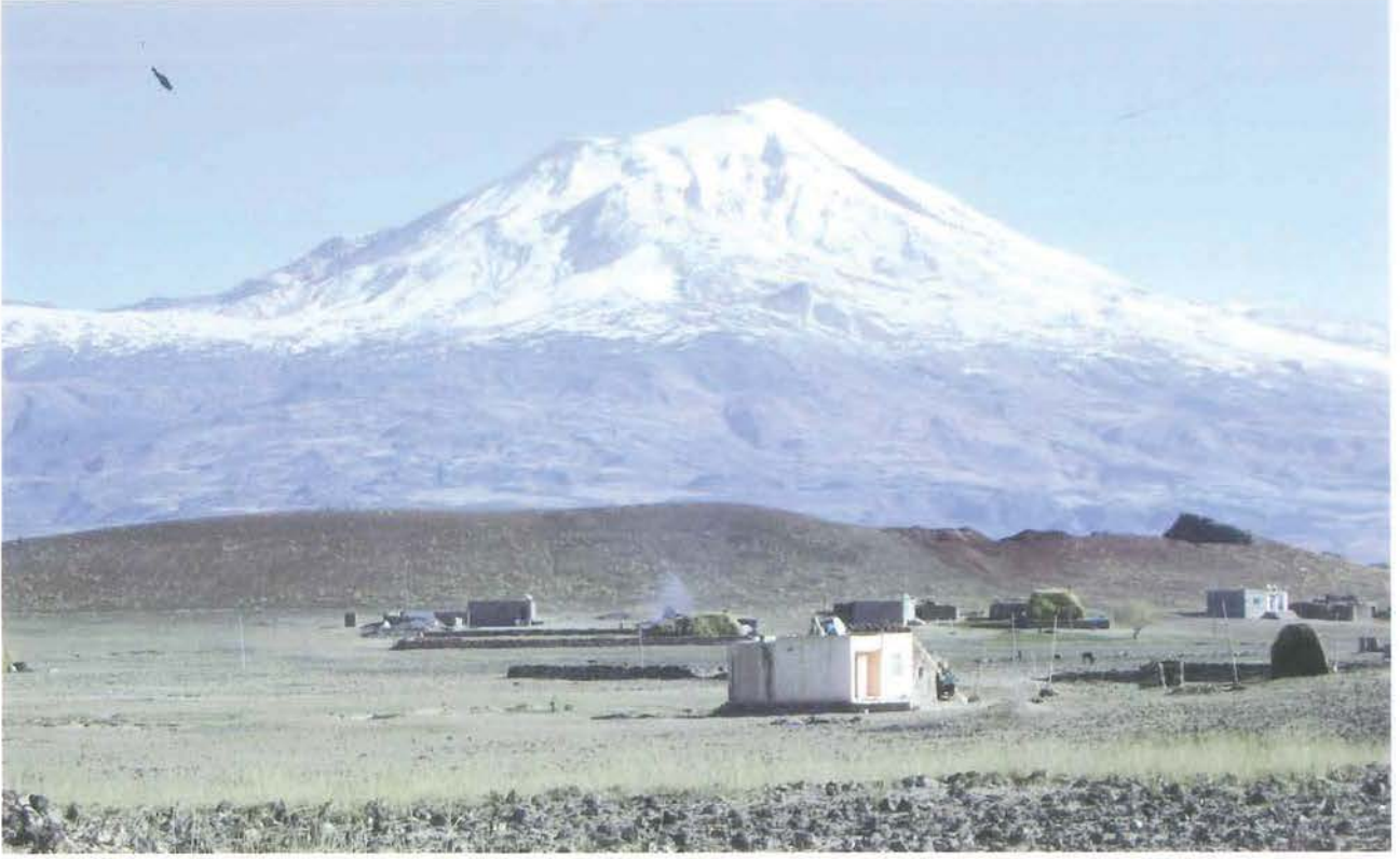
Büyük Ağrı Dağı (M. Lortoğlu)

Başım üstde hele Nuh'un Tufanı Gar uçgunu üşündürür insanı, Senin zirven temizliğin unvanı, Sen de doğur, doğru Zöhre, doğru tan