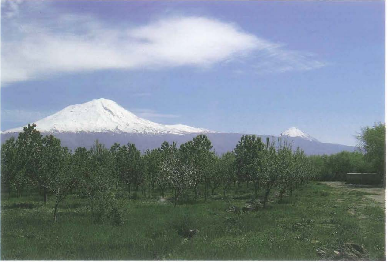
Büyük ve Küçük Ağrı Dağı (M. Lortoğlu)