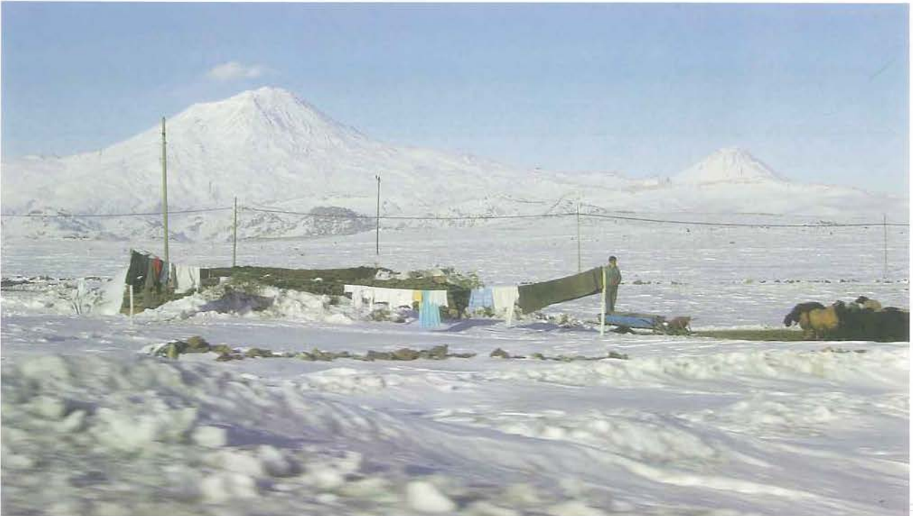
Büyük ve Küçük Ağrı Dağı (M. Lortoğlu)

Nuh-i Nebi’de mihman, gemiyle kutlu Ağrı, İslam coğrafyasında gururlu, mutlu Ağrı.