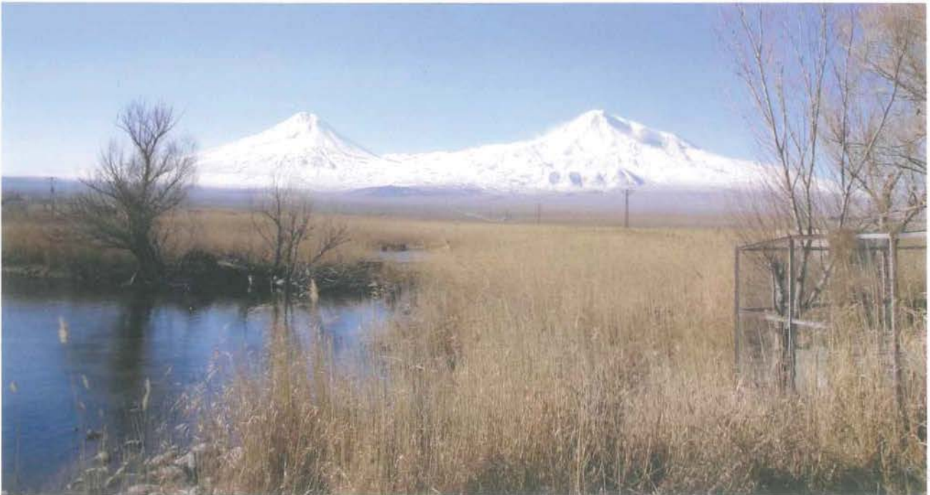
Türkiye-İran sınırından Büyük ve Küçük Ağrı Dağı'nın görünümü (Z. Z. Acar).