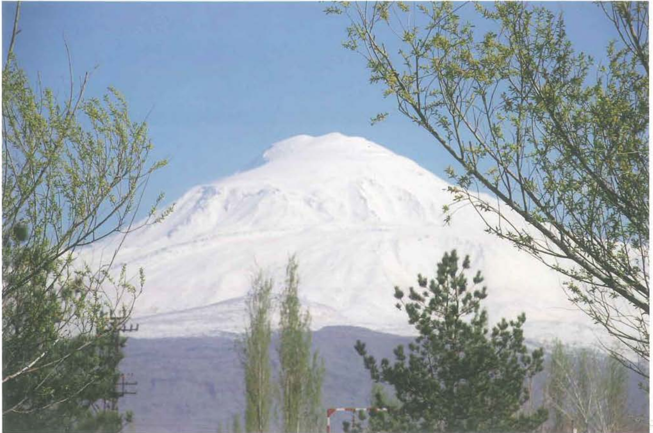
Büyük Ağrı Dağı