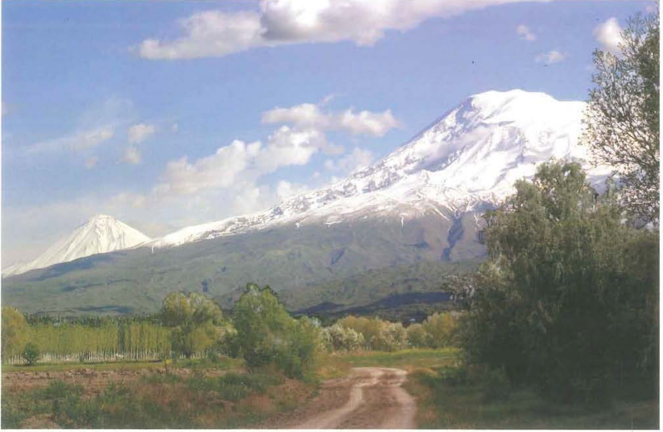
Büyük ve Küçük Ağrı dağları (Z. Z. Acar)

Halk arasında yüzlerce yıldan beri anlatılan bir başka söylence, Doğu Anadolu Bölgesi'nde Allahuekber, Süphan ve Ağrı Dağı adlarının Hz. Nuh tarafından verildiği konusundadır. Birbirine yakın olan bu üç dağ da, yüzlerce yıldan beri efsanelere konu olmuştur. Halkın bu üç dağın isminin Hz. Nuh tarafından verildiğine inanması, bizim için çok önemlidir. Ünlü ozan Gürsoy Solmaz da, bu söylenceyi şiirinde şu şekilde dile getirmektedir: