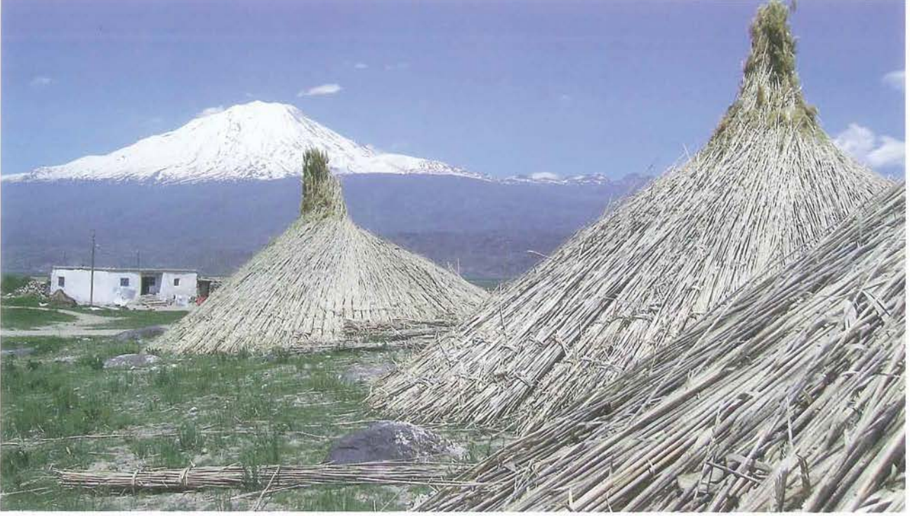
Büyük Ağrı Dağı (M. Lortoğlu)

ve bu gizemli sırrın çözümlenmesini, şu güzel dizelerle anlatmaktadır: