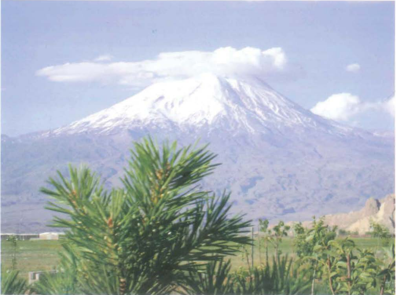
Büyük Ağrı Dağı