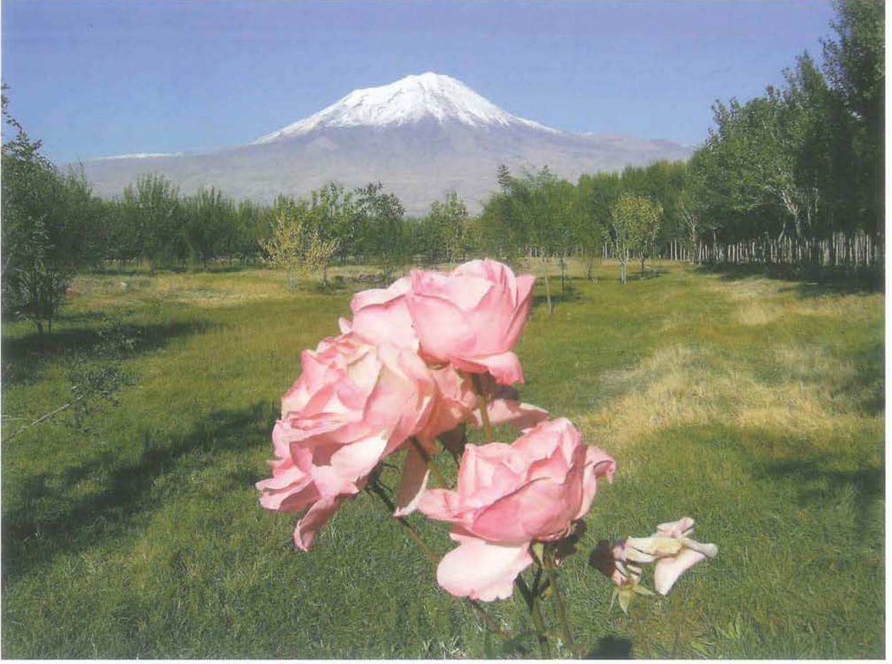
Büyük Ağrı Dağı (M. Lortoğlu)

oturduğunu felsefe anlamlı şu dizeler ile anlatmaktadır: