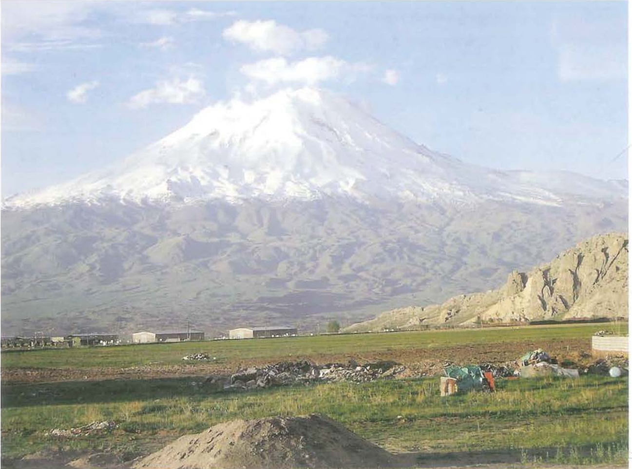
Büyük Ağrı Dağı