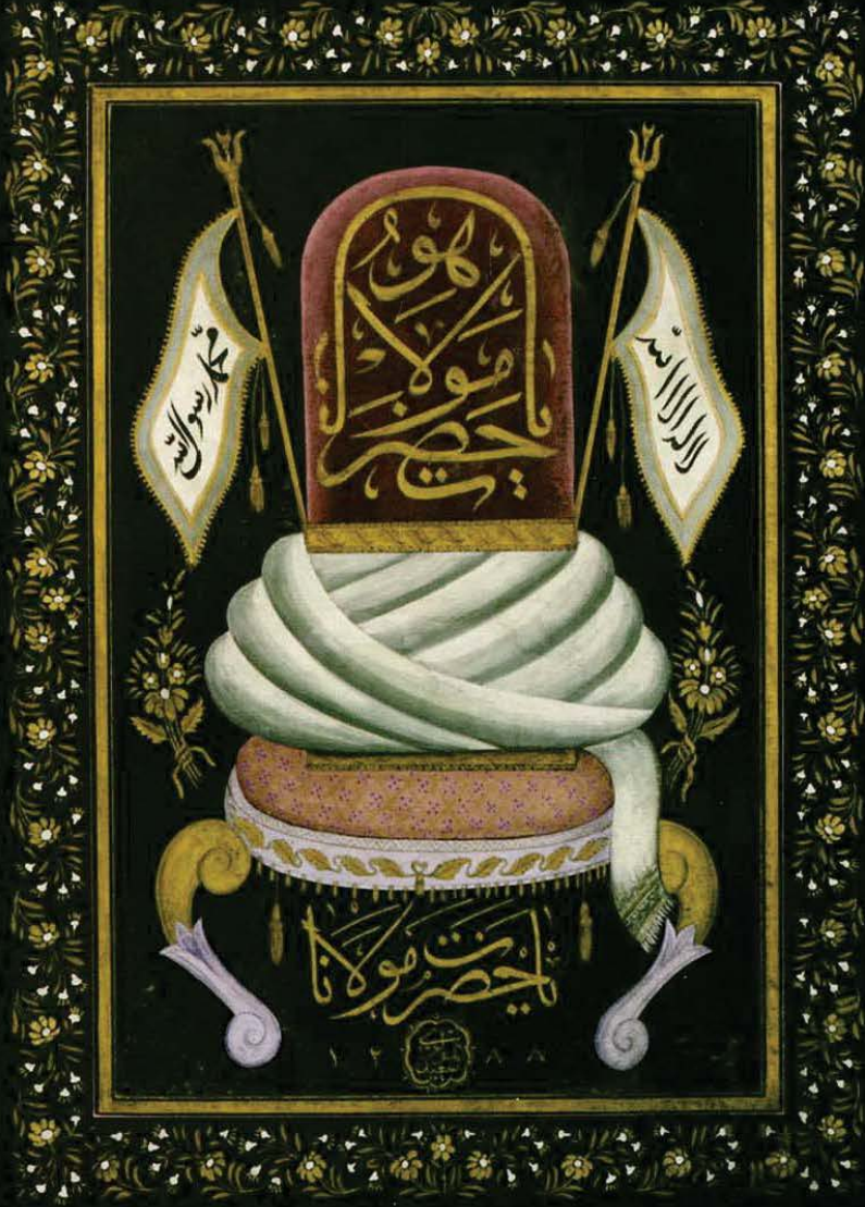
Mevlevi Sikkesi levhası