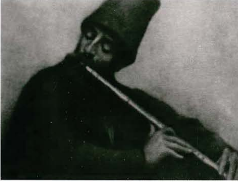
Ressam Zoncuro'nun "Neyzen" tablosu

gösterir. Dervişâne bir zühd sâhibi olduğu söylenemezse de, Mısır'da iken son senelerde kendini ibâdete verdiği ve Mesnevî ile meşgul olduğu bilinmektedir. 7