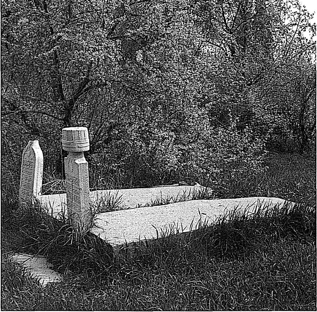
Balım Sultan Türbesi Mezarlığı