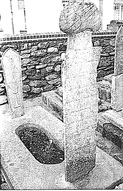
Resim 4- Karabaş-ı Veli Dergâhı Şeyhi Emin Efendi