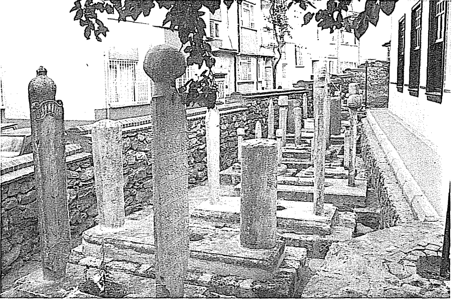
Resim 20- Karabaş-ı Veli Dergâhı'nın Haziresi