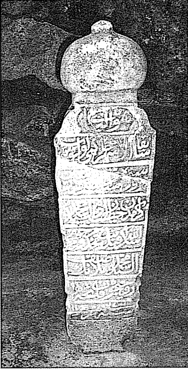
Resim 14- Alaşehir Hâkimi Mehmed Asaf

Sâbıkan Alaşehir hâkimi olub Bursa'da misâfir-i mukîm müddet-i sinîn Kirâmdan Hatîbzâde es-Seyyid Mehmed Şükrullâh Efendi'nin mahdûmı merhûm Es-Seyyid Muhammed Âsâf Mollâ'nın Ruhîçün fâtiha sene 1246