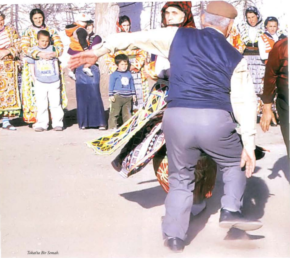
Tokat'ta Bir Semah.

mektedir. Buna göre 6 Mayıs günü Hızır ile İlyas, buluşmak üzere biri karadan, diğeri denizden gelerek buluşurlar. Birbirleriyle hasretlik giderdikten sonra ayrılık vakti geldiğinde de görev yerlerine dönmek zorunda kaldıklarından dolayı üzüntü içine girerler. Ayrıca yetim olduklarına inanılan Hızır ile İlyas'ın birbirlerinden ayrılmadan önce bir duvarın dibinde uydukları ve yaslandıkları duvarın çökmesiyle de duvarın dibinde buldukları parayı alıp fakir ve gariplere dağıttıklarına inanılır.