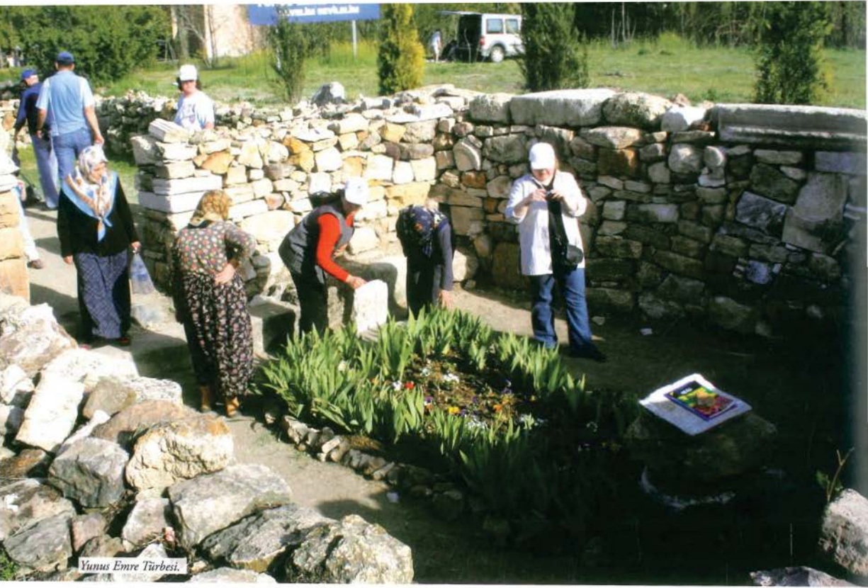
Yunus Emre Türbesi.

yer tanrılarına kesilen kurbanlardan sonra, büyük şenlikler başlıyordu. Yine Hun hakanları, Çinliler'le yaptıkları anlaşmaları Hundağı denilen yüksek bir dağın tepesinde kurban keserek içtikleri andla teyit ediyorlardı. Altaylı Şor ve Belterler, kurbanlarını yüksek dağ tepesinde yaptıkları âyinle Göktarı'ya sunuyorlar ve bu âyine "tengere tayıgtarı-gök kurbanı" diyorlardı. Yine Çin yıllıklarına göre Göktürkler, bahar bayramlarını mezarlıklarda kutluyorlardı. Kadın erkek herkes, kurban günlerinde bayram elbiseleriyle mezarlıklarda toplanıyorlardı. Göktürklerde kutlanan bahar bayramının farklı bir boyutu daha vardı. Zira kutlama esnasında bir erkek, bir kızı beğenirse, evine döndükten sonra kızın ailesine bir görücü gönderiyordu. Böylece bahar bayramı şenlikleri, yeni ailelerin kurulmasının da yolunu açıyordu. Ayrıca Müslüman Kazak-Kırgızların ve Başkurtların Mayıs ayında yaptıkları bayrama "Kımız Murunduk" adı veriliyordu. Başkurt kadınlarının ilkbaharda yaptıkları şenliğe ise, "karga toy" denilmekteydi. Yakutların Mayıs'ta yaptıkları bayramın adı, "Tykün (ay, güneş)" bayramıydı. Bugüne bütün her-