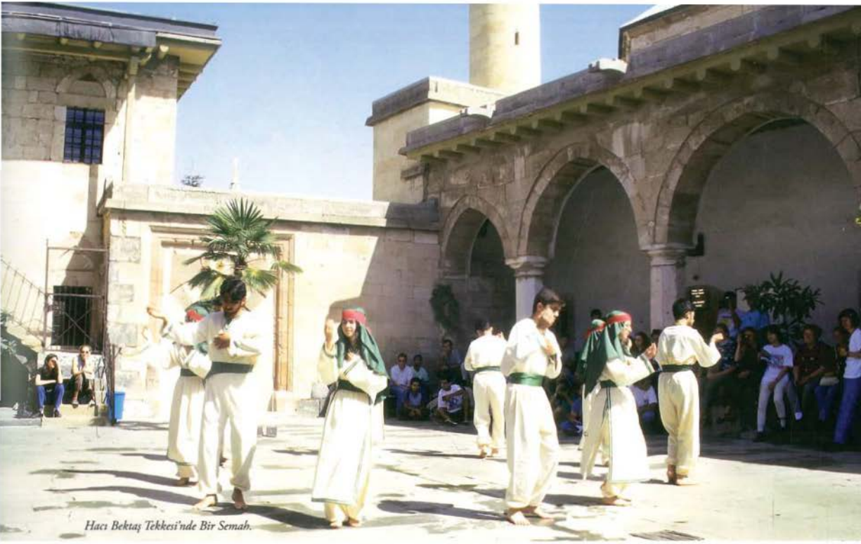
Hacı Bektaş Tekkesi'nde Bir Semah.

tarihin Hıdırellez'in kutlama tarihiyle aynı olması, St. Georges'un beyaz atlı, savaşçı ve ejderha öldürdüğü tasavvur edilen bir aziz olması nedeniyle, eski Türk kahramanlarına benzemesi ve Türk velileri ile özdeşleştirilmesi, ayrıca ejderha söylencesinin Hızır'a ve Sarı Saltuk'a mal edilmesi gibi bulgular, bu iki kült arasındaki benzerlikleri ve Hristiyanlarla Müslümanlar arasındaki etkileşimi açıkça ortaya koymaktadır.