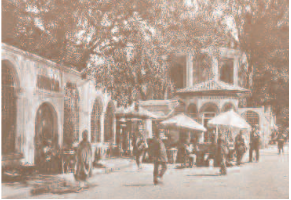
Çarşıkapı ve Sinan Paşa Türbesi 1860 civarı. İstanbul Anıları. Sedad Hakkı Eldem. Resim 67