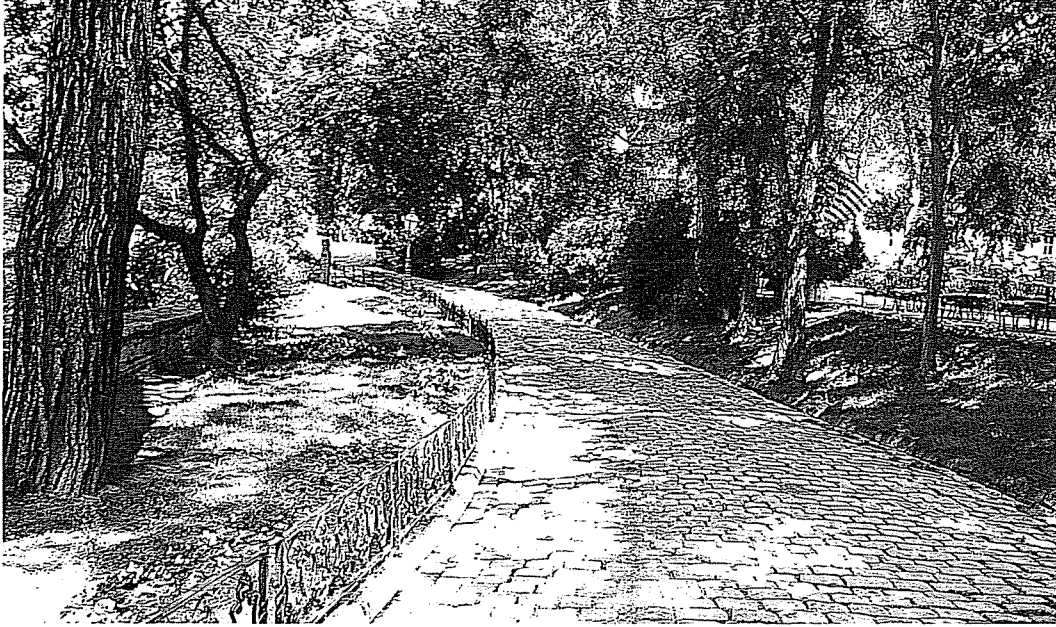
Hıdiv Kasrı'na giden bahçe yolu

Hanım gibi Müslüman bir kadının Avrupa seyahatlerine çıkmasının sakıncalı olduğunu ve Frenk adetlerine tabi olmasının yakışık almayacağını ifade etmiştir. Cavidan Hanım'ın paravan olarak kullanıldığı bu tür telkinlerden maksat, ebette ki hıdiv ve eşinin yaz tatillerinin tamamını İstanbul'da Sultan'ın gözetimi altında geçirmelerini sağlamaktı. Ancak bu tür telkinlere ne Hıdiv ne de eşi itibar etmemiştir. 66