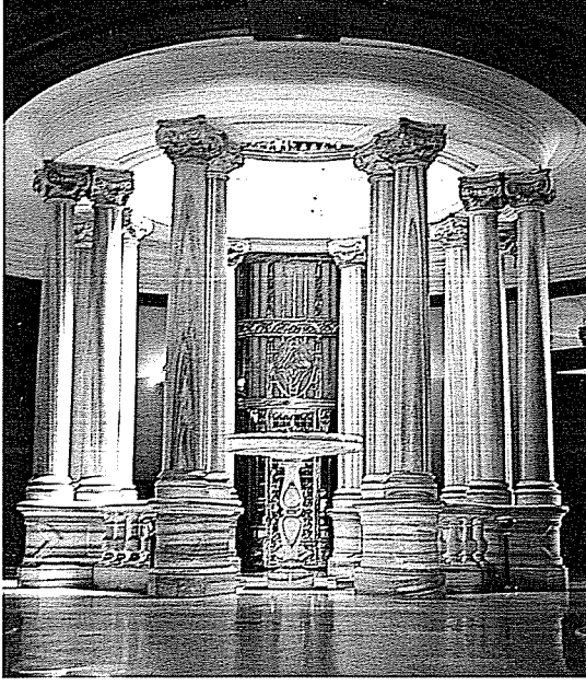
Kasrın alt katında bulunan mermer sütunlu salon