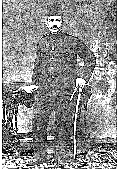
Hıdiv Abbas Hilmi Paşa

Mısır hıdivinin buraya adeta sarayı andıran bir kasır inşa ettirme süreci, bunun Üsküdar'ın sosyo-iktisadi ve kültürel yapısında yarattığı etkiler ön planda tutulmaya çalışılacaktır.