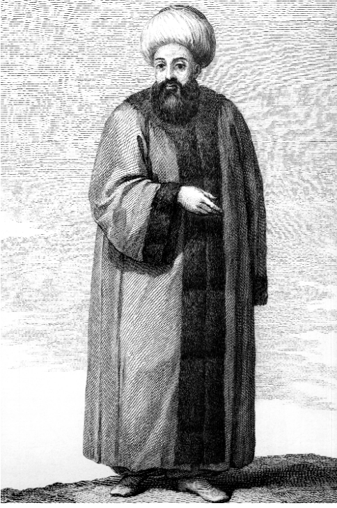
Osmanlıda bir kadı (d'Ohson, Tableau General, II )

rak değerlendirmesini yaptıktan sonra değerlendirmeye alınan bazı hükümlerin transkribe metinlerini verdik.