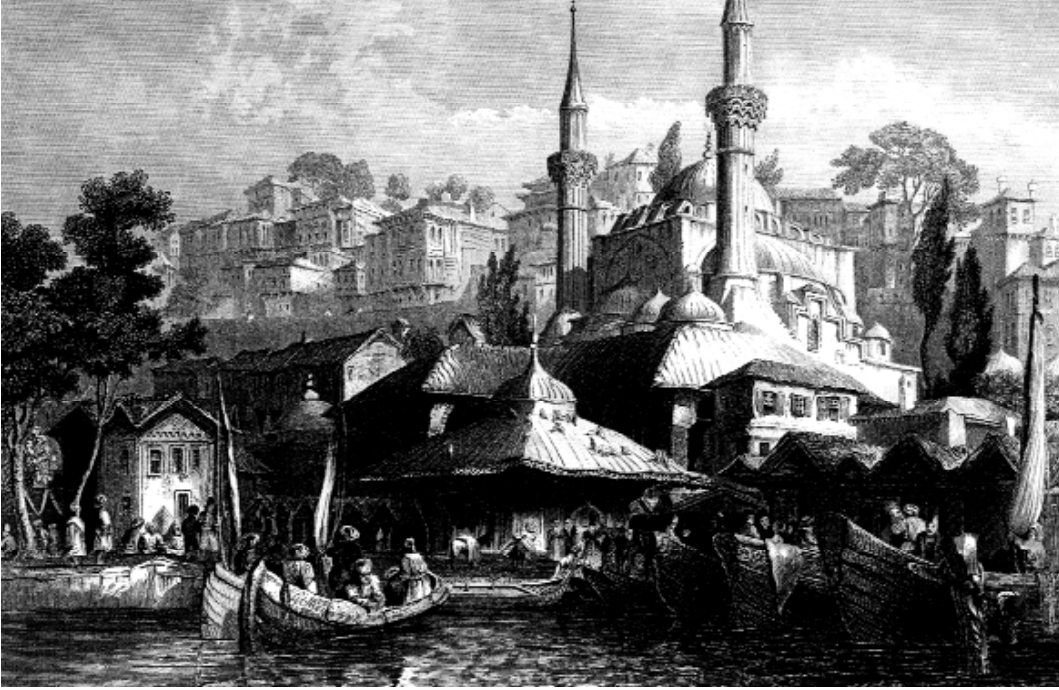
Üsküdar İskelesi ( Üsküdar Hatırası , s. 32)