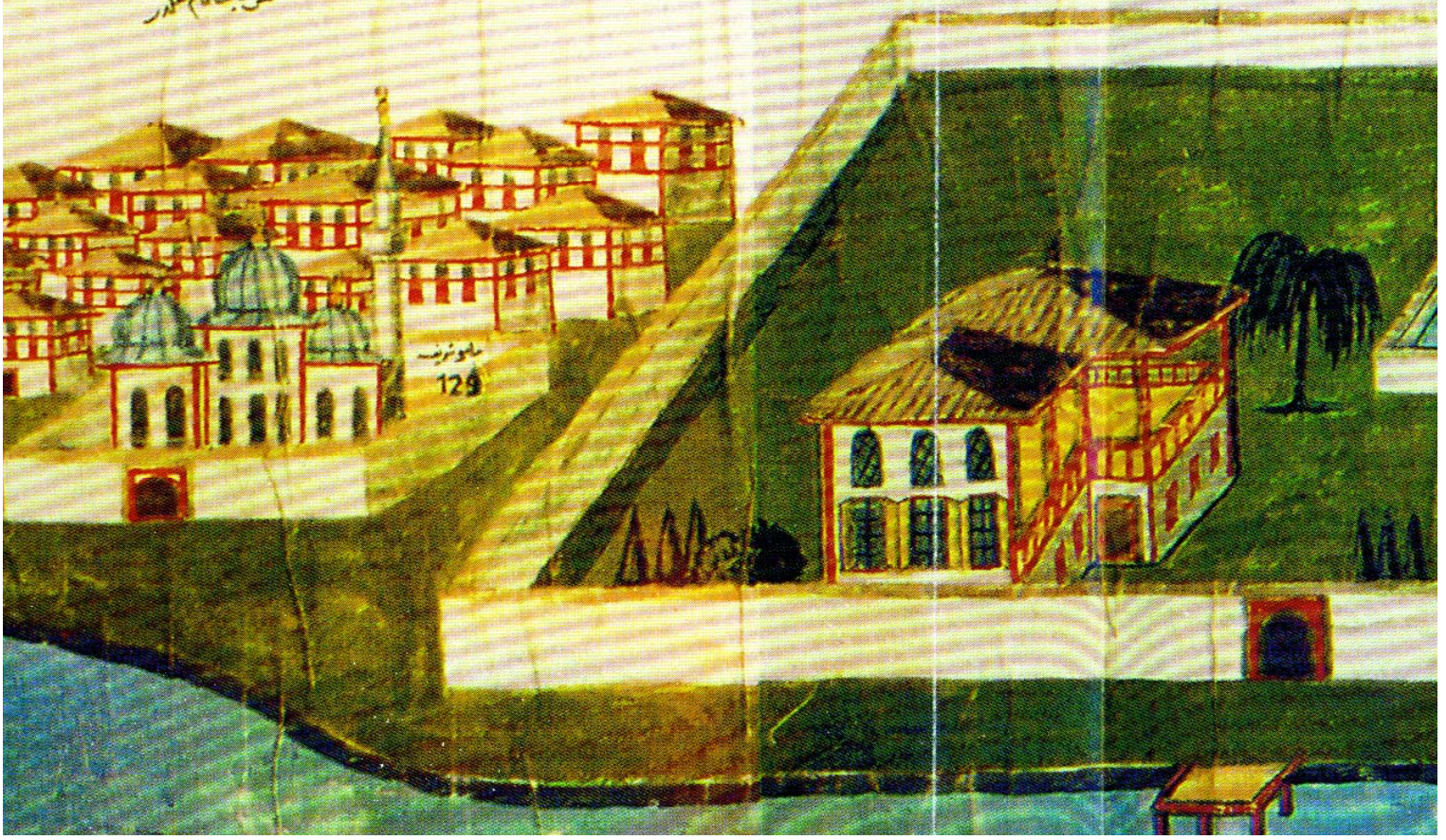
1784'te Şam'dan İstanbul'a getirilen "Kadem-i Şerif" in bir gece bekletildiği Şemsipaşa Sarayı