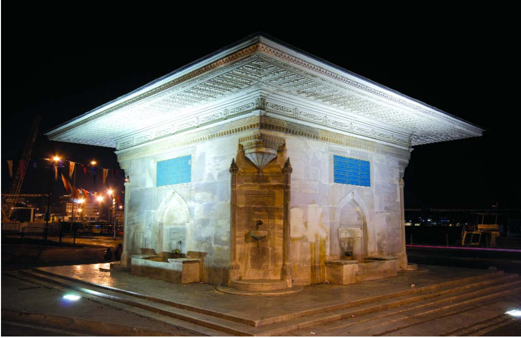
Taylesanizâde'nin bahsettiği III. Ahmed Çeşmesi'nin bugünkü hâli

suların Valide Camii'nin avlusunu deryaya döndürdüğünü, en üst basamağa kadar yükseldiğini yazarken bütün dükkânların harap olduğunu, hamamlardaki kadın ve çocukların mahsur kalıp ancak duvarlar delinmek suretiyle bunların güçlükle çıkarılabildiklerini, mezarlıkların dağılıp kemiklerin selle ortalığa saçıldığını, Ağa hamamı ve Çinili hamamın kemik, tahta parçaları ve taşlarla dolduğunu belirtir. Sel felaketi Üsküdar ve Boğaz'daki yalıları, bahçe ve bostanları, kayıkhaneleri birbirine katmış, hatta Çengelköy'de bir değirmen dolabı beygirini büyük bir çınar ağacının tepesindeki dallardan birine takılı halde bırakmıştır. 15 Özellikle Çengelköy'de 60 kadar kadın ve çocuk sele kapılıp hayatını kaybetmiştir.