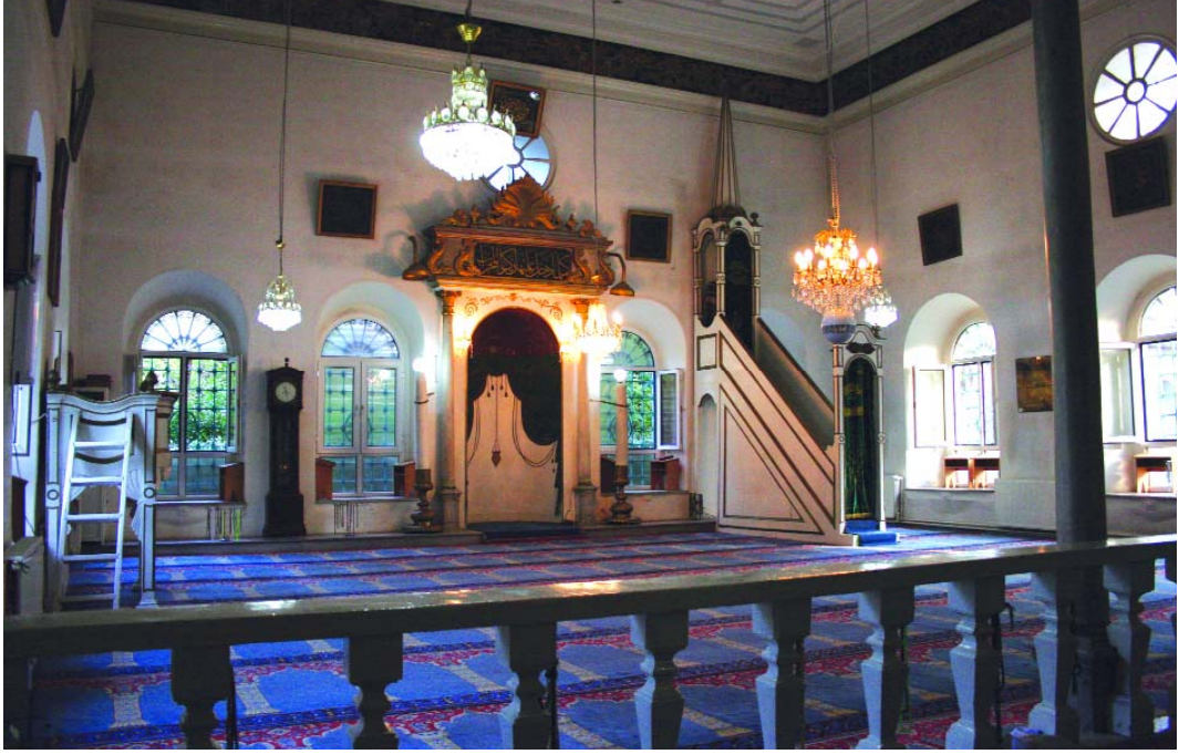
Çiçekçi Camii'nin iç görünümü

avlusunda türbede mevcut kabirlerin hizasına yakın gelecek şekilde avlu kapısının sağ tarafındaki ikinci ve üçüncü pencere arasındaki duvar üzerine raptedilmiş, önüne de türbede medfun olanların kemikleri aynı sıra ile mermer pehleler arasına defnedilmiştir. Altı beyitten oluşan kitabe,