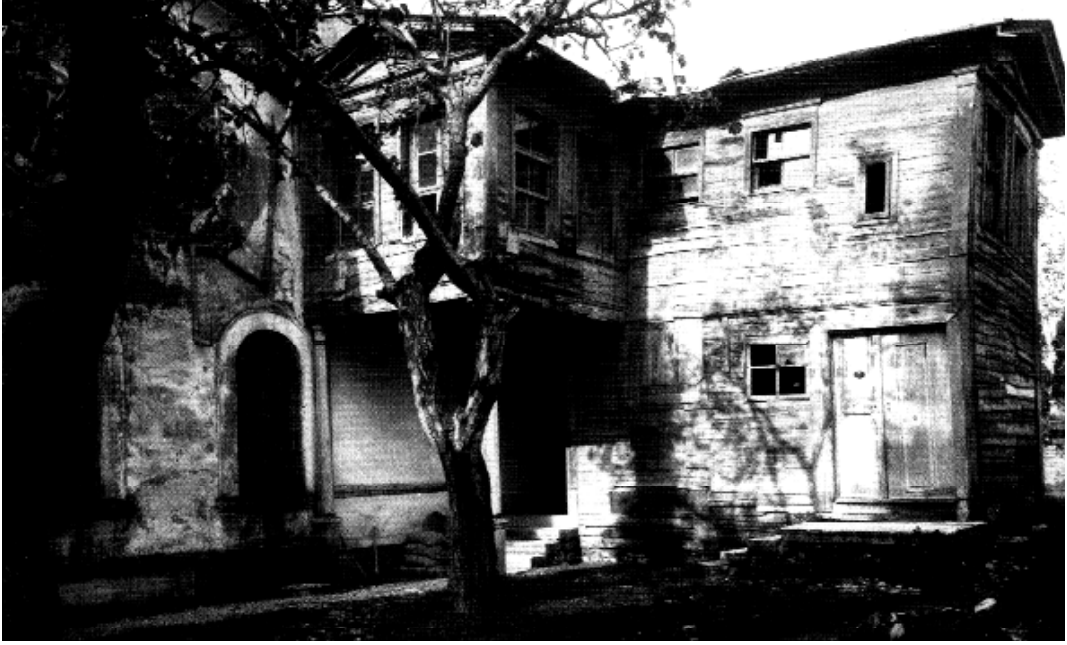
Çiçekçi Camii ( Bir Ulu Rüya'yı Görenler Şehri Üsküdar , s. 201)

Her kim bu tarika girdi Hasan-ı Basrî'ye erdi Her seher okunur virdi Seyyid Yahyâ'dır pîrimiz