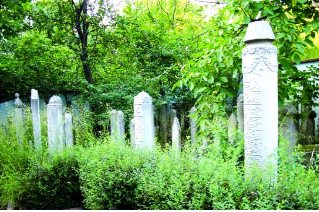
Çiçekçi Camii'nin haziresinden genel bir görünüm

hi verdikten sonra Ayvasarayî'den naklen Bezcizâde'nin zayıf bir ihtimalle “mülâkat-ı mevt” terkinin gösterdiği 1018 (1609) yılında vefat etmiş olabileceğini de ileri sürmektedir. 13