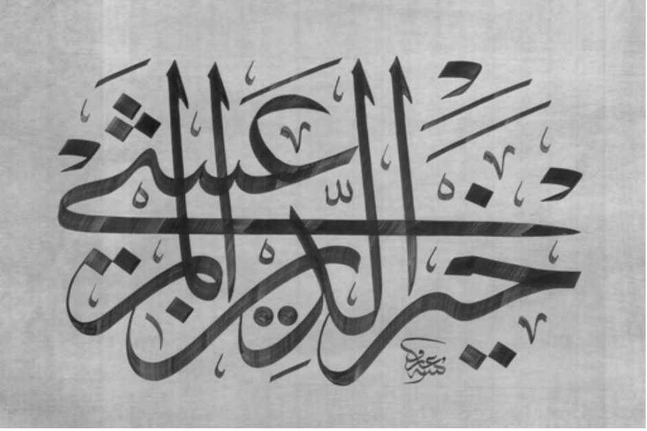
5- Günümüz Hattatlarından Arif Yücel tarafından yazılmış (istif edilmiş) 'Hayreddin El-Maraşî' Yazısı.