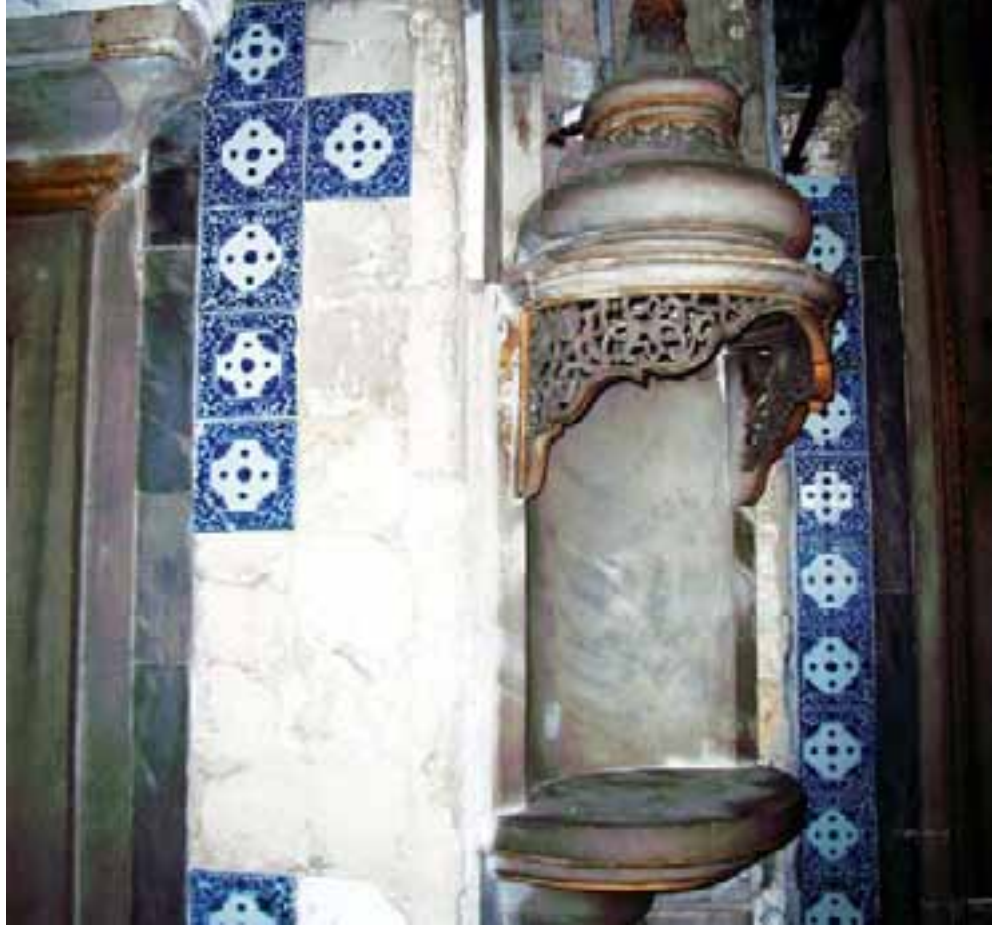
Resim 1: Ayazma Camii Hünkâr Mahfili

Kenarlar pahlı ve sırsızdır, çinilerin hamuru pembemsi bir renge sahiptir. Kenar bordürleri paralel çizgiler arasındaki çiçek ve yapraklardan oluşmakta, bunlar ortadaki sepetten iki yana doğru uzanmaktadır. İçinde papatya benzeri bir rozetin bulunduğu merkezi karenin dört köşesinde ortaya doğru uzanan çiçekler yer almaktadır. Çiçekler iri bir fırça ile seri bir şekilde yapılmış gibidir, konturlar daha koyu mavi olup, sırlama ve fırınlamadan sonra altın yaldızla detaylandırılmıştır.