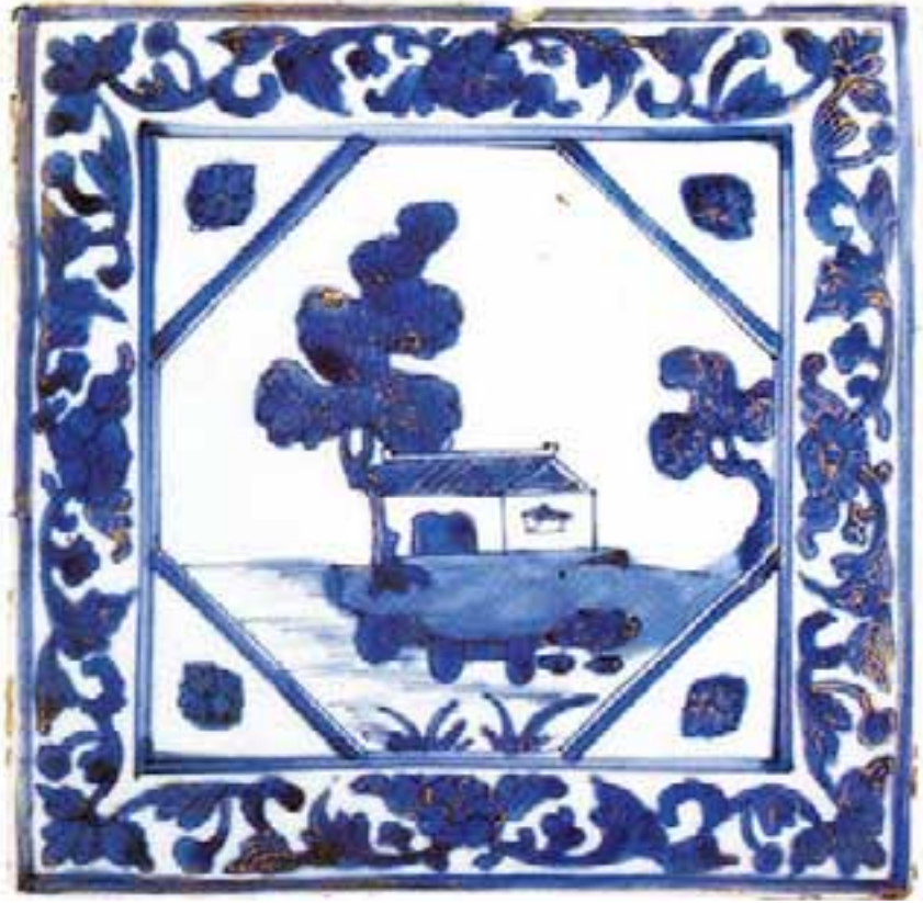
Resim 3: Çin çinisi (20,5x20,5 cm)

Kubbe kasnağını çevreleyen pencereler camiinin aydınlatılmasında rol oynamaktadır. Camiinin inşaat defteri TSM arşivinde (Env. No.: 1137) korunmakta olup, kullanılan her türlü malzeme ve çalışan işçilerle ilgili bilgiler vermektedir. 10 Defterde çiniler ile ilgili herhangi bir bilgiye ise yer verilmemiştir.