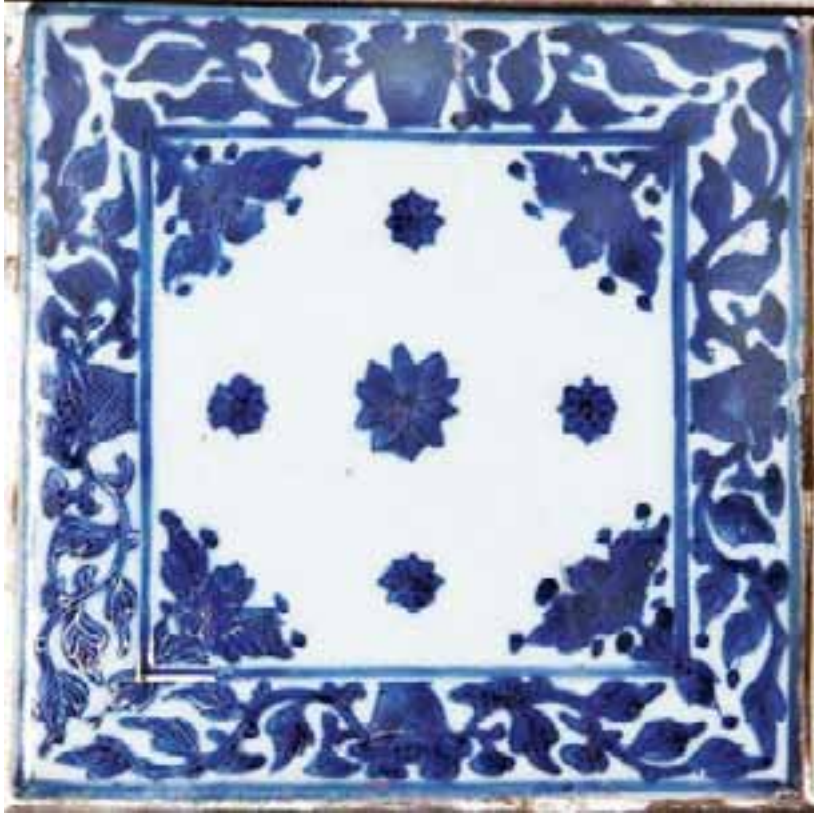
Resim 4: Çin çinisi (19x19 cm)

da denilen hasbahçe, Bizans İmparatoru Büyük Konstantinos'un yaptırdığı kilisenin haçından dolayı XVIII. yüzyıla kadar "İstavroz Bahçesi" (Yun. Stauros = haç) adıyla anılmıştır. İstavroz adı, Subhi tarihinde ve Evliya Çelebi seyahatnamesinde de geçmektedir. 12 Dışarı kuvvetli bir çıkıntı yapan mihrap bölümü alçak bir yarım kubbe ile örtülüdür. İkinci minare II. Mahmud dönemindeki onarımlarda eklenmiştir. Mimarı Tahir Ağa, bina emini Mustafa Efendi'dir. Cami Barok üslupta olmasına rağmen kullanılan çeşitli çiniler sayesinde duvarlar tezatlı, değişik bir etki yaratmaktadır. 13 Mihrap duvarlarında üst kısımda kullanılan İznik çinilerinin yanı sıra, yan duvarların tümüyle Çin çinileriyle kaplandığı görülmektedir.