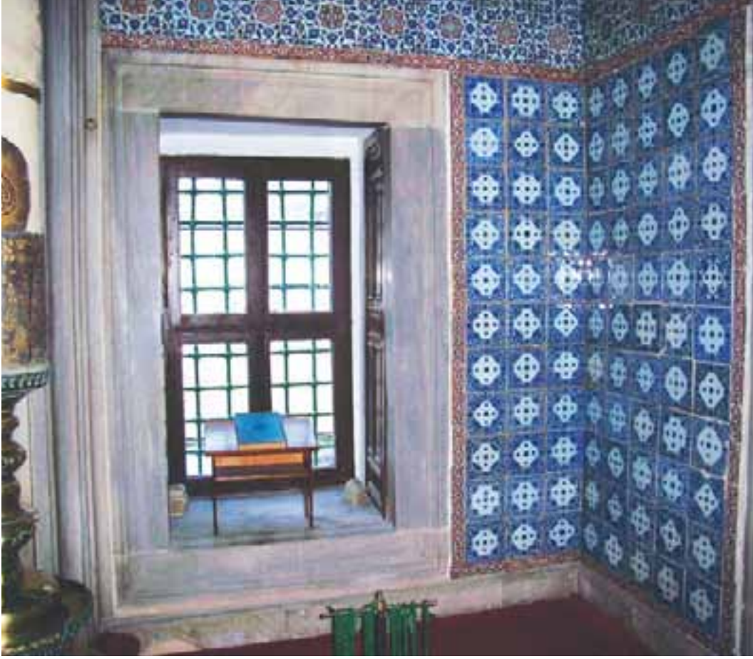
Resim 2: Beylerbeyi Camii mihrap duvarı

Muktedâ-yı ehl-i sünnet cami-i mecmu-ı hayr