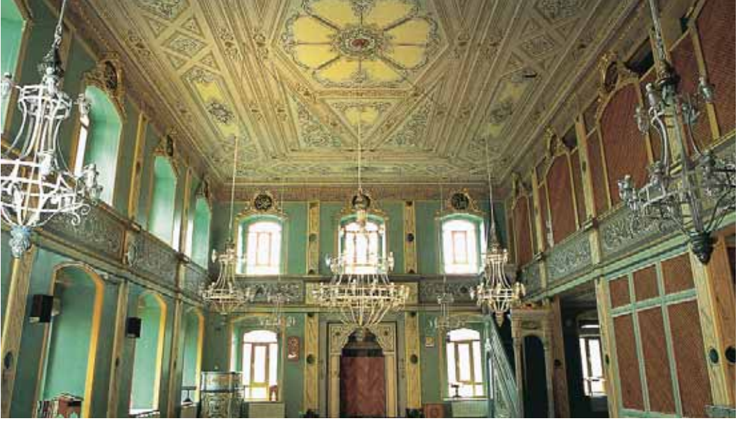
Aziz Mahmud Hüdayî Câmii'nin iç görünüşü

sayfalarda “ Hâdimü'l-fukarâ Seyyid Şeyh Celâleddin ” mührü dikkat çekmektedir. Bu zâtın eserin müstensihî veya şahsî kütüphânesinde muhâfaza yoluyla eserin günümüze ulaşmasını temin eden kişi olabileceği düşünülmektedir. Eser okunaklı sayılabilecek nesih kırmısı bir hatla yazılmıştır. Meclislere numara verildiği gibi bu numara sıralarında pek titiz davranılmadığını ve konuyu belirleyen bir başlığın bulunmadığı tespit edilmektedir. Meclislere “ Meslis-i âhar ” ifadesiyle ve bir-iki istisna dışında besmele kullanılmadan istiâzeyle başlanmıştır. Bazı meclislerde ise istiâze ve besmeleye hiç yer verilmeden o meclisin konusunu teşkil eden âyete doğrudan geçilmiştir. Yine sayfalar numaralanmış olmakla birlikte meclis numaralarında da görüldüğü üzere itinalı bir düzende değildir. Her sayfa on beş satırdır. Eser tarafımızdan “Aziz Mahmud Hüdayî, Sohbetler , [İnsan Yayınları, İstanbul 1995]” adıyla neşredilmiştir.