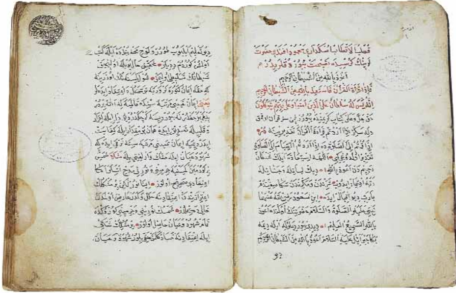
Aziz Mahmud Hüdâyî'nin nasihatlerini ihtivâ eden eserden örnek sayfalar

nefsile mücâhede ede. Ol kimseye Allah Sübhânehû ve Teâlâ hidâyet eder.” 6