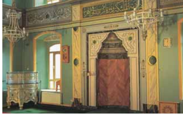
Aziz Mahmud Hüdâyî Câmii mihrab ve kürsüsü

گبر و ترسا وظیفه خور داری تو که با دشمنان نظر داری