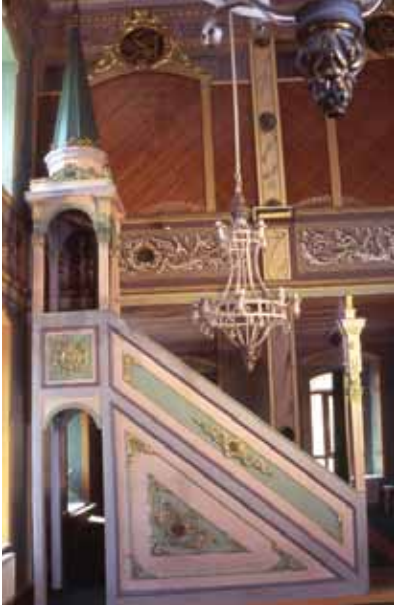
Aziz Mahmud Hüdâyî Câmii minberi