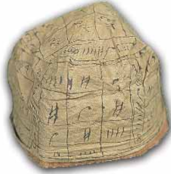
Azîz Mahmud Hüdâyî'nin âyetlerin ebced karşılıklarının yazıldığı takkesi

numaralarda kayıtlıdır. Dergâhında okuduğu hutbeleri içeren bu küçük hacimli eserin İstanbul'un diğer kütüphanelerinde ve Bursa kütüphanelerinde başka nüshaları olduğu bilinmektedir. Bu hutbelerin uzun yıllar Hüdâyî âsitânesinde okunmuş olduğu hattâ bunların belirli makâmlarda îrâd edildiği rivâyet edilmiştir.