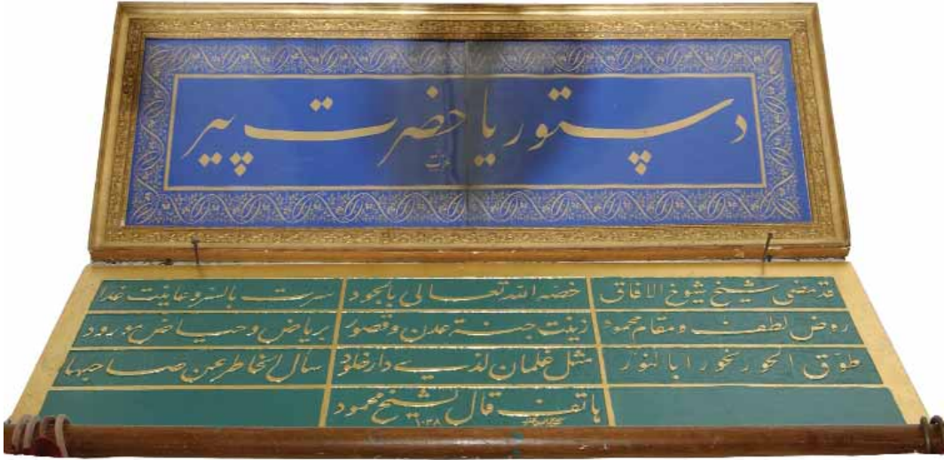
Türbenin ana giriş kapısı üzerindeki Levha "Destur Ya Hazret-i Pir"

onların fikhî yaklaşımlarına atıflarda bulunur. Bu ifâdeler Hüdâyî'nin amelî olarak hangi yolda olduğunun da bir işâretidir. "Kim zerre miktarı hayır yapmışsa onu görür. Kim de zerre miktarı şer işlemişse onu görür" 30 anlayışını toplum vasatına yayma endişesi taşıyan Hüdâyî, âhîret mutluluğu için dünyâ hayâtının bu dengede geçmesi gerektiği fikrini dile getirir. 31 İçki içilmesi konusunu ise bilinen bir menkıbe ile anlatır fakat yaygınlığından olsa gerek isim vermez.