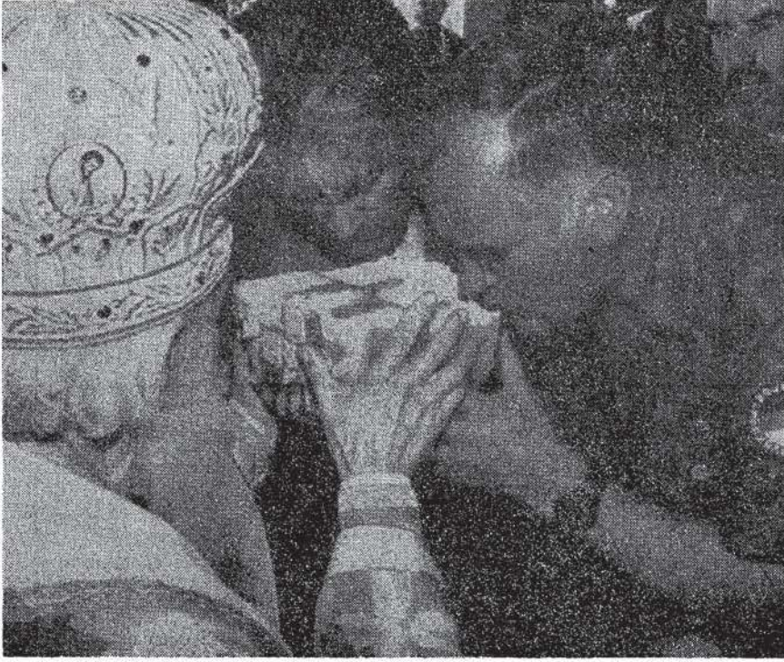
Bosnalı Sırpların lideri Rodovan Karadzic ve komutan Ratko Mladiç hafta sonu kutladıkları dini bayram ayininde Ortodoks patriğin elinde «kutsal ekmek» yedi.

mültecilerin evlerine dönmeleri ve Bosna-Hersek'in her yerinde seyahat özgürlüğü şöyle dursun, Radovan Karadjiç, Ratko Mladiç gibi birçok savaş suçlusunu da serbest dolaşmaktadır. Oysa Deytin Barış Antlaşması ile bunların La Haya Adalet Divanı 'nca cezalandırılmaları öngörülmüştür.