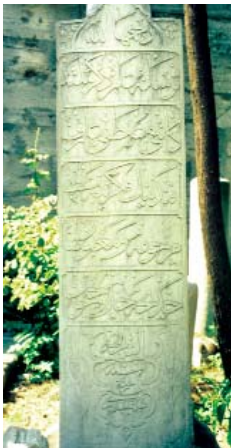
Resim 8; İsmail Zühdiye Çeşme hattı detayı