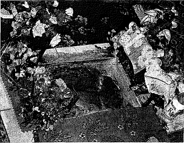
Gurmaşende mevkiinde Sarı Saltuk'a ait ayak izlerinden detay