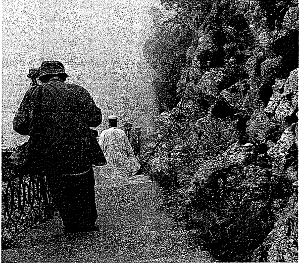
Kruxya, Sarı Saltuk Türbesine götüren merdivenli yol

Kruxya'daki Sarı Saltuk türbesinin muhtemelen Osmanlı öncesi pagan (çoktanrılı) dönemine ait bir kült (ayın) yeri olduğu ve 13. yy.da "Bektaşiliğin Sarışın Havarisi (Blonde Apostle of Bektashism)" olarak adlandırılan Sarı Saltuk'un müritleri ile beraber buraya yerleştikleri dönemde inşa edilmiş olabileceği ihtimali üzerinde durulmaktadır. 13 Ancak, 1929'da yapılan bir araştırmada, türbede H.1104/M.1692-93 tarihli bir kitabeden söz edilmektedir. 14 Bir başka araştırmacı da türbe yakınında H.1190/M.1776-77 tarihli bir çeşme kitabesinden ve Hacı Hamza'nın ölüm tarihini taşıyan (H.940/ M.1533-34) bir mezar taşından bahsetmektedir. 15 Günümüzde gerek türbe ve çeşme kitabelerinden, gerekse bu mezar taşından hiçbir iz kalmamıştır. Bu yazılı kaynaklara istinaden türbe ve diğer yapıların 17. yy.da varlıklarını sürdürdüklerini söyleyebiliriz.