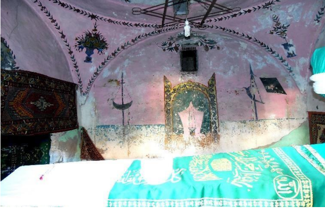
G.3: Hacı Nazır Türbesi, iç mekân, güney cephe