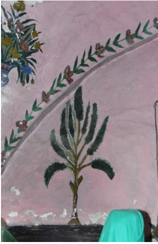
G.11: Hacı Nazır Türbesi, kuzey cephe batıdaki pencerenin üst kısmı