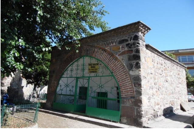
G.1: Hacı Nazır Türbesi kuzeydoğudan görünüş