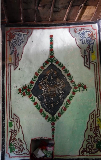
G.33: Ali Pir Civan Türbesi, batı cephenin kuzeyindeki pano