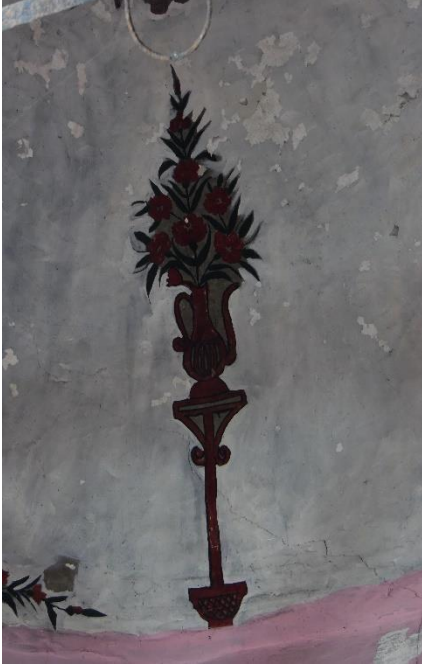
G.18: Hacı Nazır Türbesi kubbe eteği natürmort