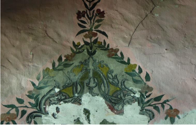
G.9: Hacı Nazır Türbesi doğu cephe detay