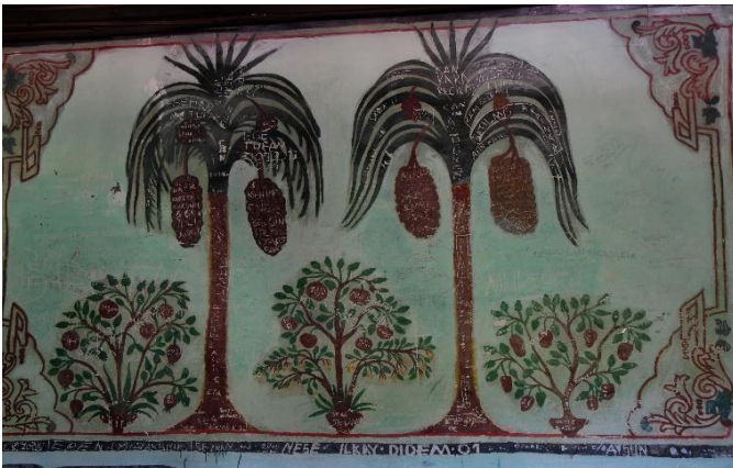
G.21: Ali Pir Civan Türbesi, iç mekân kuzey cephe ortadaki pano