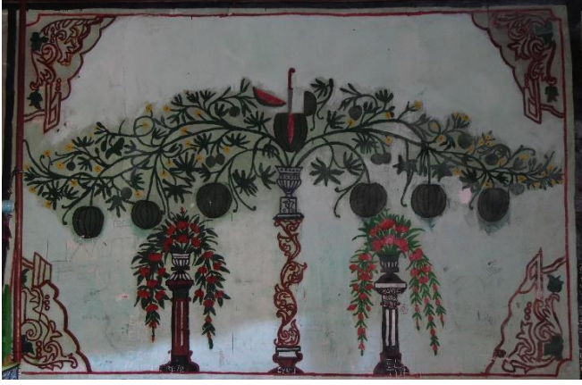
G.26: Ali Pir Civan Türbesi, iç mekân doğu cephe ortasındaki pano