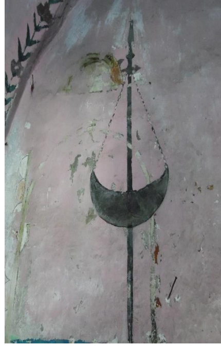
G.6: Hacı Nazır Türbesi, güney cephenin doğusundaki kompozisyon