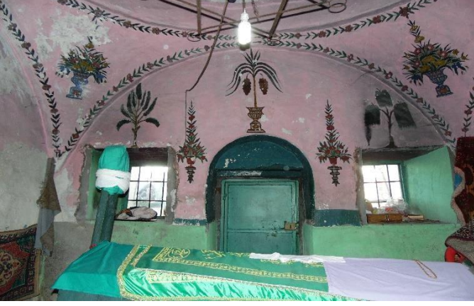
G.10: Hacı Nazır Türbesi, kuzey cephe genel görünüş