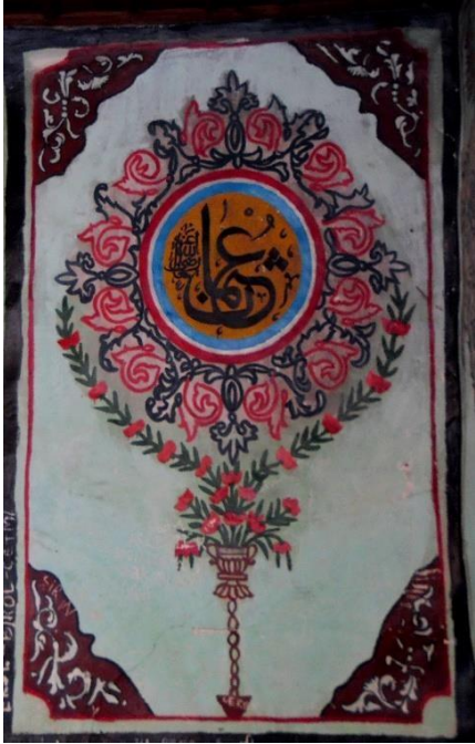
G.27: Ali Pir Civan Türbesi, iç mekân doğu cephe güneyindeki pano