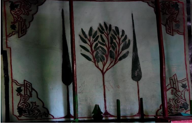
G.25: Ali Pir Civan Türbesi, iç mekân doğu cephenin kuzeyindeki pano