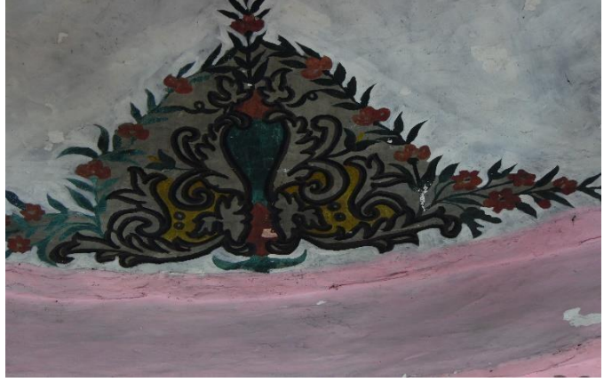
G.17: Hacı Nazır türbesi, kubbe eteği natürmort