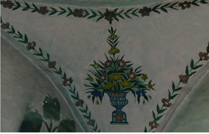
G.14: Hacı Nazır Türbesi, kubbeye geçiş sistemi