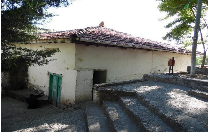
G.19: Ali Pir Civan Türbesi, kuzeydoğudan görünüş