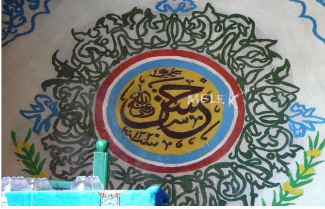
G.30: Ali Pir Civan Türbesi, iç mekân batı cephenin güney ucundaki madalyon