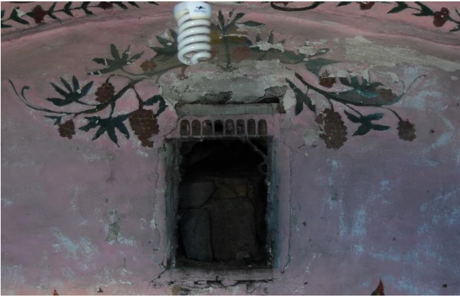
G.7: Hacı Nazır Türbesi, güney cephe yukarı kesimdeki süsleme