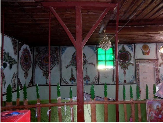
G.28: Ali Pir Civan Türbesi, iç mekân güney cephe