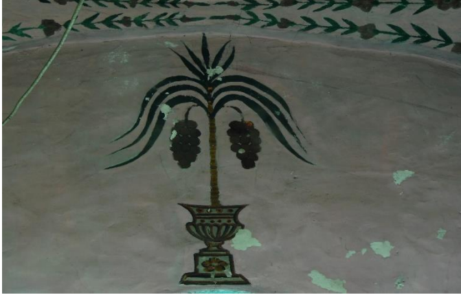
G.12: Hacı Nazır Türbesi, kuzey cephe giriş açıklığı yukarıdaki kompozisyon