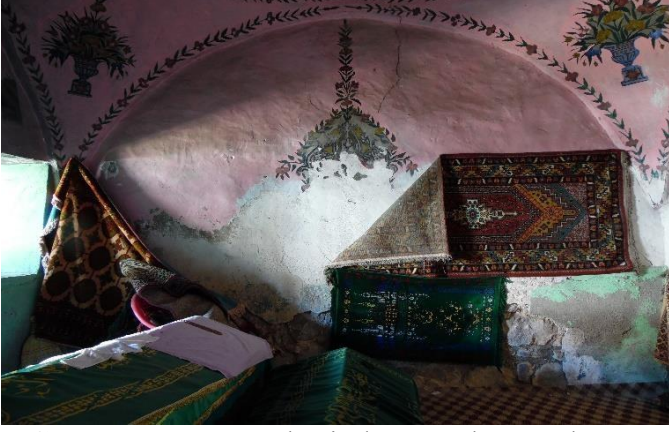
G.8: Hacı Nazır Türbesi, doğu cephe genel görünüş