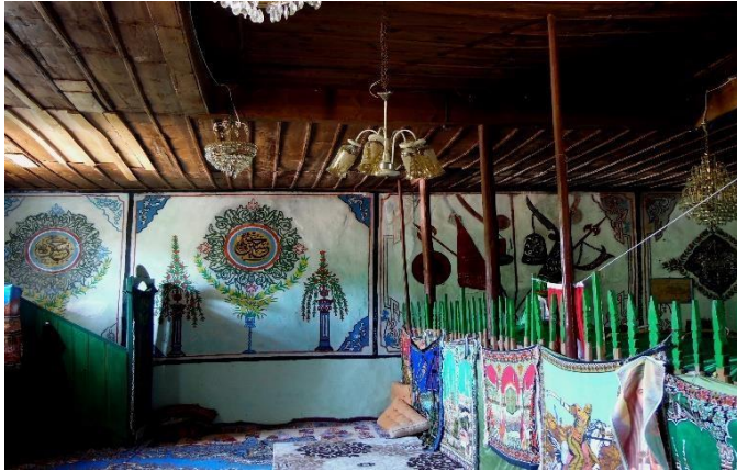
G.29: Ali Pir Civan Türbesi iç mekân batı cephe