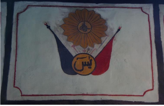
G.32: Ali Pir Civan Türbesi, mihrap üzerindeki pano