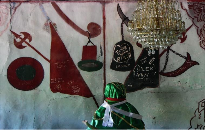
G.34: Ali Pir Civan Türbesi, batı cephenin ortasındaki pano