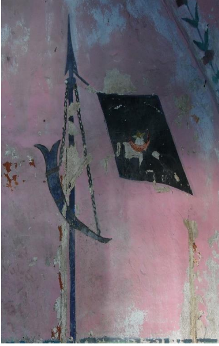
G.5: Hacı Nazır Türbesi, güney cephe batısındaki kompozisyon