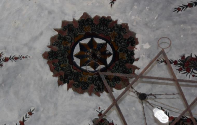
G.16: Hacı Nazır Türbesi, kubbe göbeği