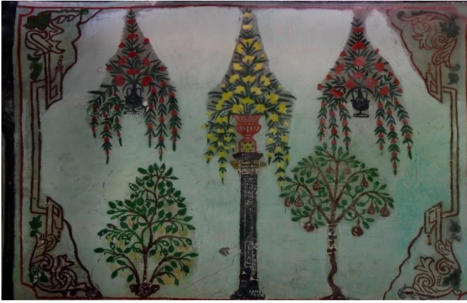
G.23: Ali Pir Civan Türbesi, iç mekân kuzey cephenin batısındaki pano