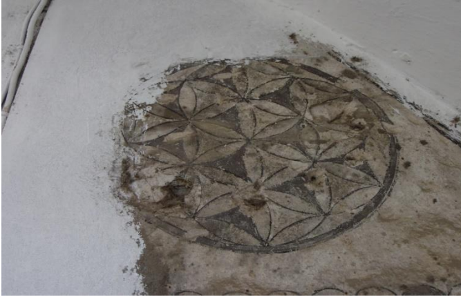
G.2: Hacı Nazır Türbesi kuzey cephe kalem işi süsleme