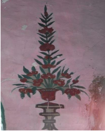
G.13: Hacı Nazır Türbesi, kuzey cephe giriş açıklığının iki yanındaki kompozisyondan detay