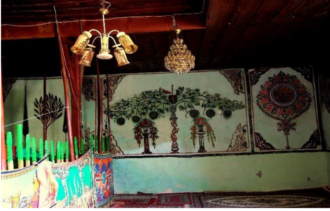
G.24: Ali Pir Civan Türbesi, iç mekân doğu cephe genel görünüş