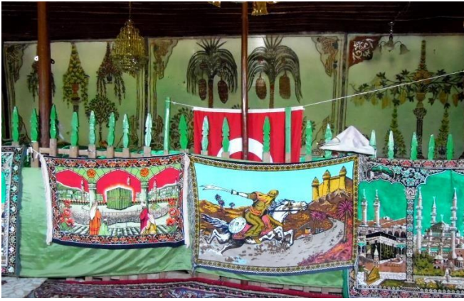
G.20: Ali Pir Civan Türbesi, iç mekân kuzey cephe genel görünüş