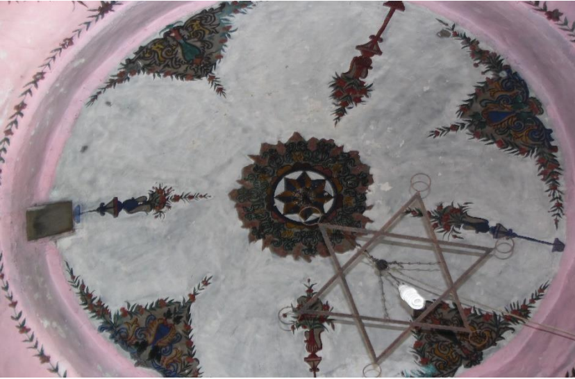
G.15: Hacı Nazır Türbesi, kubbe genel görünüş