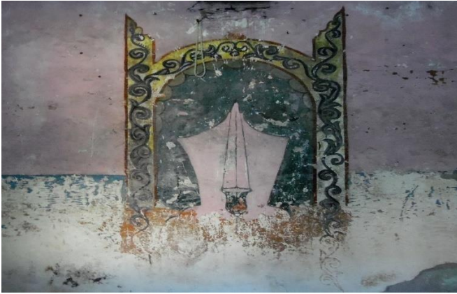
G.4: Hacı Nazır Türbesi, iç mekân güney cephe mihrap tasviri