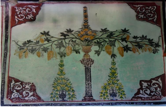
G.22: Ali Pir Civan Türbesi iç mekân kuzey cephe doğudaki pano