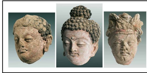
Resim 21-23: Mes Aynak'ta 2004 sonrası kazılarda ele geçen Budha başları MS 4-7. Asır. Kâbil Müzesi, Massodi, 2011