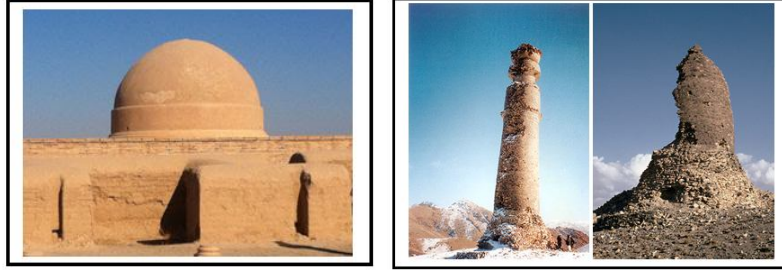
Resim 12-13: Solda: Afganistan-Özbekistan sınırında Amu Derya'nın kuzeyindeki Feyyaz Tepe'de bulunan MS I.Asra ait Budist stupası, İslâmî asırlardaki türbelere ilham kaynağı olmuş örneklerden biri. http://www.uzbekjourneys.com . sağda: MS I. Asra ait Çakari Minaresi'nin saldırıdan önceki ve sonraki hâli http://images.search.conduit.com .