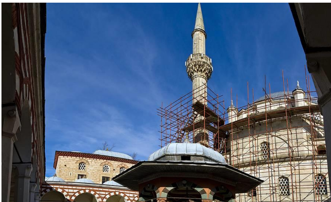
Şumnu, Şerif Halil Paşa (Tombul) Cami