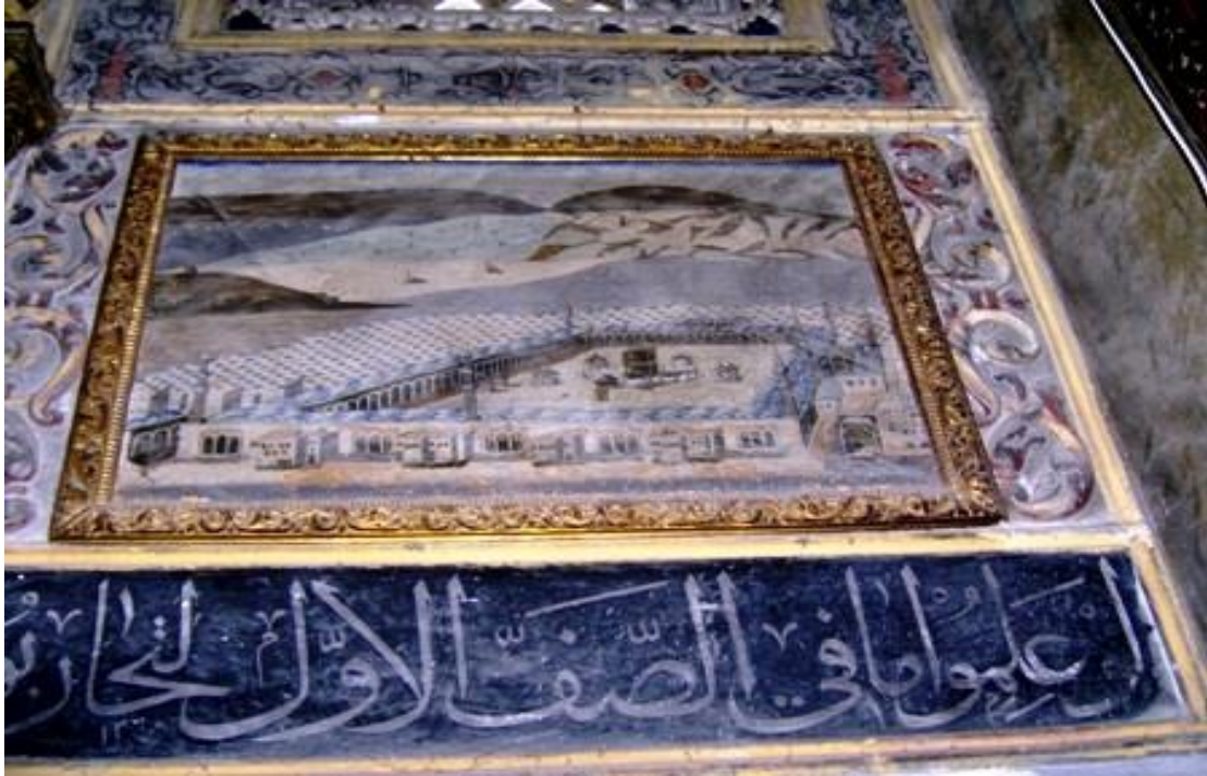
Şumnu, Şerif Halil Paşa (Tombul) Cami, iç görünüm, detay