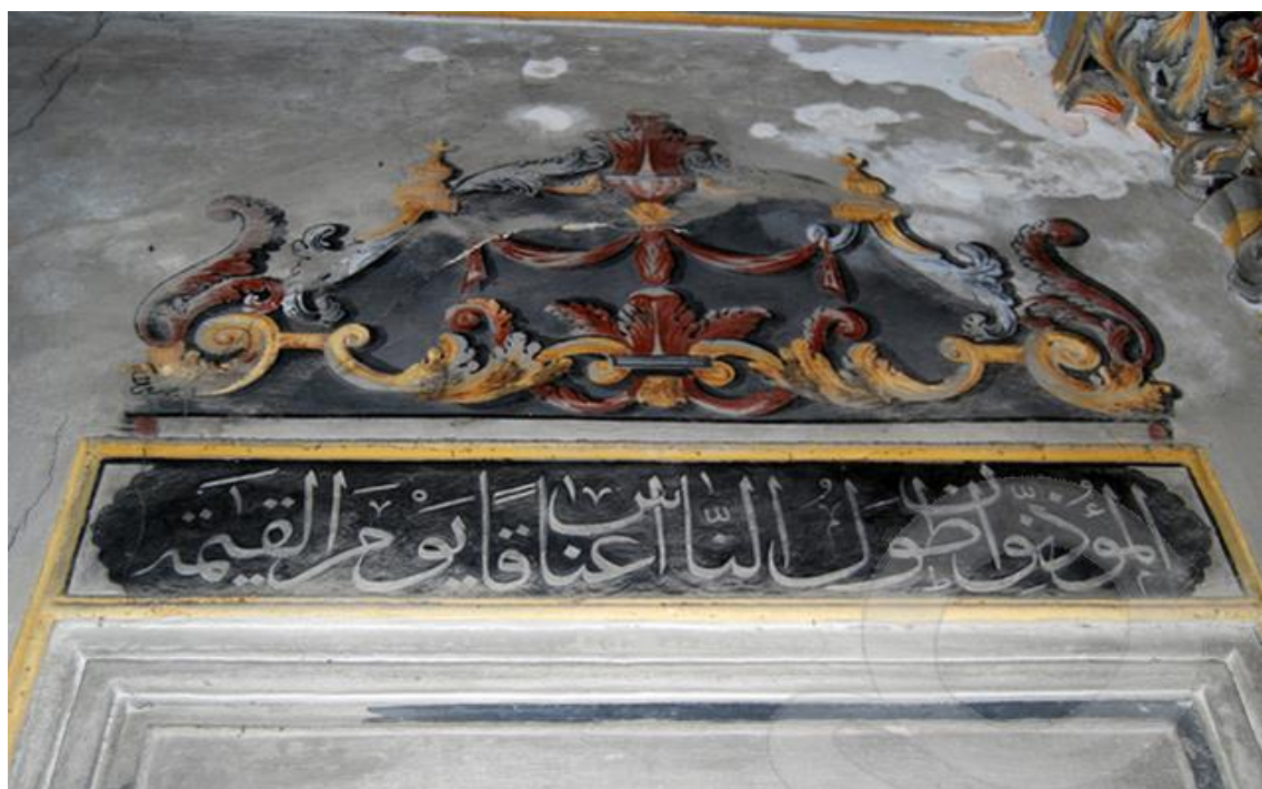
Şumnu, Şerif Halil Paşa (Tombul) Cami, pencere alınlığı, detay