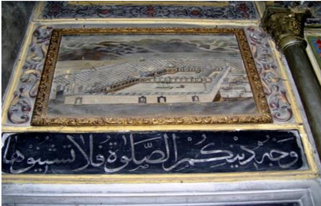
Şumnu, Şerif Halil Paşa (Tombul) Cami, iç görünüm, detay