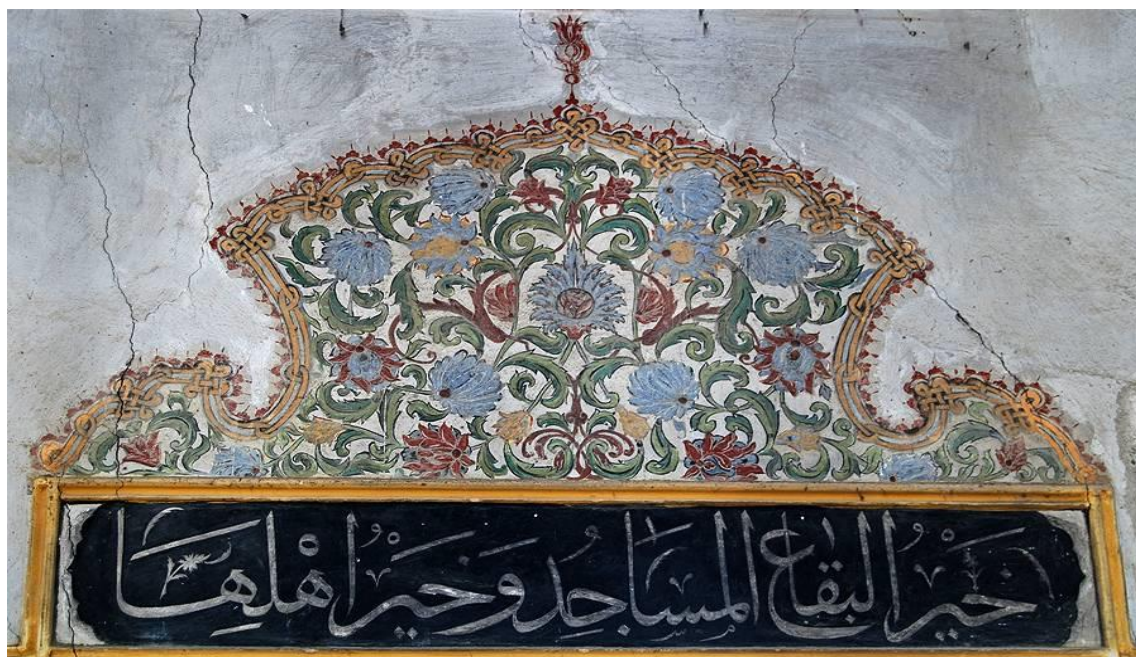
Şumnu, Şerif Halil Paşa (Tombul) Cami, pencere alınlığı, detay