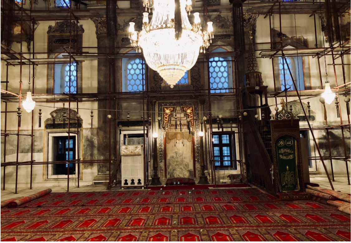
Şumnu, Şerif Halil Paşa (Tombul) Cami iç görünüm