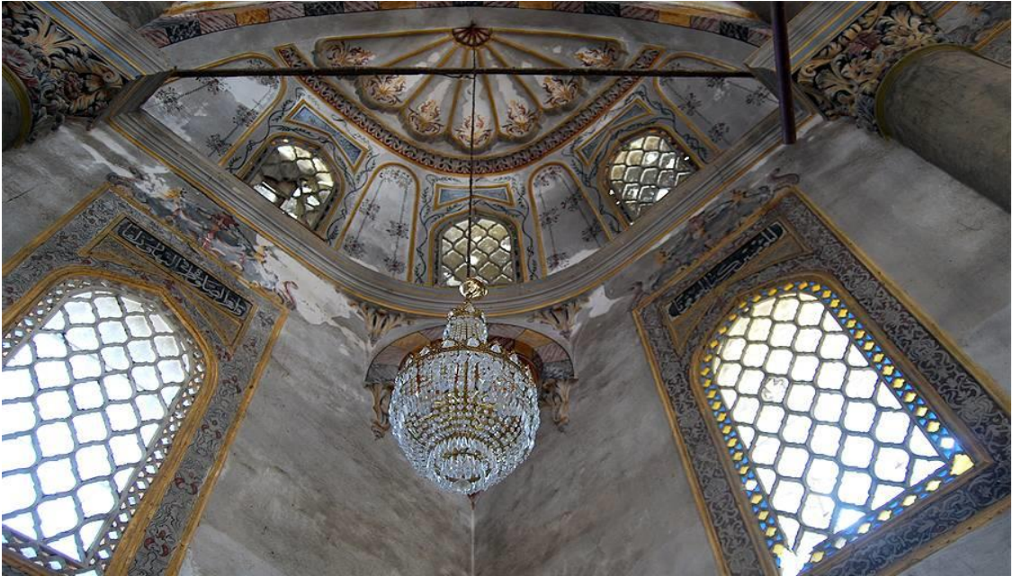
Şumnu, Şerif Halil Paşa (Tombul) Cami, iç görünüm