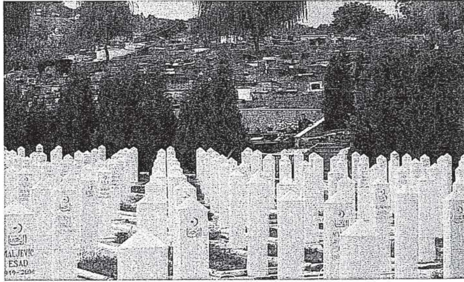
Saraybosna Mezarlığı, (Üst Kısımdaki Siyah Mezarlar Gayrimüslim Mezarları)