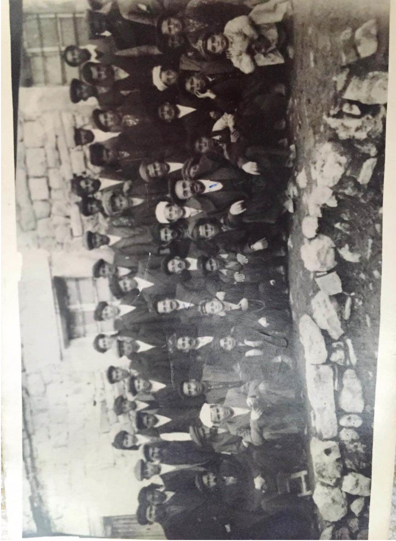
Zokayd Medresesi talebeleri